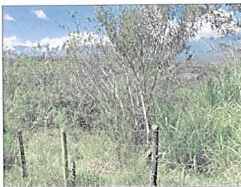
Imagen 5. Zona de Restauración. Aislamiento en el predio LOTE DE TERRENO LA PINTADA.

La zona de restauración está comprendida por una extensión de 1,3213 ha, ubicada en el predio Lote de Terreno La Pintada identificado don FMI 023-13438 y representa el 5,37% del total del área a registrar. Se debe resaltar que en esta zona se realizan actividades de restauración con la siembra de especies nativas. Este aislamiento que se viene desarrollando en el predio obedece a la compensación ambiental de la vía Pacífico 2 que incluye la siembra de unos 2000 individuos de especies nativas.