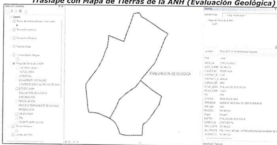
Traslape con Mapa de Tierras de la ANH (Evaluación Geológica)

Una vez y revisado el expediente RNSC 107-22 RESERVA NATURAL DOS RIOS y realizada la visita técnica por parte de la DTAO de PNNC, se considera que, dadas las condiciones de conservación, es VIABLE el registro de 17,7062 ha del predio LOTE DE TERRENO LA PINTADA, identificado con FMI No. 023-13438 y 6,8950 ha del predio LOTE Y CASA LA COLOMBIANA, identificado con FMI No. 023-3134, de los predios ubicados en la vereda La Pintada del municipio de Santa Bárbara en el Departamento de Antioquia como Reserva Natural de la Sociedad Civil dado que CUMPLEN con los requisitos técnicos exigidos en la Sección 17 - Reservas de la Sociedad Civil, del Capítulo 1 -Áreas de Manejo Especial- del Título 2 -Gestión