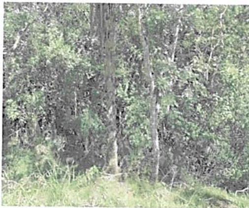
Imagen 3. Zona de Conservación predio LOTE Y CASA LA COLOMBIANA

La zona de conservación está comprendida por una extensión de 4,9844 ha, conformadas a su vez por 2,2155 ha del predio Lote de Terreno La Pintada identificado con FMI 023-13438 y por 2,7689 ha del predio Lote y Casa La Colombiana identificado con FMI 023-3134, que corresponden al 20,26% del total del área a registrar. Se encuentran mayormente abarcada por fragmentos de bosque húmedo Tropical, que componen una importante muestra ecosistémica en el municipio de Santa Bárbara Antioquia. La diversidad de especies de flora que componen esta zona está conformada tanto por especies nativas típicas como introducidas las cuales se describen en el listado de flora (ver tabla 2 listado de flora).