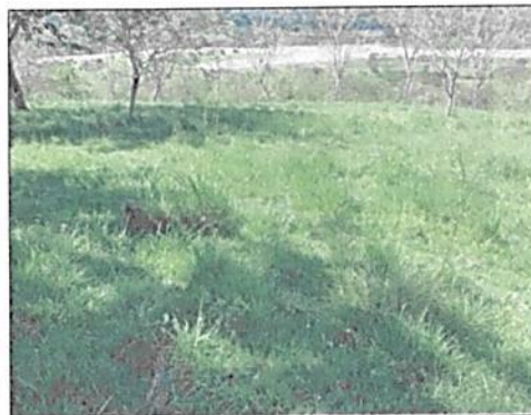
Imagen 7. Zona de Agrosistemas en el predio LOTE DE TERRENO LA PINTADA