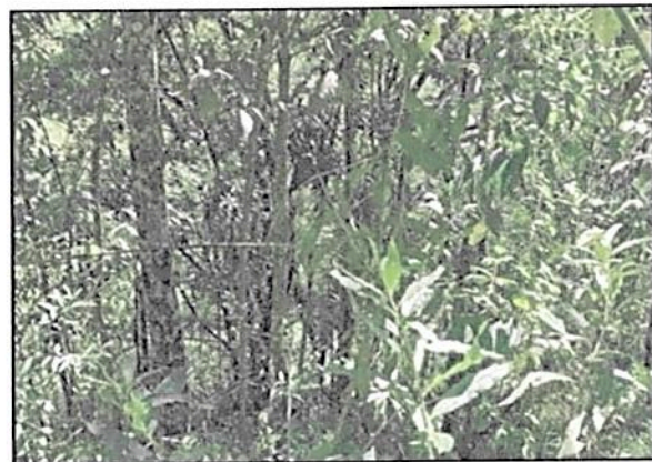
Imagen 2. Ecosistema Natural Presente en el predio LOTE DE TERRENO LA PINTADA