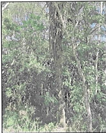
Imagen 1. Ecosistema Natural Presente en el predio LOTE Y CASA LA COLOMBIANA

De acuerdo a la capa de Ecosistemas para Colombia (E_ECCMC_Ver21_100K, 2017) El gran bioma al que pertenecen los predios son Zonobioma Húmedo Tropical y el bioma presente en esta zona es Zonobioma Húmedo Tropical Cauca Alto con coberturas de pastos, y de agrosistemas de ganadería. De acuerdo a la visita técnica adelantada desde la Dirección Territorial Andes Occidentales de Parques Nacionales se pudo observar que los predios cuentan con fragmentos de bosque húmedo tropical representado por vegetación secundaria alta en gran estado de conservación el cual cuenta con una muestra ecosistémica de interés; así mismo se comprobó que existe una actividad de agrosistemas en ganadería, ambas coberturas se evidencio que se encuentran en un ecosistema de Bosque Húmedo Tropical.