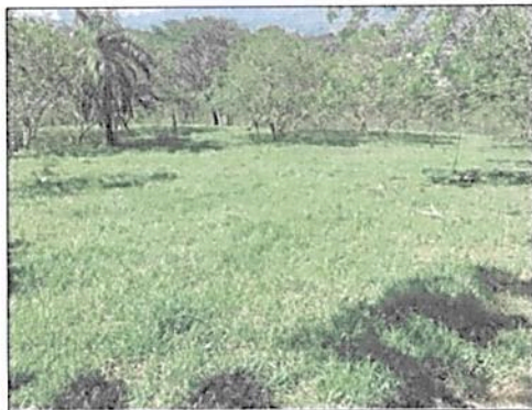
Imagen 6. Zona de Agrosistemas en el predio LOTE Y CASA LA COLOMBIANA

La zona de Agrosistemas está comprendida por una extensión de 14,1694 ha del predio Lote de Terreno La Pintada identificado don FMI 023-13438 y por 4,1261 ha del predio Lote y Casa La Colombiana identificado con FMI 023-3134. que corresponde al 74,36% del total del área a registrar. De acuerdo a lo observado en la visita y lo expresado por el encargado del predio la actividad de ganadería que se desarrolla en esta zona representa su principal actividad económica, la cual se enmarca en la prácticas sostenibles con un modelo regenerativo que permite la re-vegetalización de la flora y el cuidado de la fauna nativa del ecosistema; mencionó además que la eliminación de herbicidas ha permitido crecimiento de diferentes especies de plantas que contribuyen a la protección del suelo, a la mejora de su fertilidad y a su vez a la buena nutrición de los ganados, a la vez que se protegen las microcuencas.