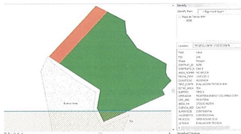
Figura 8. Traslape del predio El Silencio inscrito bajo FMI 420-9456, 0256 CAG-5 asignado a la operadora Frontera Energy Colombia Corp

De acuerdo con la verificación cartográfica realizada por el Grupo de Trámites y Evaluación Ambiental GTEA, el predio El Silencio inscrito bajo el folio de matrícula inmobiliaria No. 420-9456 presenta traslape con contrato 0256 CAG-5 asignado a la operadora Frontera Energy Colombia Corp, según lo consultado con la capa de la Agencia Nacional de Hidrocarburos (Mapa de tierras ANH) Figura 8