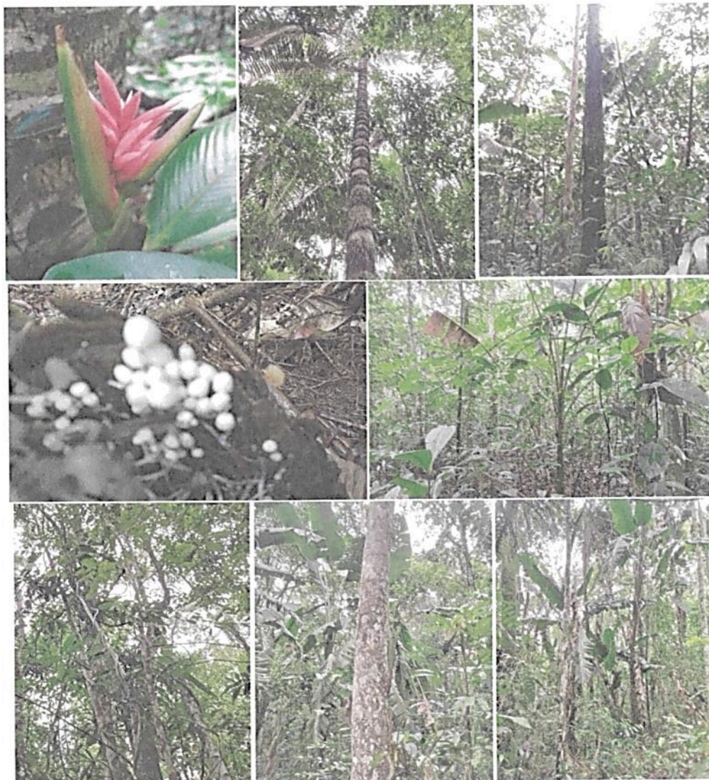
Figura 3. Flora presente en la muestra de ecosistema natural del predio "El Silencio"

Dentro de las familias con mayor número de especies se encuentran; Araceae, Arecaceae, Euphorbiaceae, Heliconiaceae, Moraceae, Myrtaceae, y Poaceae.