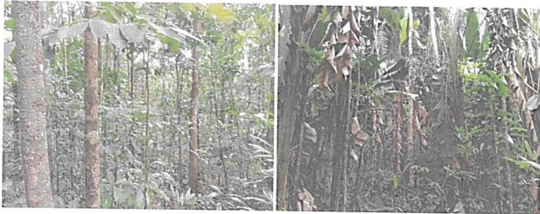
Figura 1. Muestra de ecosistema natural presente en el predio "El Silencio"

Presenta coberturas vegetales de bosque alto denso heterogéneo de tierra firme 2 . En su interior, el sotobosque es dominado por especies arbustivas y arbóreas en diferentes estados sucesionales, su dosel relativamente continuo está conformado por especies arbóreas de gran porte, y algunas especies de palmas que sobresalen del dosel.