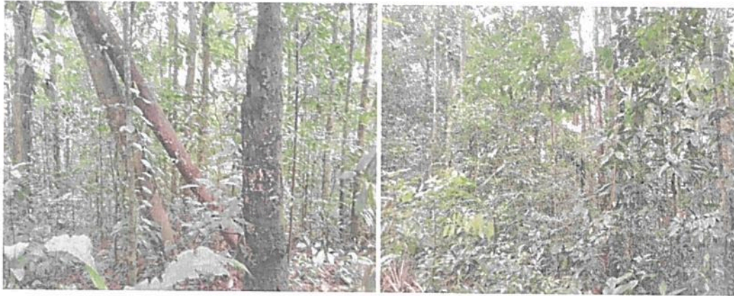
Figura 4. Zona de Conservación de la RNSC "EL SILENCIO" Bosque Húmedo tropical (BHT)

POR MEDIO DE LA CUAL SE REGISTRA LA RESERVA NATURAL DE LA SOCIEDAD CIVIL "EL SILENCIO" RNSC 204-22