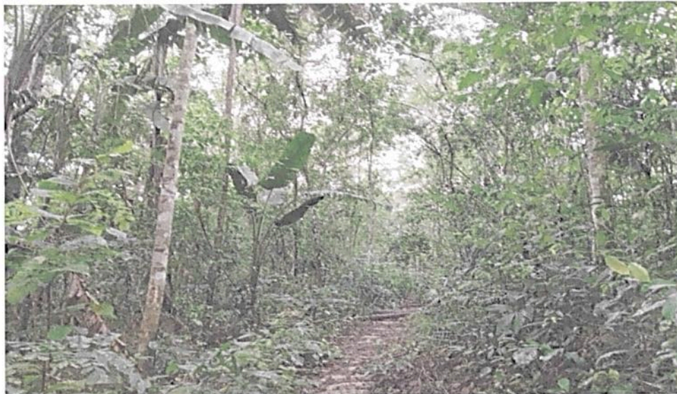
Figura 6. Zona de Uso intensivo e Infraestructura de la RNSC "EL SILENCIO"

Esta zona cuenta con 0,1501 ha es decir, el 0,33 % del área total a registrar. Está conformada por un sendero que atraviesa el predio El Silencio en su costado suroccidental.