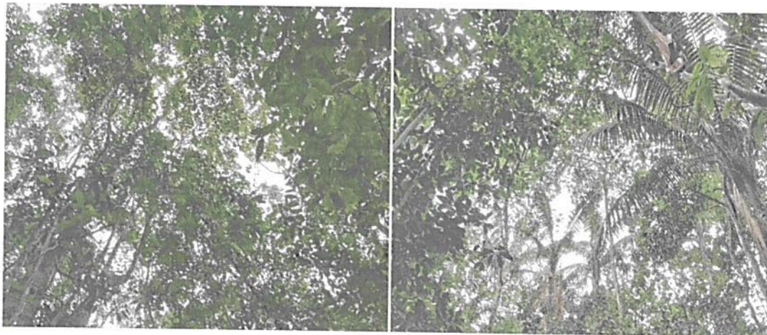
Figura 2. Muestra de ecosistema natural presente en el predio "El Silencio"

Presenta coberturas vegetales de bosque alto denso heterogéneo de tierra firme 2 . En su interior, el sotobosque es dominado por especies arbustivas y arbóreas en diferentes estados sucesionales, su dosel relativamente continuo está conformado por especies arbóreas de gran porte, y algunas especies de palmas que sobresalen del dosel.