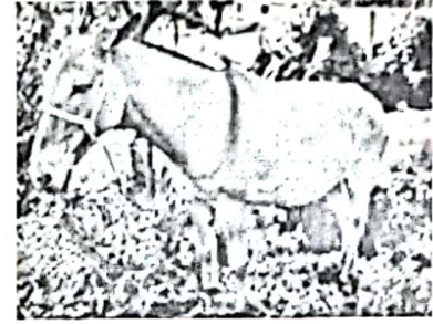
Fotografía núm. 3