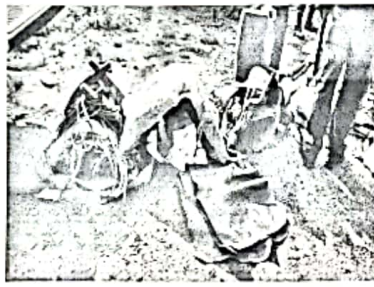
Fotografía núm. 4