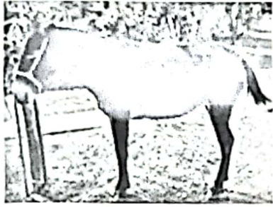
Fotografía núm. 1