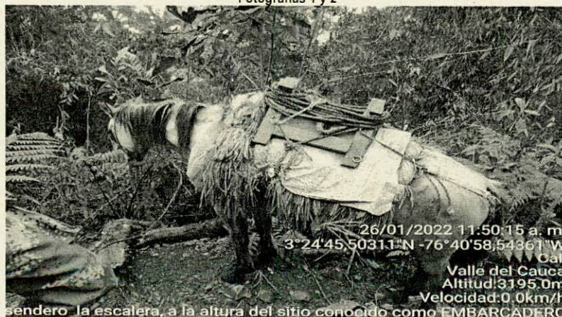
Fotografías 1 y 2