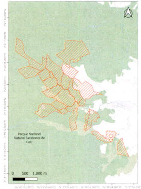
Imagen 1. En naranja los predios de la reserva Bachué. En verde el bosque andino parte de PNN Farallones de Cali. En blanco la zona urbana de Pueblo Pance