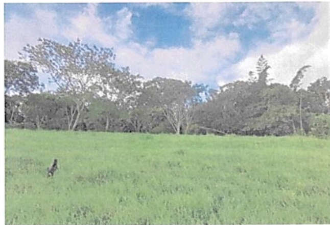
Imagen No. 7. Zona de Agrosistemas.

6.4. Zona de Agrosistemas: Esta zona corresponde a 4,3055 ha, equivalentes al 58,0% del área objeto de registro. Esta zona cuenta con cobertura de pastos principalmente y se dedica a la ganadería a menor escala.