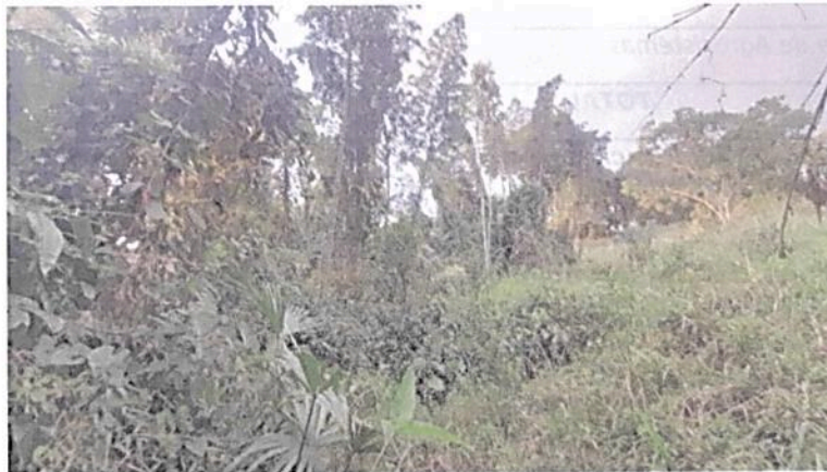
Imagen No. 6. Zona de Amortiguación y Manejo Especial.

6.3. Zona de Amortiguación y Manejo Especial: Esta zona corresponde a 0,9536 ha equivalentes al 12,8% del área objeto de registro. Esta zona corresponde a una franja de transición entre las zonas de conservación y restauración y la zona de agrosistemas, está conformada por pastos, herbazales y vegetación arbustiva.