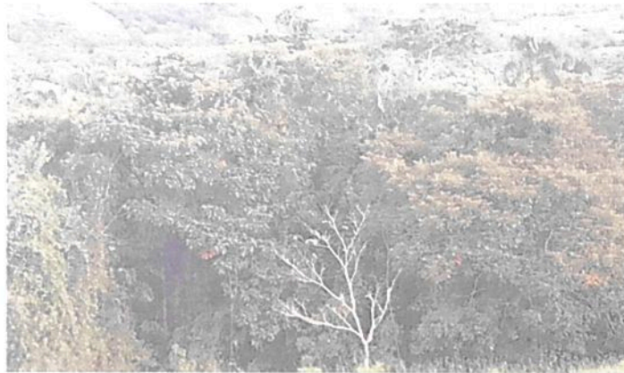
Imagen No. 1: Muestra de ecosistema natural presente en el predio "Finca Guasacuri".