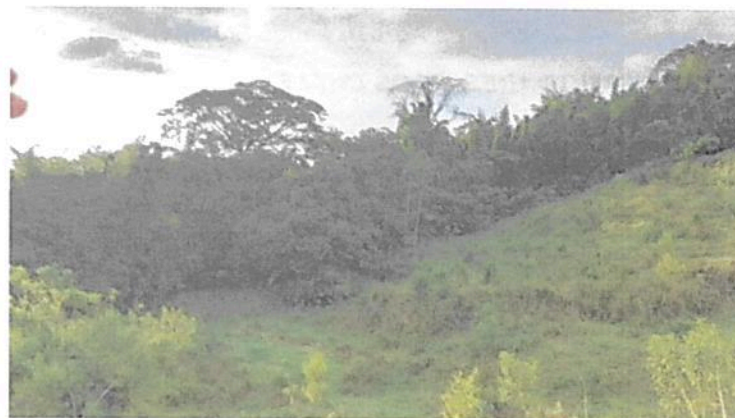
Imagen No. 5. Zona de restauración.

6.2. Zona de Restauración: Esta zona corresponde a 1,0403 ha equivalentes al 14,0% del área objeto de registro. Esta zona, se destinará a la realización de actividades de restauración asistida y no asistida del ecosistema natural, así como a la protección y regulación del recurso hídrico dado que se localiza en un área de alta recarga hídrica al interior del predio.