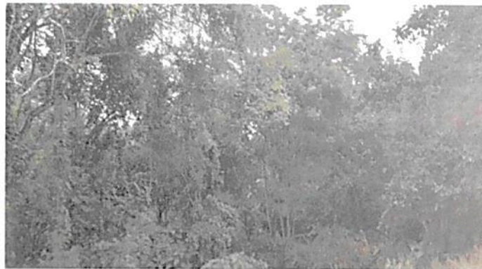
Imagen No. 4. Zona de conservación. Fuente: Visita técnica PNNC.

6.1. Zona de Conservación: Esta zona corresponde a 1,1286 ha, equivalentes al 15,2% del área objeto de registro. Esta zona está conformada por la muestra de ecosistema natural de Bosque húmedo tropical, con bosques densos a abiertos y alturas promedio en algunas zonas hasta de 20 metros. Esta zona alberga especies de flora y fauna de alta importancia ecológica para la región, así mismo, protege nacimientos de agua y zonas de alta recarga hídrica, importante para favorecer la oferta de bienes y servicios ecosistémicos como la regulación de ciclos hidrológicos y la oferta de hábitats para especies de flora y fauna.