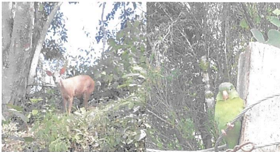
Imágenes No. 2 y 3: Fauna registrada en la RNSC.

Mamíferos como oso hormiguero, ardilla, oso perezoso, iguana, venado de cola blanca, zorrillo, zorro gris, zorro perro, guatín entre otras. Aves como el carpintero, turpial, colibrí, búho, águila, garza blanca, loro catarnica, mirla, garrapatero, lechuza, armadillo, mataballo, tórtola entre otras. Reptiles como la serpiente coral, cazadora, serpiente bejuquillo, talla x, iguana, salamandra, entre otras.