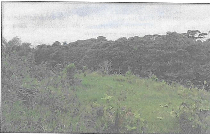
Figura 5. Zona de Amortiguación y Manejo Especial de la RNSC "LA ESPERANZA 2"

Esta zona cuenta con 4,0980 ha. es decir, el 1,95 % del área total a registrar. Está conformada por una franja de protección entre la zona de agrosistemas y la zona de conservación. Está área está destinada para su recuperación natural.