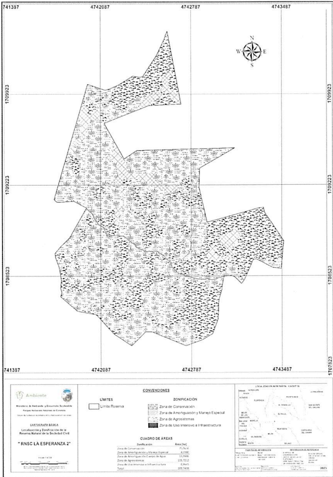
Figura 9. Zonificación de la Reserva Natural de la Sociedad Civil "LA ESPERANZA 2"