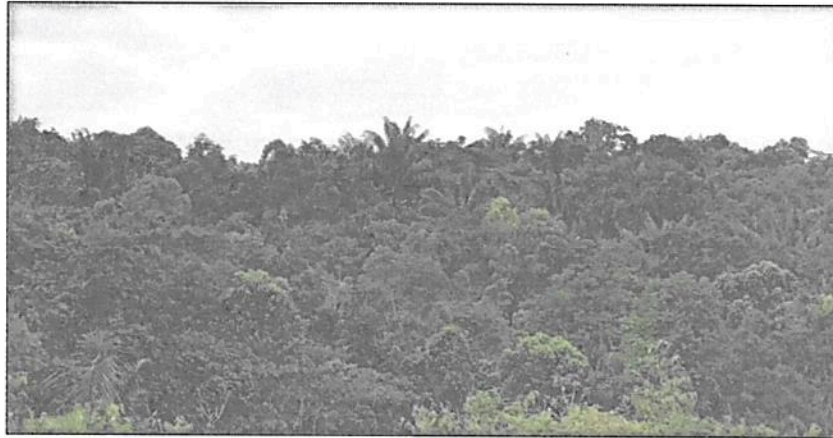
Figura 1. Muestra de ecosistema natural presente en el predio "La Esperanza"

Presenta coberturas vegetales de bosque alto denso heterogéneo de tierra firme 2 , y bosque ripario. En su interior, el sotobosque es dominado por especies arbustivas y arbóreas en diferentes estados sucesionales, su dosel relativamente continuo está conformado por especies arbóreas de gran porte, y algunas especies de palmas que sobresalen del dosel.