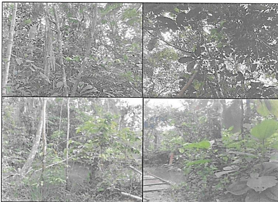
Figura 2. Muestra de ecosistema natural presente en el predio "La Esperanza"

Adicionalmente, se observan llanuras aluviales en algunas zonas del bosque donde se forma un complejo de humedales inundables propios de piedemonte amazónico, estos humedales hacen parte de la cuenca del río Orteguaza 3