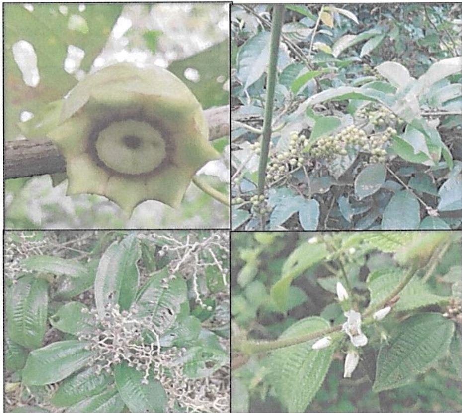
Figura 3. Flora presente en la muestra de ecosistema natural del predio "La Esperanza"

Dentro de las familias con mayor número de especies se encuentran; Araceae, Arecaceae, Euphorbiaceae, Heliconiaceae, Moraceae, Myrtaceae, y Poaceae