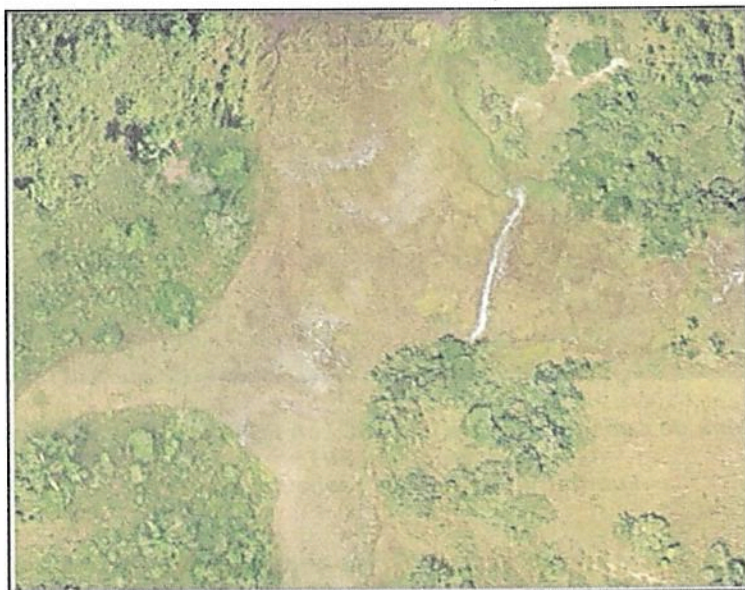
Figura 6. Zona de Amortiguación y Manejo Especial de la RNSC "LA ESPERANZA 2" Fuente: Reseña descriptiva de la RNSC "LA ESPERANZA 2" suministrado por el propietario mediante radicado No 20224600147812 de 01/11/2022. Fotografía tomada con drone.

Esta zona cuenta con 13,9986 ha. es decir, el 6,67 % del área total a registrar. Está conformada por un complejo de humedales inundables de vegetación herbácea y arbustiva que se forman en las llanuras aluviales del piedemonte amazónico. Esta área está destinada para su recuperación natural y manejo especial