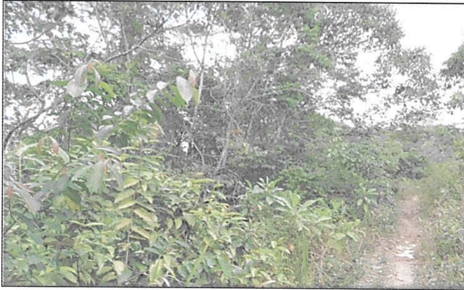
Figura 8. Zona de Uso intensivo e Infraestructura de la RNSC "LA ESPERANZA 2"

Esta zona cuenta con 0,8665 ha. es decir, el 0,41 % del área total a registrar. Está conformada por dos senderos que atraviesan la reserva de orienta a occidente