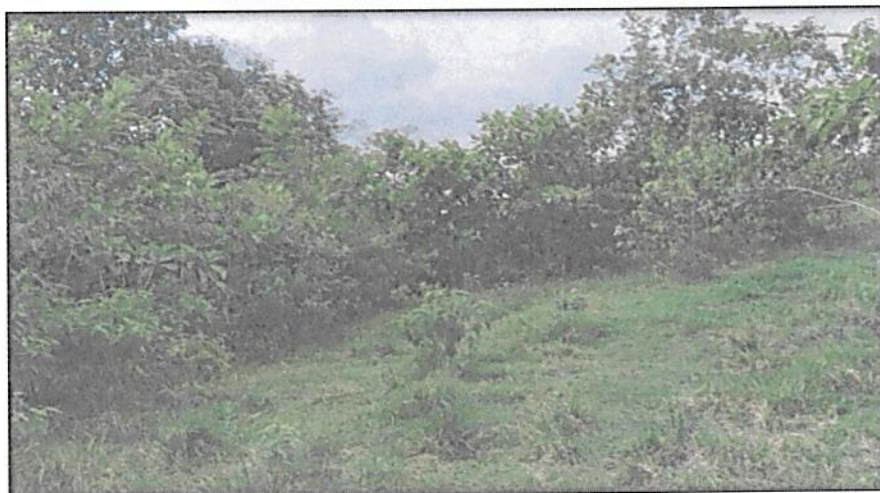
Figura 7. Zona de Agrosistemas de la RNSC "LA ESPERANZA 2"

Esta zona cuenta con 115,7212 ha. es decir, el 55,17 % del área total a registrar. Está conformada por zonas con coberturas de pastizales. Esta área está destinada para producción ganadera sostenible.