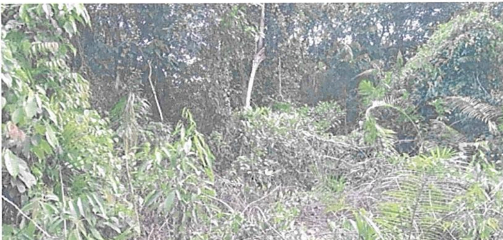
Figura 5. Flora registrada en la Zona de Conservación de la RNSC "MESÓN".