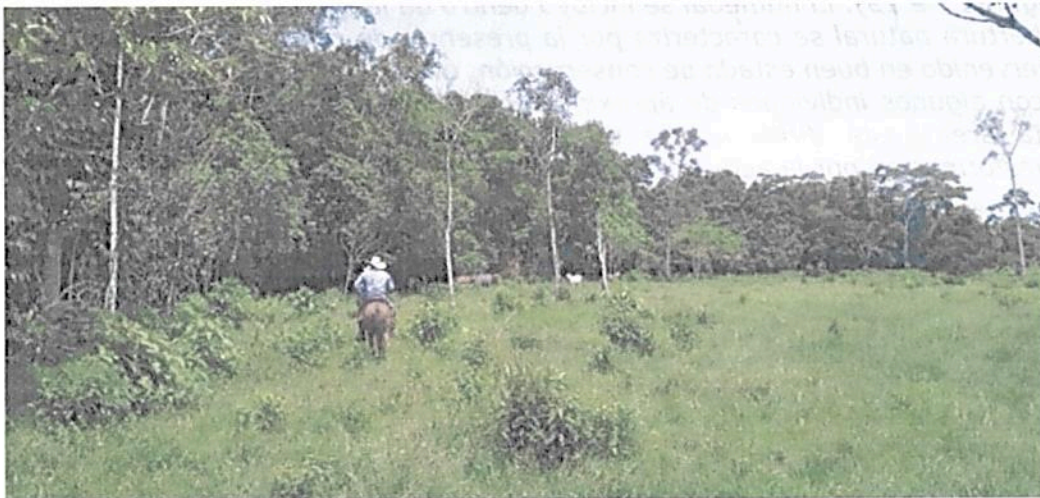
Figura 9. Vista de la Zona de Conservación de la RNSC "MESÓN".