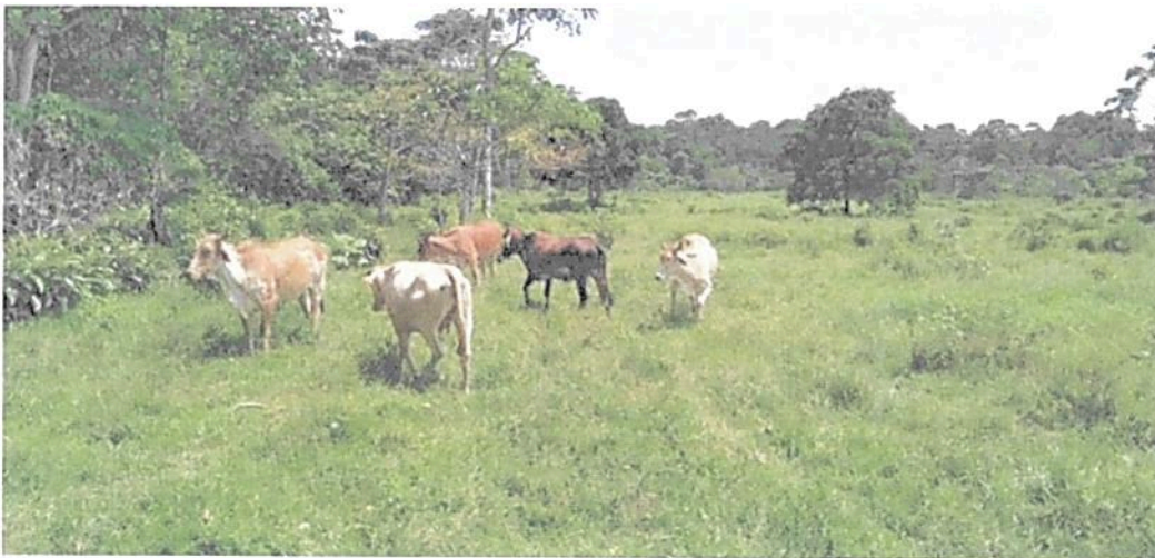
Figura 20. Zona de Agrosistemas de la RNSC "MESÓN".