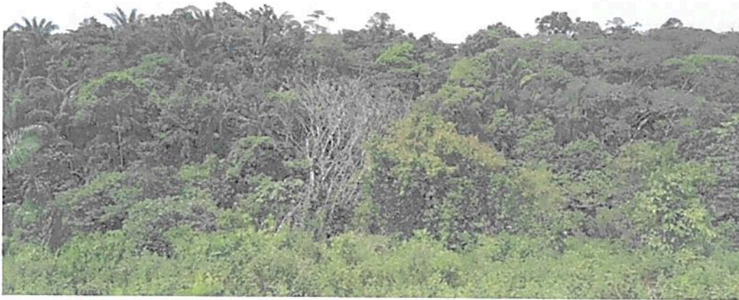
Figura 1. Muestra de ecosistema presente en la RNSC "MESÓN".