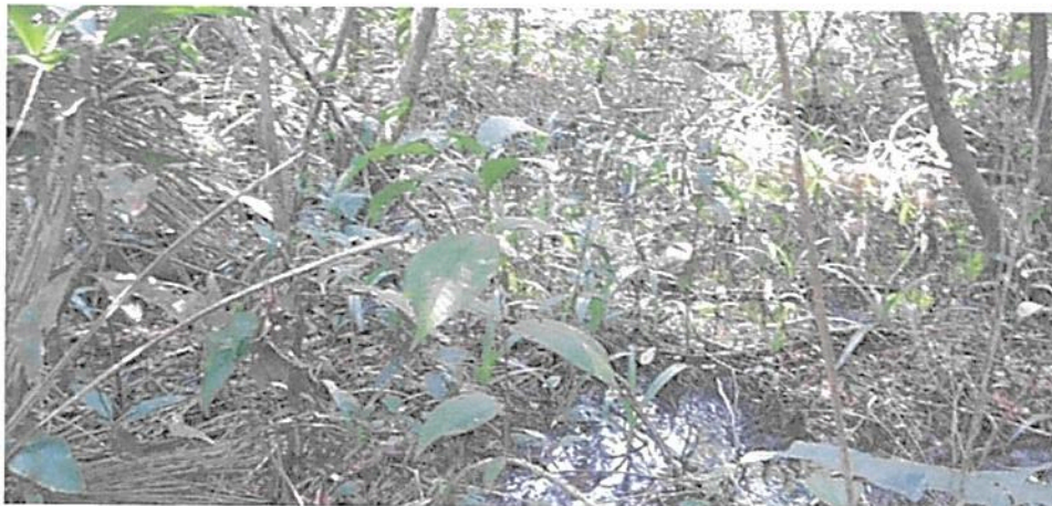
Figura 13. Interior de cananguchal de la Zona de Conservación en la RNSC "MESÓN".