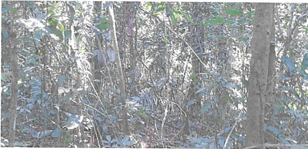
Figura 12. Interior de la Zona de Conservación en la RNSC "MESÓN".