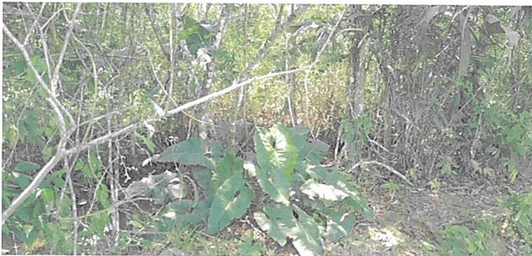
Figura 2. Flora registrada en la Zona de Conservación de la RNSC "MESÓN".

A continuación, se menciona la información aportada en la solicitud de registro sobre la flora presente en la RNSC "MESÓN" 3 "Según inventarios realizados en la zona es posible identificar (...) [50 géneros agrupados en 17 familias], se reportan 59 especies vegetales. Las familias que se destacan por el mayor número de especies son Poaceae, Araceae, Euphorbiaceae, Heliconiaceae y Myrtaceae". Algunas de las especies registradas durante la visita técnica se relacionan en las Figuras 2 a 5.