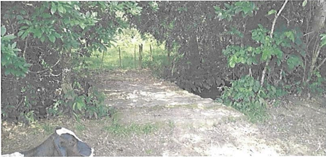
Figura 14. Puente sobre el Caño Negro registrado en la RNSC "MESÓN".

Esta zona corresponde a 8,4185 ha, equivalentes al 12,31 % del área objeto de registro. Con el objetivo de propiciar la continuidad y protección de la zona de conservación se separa esta de la zona de Agrosistemas mediante una franja de Zona de Amortiguación de 5 m de ancho. Esta zona se encuentra conformada por cobertura "en descanso, que presenta un proceso de sucesión secundaria (Figuras 14 y 18). Esta área correspondía a pasturas que por cuestiones principales de manejo se degradaron; así mismo por causa del descanso la naturaleza comienza a regenerarse al punto de volver a su estado inicial (bosque), siempre y cuando las condiciones como la capacidad para regenerarse (resiliencia) lo permita." Es un "área de transición entre el paisaje antrópico y las zonas de conservación, o entre aquel y las áreas especiales para la protección como los nacimientos de agua, humedales y cauces." 6