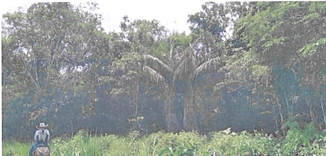
Figura 4. Flora registrada en la Zona de Conservación de la RNSC "MESÓN".