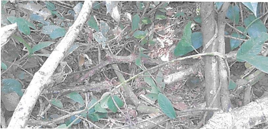
Figura 6. Madriguera inactiva de gurre registrada en la RNSC "MESÓN".

Para el grupo de las aves se reportan 55 especies; "las especies más comunes fueron Milvago chimachima , Ortalis gutata , Cyanocorax violaceus , Penelope jacquacu , registrados durante el recorrido, generalmente estas especies son comunes en boques húmedos en estados óptimos de conservación. De acuerdo con el listado de la UICN (2001) la gran mayoría de las especies están dentro de la categoría de menor preocupación (LC). Según las listas rojas de la UICN (Unión Internacional Para la Conservación de la Naturaleza)".