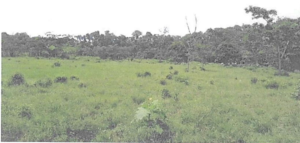
Figura 17. Vista de la Zona de Amortiguación y Manejo Especial de la RNSC "MESÓN".