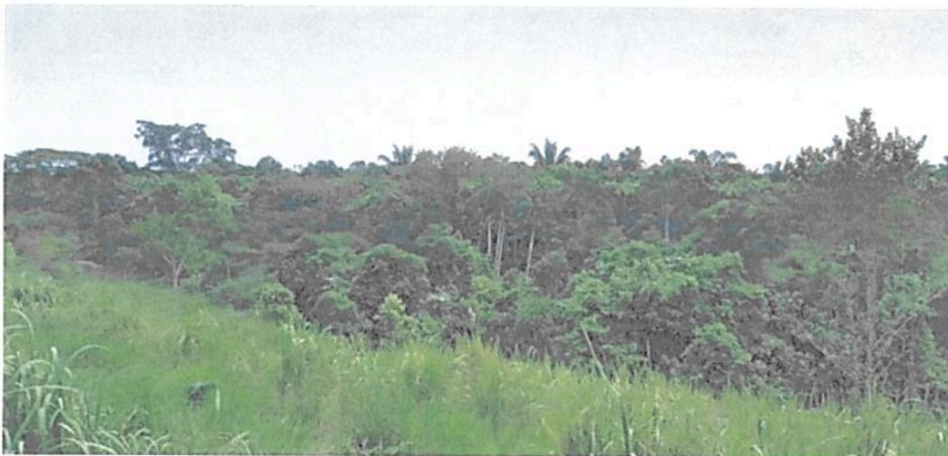
Figura 7. Vista de la Zona de Conservación de la RNSC "MESÓN".

Esta zona corresponde a 54,1098 ha, equivalentes al 79,13 % del área objeto de registro. Se encuentra conformada por una muestra de ecosistema natural de Bosque Húmedo Tropical, Cananguchales y las Fuentes Hídricas asociadas; se encuentra "ubicada en zona de lomerío" conformando gran parte de la reserva (Figuras 7 a 13). El humedal se incluyó dentro de la zona de conservación. Esta cobertura natural se caracteriza por la presencia de relictos de bosque natural intervenido en buen estado de conservación, con alturas promedio de 12 metros y con algunos individuos de aproximadamente 25 metros. "(...) el manejo [en esta área] está dirigido ante todo a evitar su alteración, degradación o transformación por la actividad humana" 5