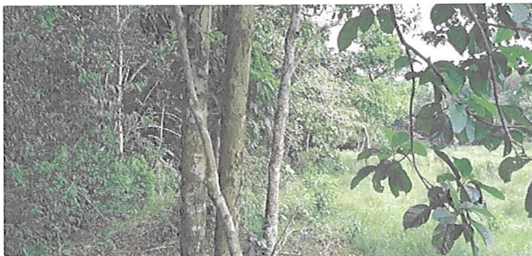
Figura 10. Borde de bosque de la Zona de Conservación en la RNSC "MESÓN".