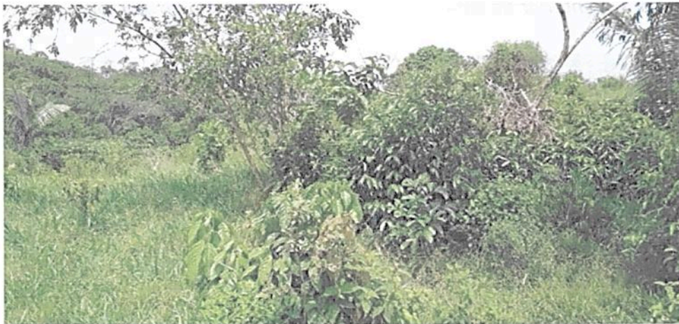
Figura 15. Vista de la Zona de Amortiguación y Manejo Especial de la RNSC "MESÓN".