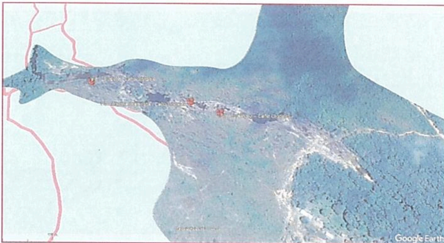
Gráfico 3. Punto ubicado fuera de los límites del PNN Sierra de La Macarena.

Punto 3. El tapete - Caño cristales ( 2^{\circ}15'53.00''N / -73^{\circ}47'48.00''O ):