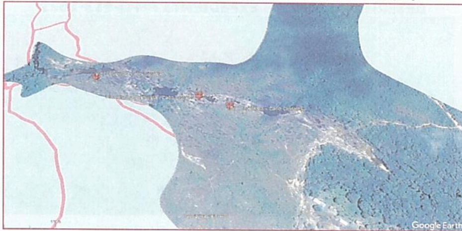
Gráfico 2. Punto ubicado fuera de los límites del PNN Sierra de La Macarena.

“POR MEDIO DE LA CUAL SE NIEGA UN PERMISO PARA LA REALIZACIÓN DE OBRAS AUDIOVISUALES EN EL PARQUE NACIONAL NATURAL SIERRA DE LA MACARENA Y SE TOMAN OTRAS DETERMINACIONES – EXPEDIENTE PFFO-013-2023”