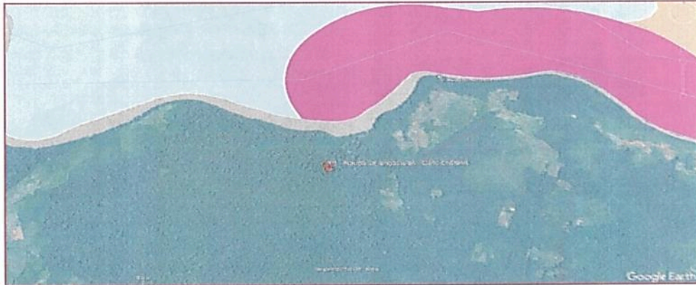
Gráfico 5. Punto ubicado fuera de los límites del PNN Sierra de La Macarena en el PNN Tinigua.

Punto 6. Caño cristalitos - Caño cristales ( 2^{\circ}13'41.07''N / -73^{\circ}47'43.76''O ):