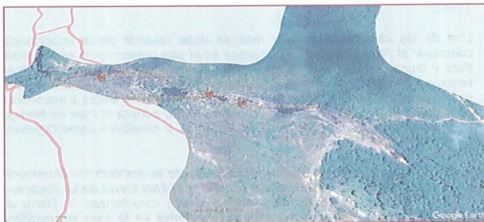
Gráfico 1. Punto ubicado fuera de los límites del PNN Sierra de La Macarena.

Punto 1. Los Ocho - Caño Cristales (2°15'50.00"N / -73°47'39.00"O):