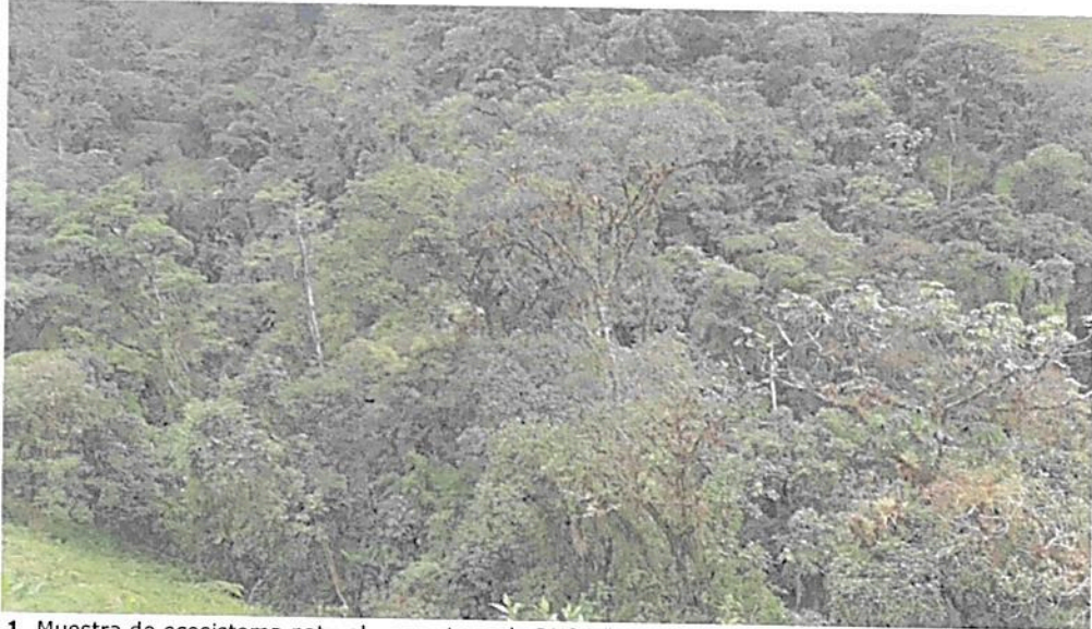
Figura 1. Muestra de ecosistema natural presente en la RNSC "EL PORVENIR". Fuente: visita técnica PNNC 13 al 17 de marzo de 2023.

De acuerdo con la visita técnica realizada a la RNSC "EL PORVENIR", esta se encuentra localizada en un rango altitudinal entre los 2148 y 2568 msnm, encontrando que el tipo de ecosistema predominante es el Bosque Andino (Figura 1).