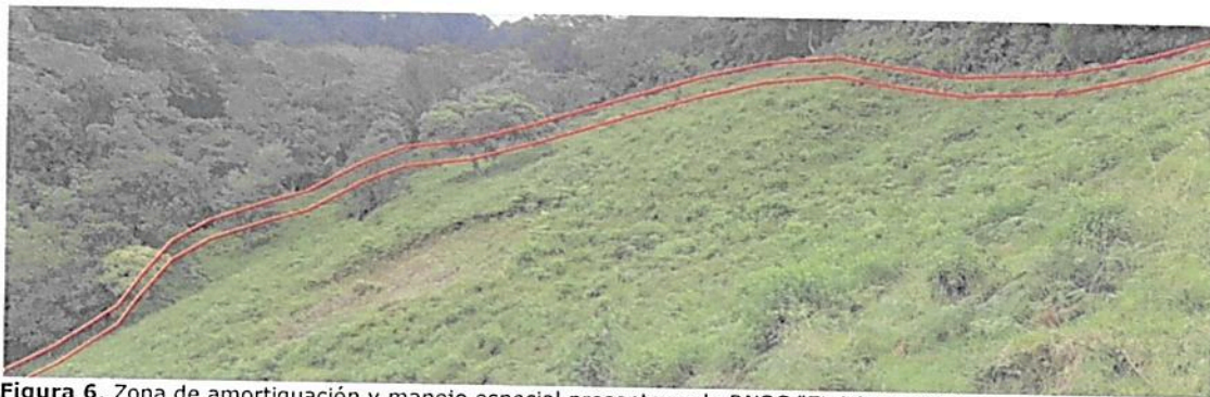
Figura 6. Zona de amortiguación y manejo especial presente en la RNSC "EL PORVENIR".

Esta zona corresponde al 1,32 % del total del área a registrar, presentando una extensión total de 0,5587 ha; esta zona se encuentra bordeando la zona de conservación, es el límite máximo de acercamiento de bovinos, equinos u otro animal doméstico, sobre esta zona se debe evitar adelantar algún tipo de acción que perturbe la zona de conservación, al contrario, se espera que se presente un proceso de sucesión y restauración ecológica participativa que apoye los procesos de restauración del ecosistema. Figura 6