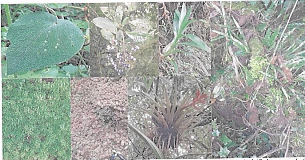
Figura 2. Flora observada en la RNSC "EL PORVENIR".