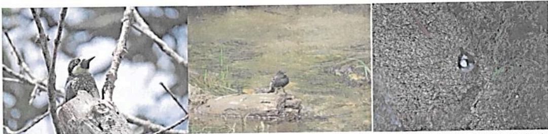
Figura 3. Fauna observada en la RNSC "EL PORVENIR".

Durante el recorrido realizado se logró visualizar especies de reptiles como lagartijas, una amplia variedad de aves propias del bosque andino ( Psarocolius angustifrons , Melanerpes formicivorus , Vanellus chilensis , Cinclus leucocephalus , Zonotrichia capensis , Mimus gilvus , Sayornis nigricans , etc). Respecto a los artrópodos se evidenció un amplia variedad de órdenes lepidoptera (mariposas, polillas), himenópteros (hormigas, avispas, abejas, abejorros), odonatos (libélulas, caballitos del diablo), araneae (arañas) entre otros. (Figura 3.)