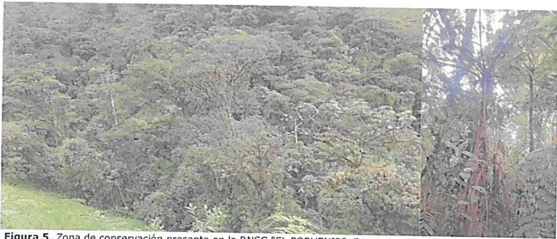
Figura 5. Zona de conservación presente en la RNSC "EL PORVENIR".

Esta zona corresponde al 69,42 % del total del área a registrar, presentando una extensión total de 29,4196 ha. Está conformada por el Bosque Andino, el cual se encuentra en un buen estado de conservación, lo cual lo hace un predio ideal para la producción de servicios ecosistémicos como el hábitat para especies, captura de carbono, ciclo de nutrientes, ciclo del agua, regulación de la calidad del aire, regulación climática, formación del suelo, control de la erosión, entre muchos más; por otra parte, este predio es un corredor biológico de gran importancia para las especies de fauna presentes en la región ya sean residentes permanentes o de paso como las migratorias. Es importante, que sobre esta zona no se realicen actividades que afecten o perturben la flora y fauna, de esta forma se estará garantizando el estado de conservación en que se encuentra el ecosistema natural (Figura 5).