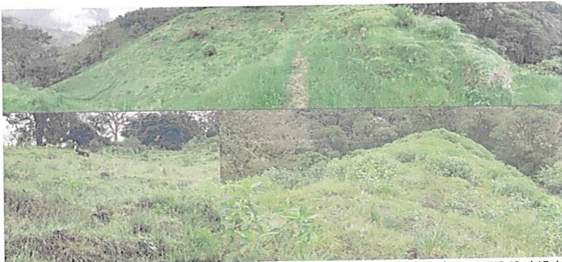
Figura 8. Zona de Agrosistemas presente en la RNSC "EL PORVENIR"

Esta zona corresponde al 29,10 % del total del área a registrar, presentando una extensión total de 12,3358 ha; Sobre esta zona se encuentra conformada por varios potreros los cuales son utilizados para el mantenimiento de algunas vacas. Es importante mencionar que aunque una parte de la zona se está dejando llenar de rastrojos, hierbas y otros, esta zona no está contemplada para iniciar procesos de restauración, con el tiempo se va utilizar para siembra de cultivos de pancoger, se recomienda que se implemente un cultivo silvopastoril y que al momento de utilizar esta área no se afecte la zona de conservación. (Figura 8).