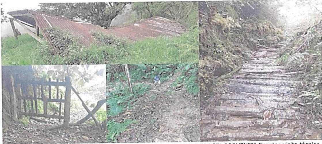
Figura 7. Zona de Uso Intensivo e Infraestructura presente en la RNSC "EL PORVENIR"

Esta zona corresponde al 0,16 % del total del área a registrar, presentando una extensión total de 0,0674 ha; Sobre esta zona se encuentran diferentes construcciones como una casa, corrales, vías de acceso, senderos. (Figura 7).