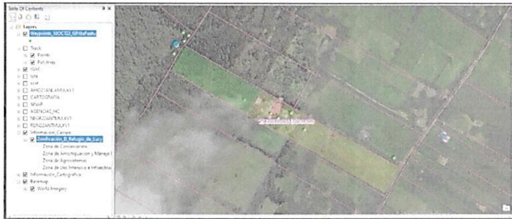
Figura 4. Los puntos tomados por fuera del polígono donde se encuentra el Bosque de transición encontrado.

Por tanto, la porción del predio recorrido y coincidente con el polígono catastral del predio "SIN DIRECCION REFUGIO LUCY" inscrito bajo el folio de matrícula inmobiliaria No.50C- 1228874 y el polígono suministrado por el usuario no cumple con los requisitos mínimos exigidos para el registro como Reserva Natural de la Sociedad Civil citados en el artículo 2.2.2.1.17.1, dado que no contiene una muestra de ecosistema natural.