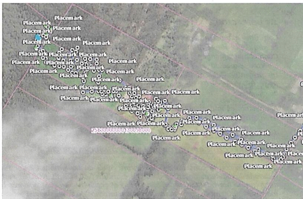
Figura 1: Puntos y Recorrido realizado en la Visita del 10/10/2022 al predio "SIN DIRECCION REFUGIO LUCY" inscrito bajo el folio de matrícula inmobiliaria No.50C- 1228874

De acuerdo con la consulta del folio de matrícula inmobiliaria se relaciona el área del predio "SIN DIRECCION REFUGIO LUCY" inscrito bajo el folio de matrícula inmobiliaria No.50C- 1228874, y el área solicitada para el registro de la RNSC "EL REFUGIO DE LUCY" con el fin de verificar que el área solicitada no supere a la indicada en el folio de matrícula inmobiliaria. En la Tabla 1 se relaciona el área de acuerdo con el folio de matrícula inmobiliaria y el área objeto de registro para el predio mencionado que conforman la RNSC "EL REFUGIO DE LUCY"