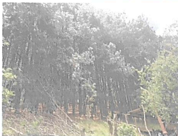
Figura 2 . Presencia de Eucalipto y Pino en la parte identificada como conservación del predio SIN DIRECCION REFUGIO LUCY" inscrito bajo el folio de matrícula inmobiliaria No.50C- 1228874