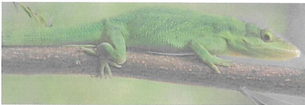
Figura 6. Fauna observada en la RNSC "LA TIERRITA".

Durante el recorrido realizado se logró visualizar especies de reptiles como lagartijas, una amplia variedad de aves propias del bosque húmedo montano bajo (bh-MB). Respecto a los artrópodos se evidenció un amplia variedad de órdenes lepidoptera (mariposas, polillas), himenópteros (hormigas, avispas, abejas), odonatos (libélulas, caballitos del diablo), araneae (arañas) entre otros (Figura 6).