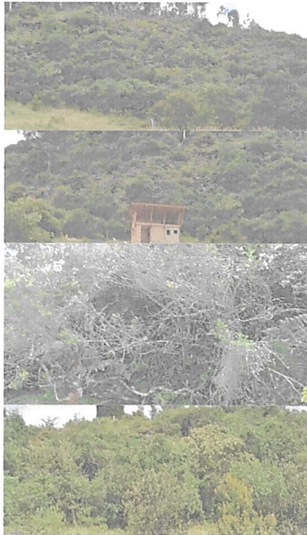
Figura 2. Muestra de ecosistema natural presente en la RNSC "LA TIERRITA". De arriba hacia abajo zona de ecosistema natural presente de los predios denominados "Sin Dirección. El Terreno", inscrito bajo el folio de matrícula inmobiliaria No.070-33192, "Sin Dirección. El Potrero", inscrito bajo el folio de matrícula inmobiliaria No.070-58222, "Lote San Benito", inscrito bajo el folio de matrícula inmobiliaria No.070-174554 y "Lote El Potrero", inscrito bajo el folio de matrícula inmobiliaria No.070-116261

POR MEDIO DE LA CUAL SE REGISTRA LA RESERVA NATURAL DE LA SOCIEDAD CIVIL "LA TIERRITA" RNSC 103-22