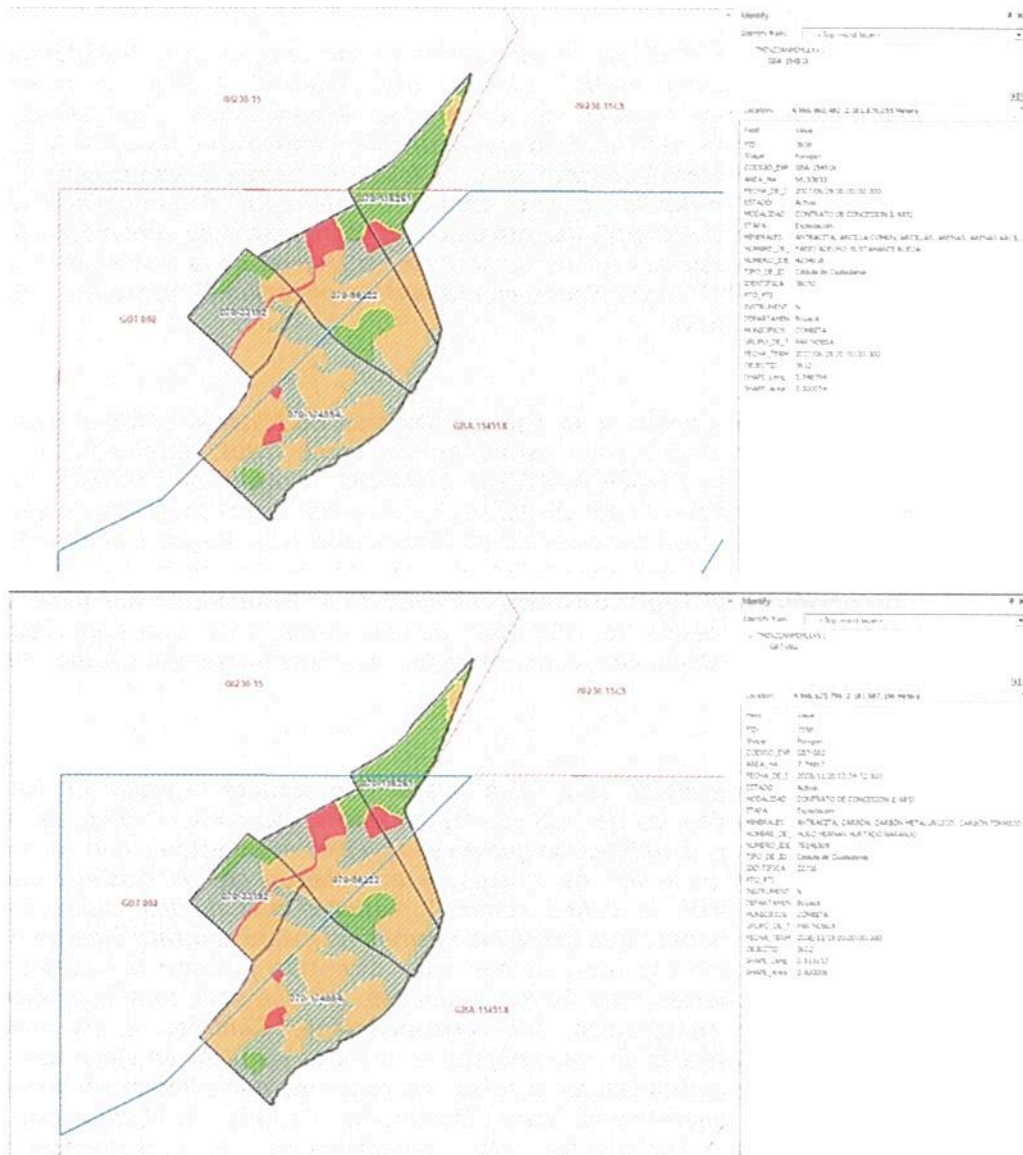
Figura 12. Traslapes de los predios denominados "Sin Dirección. El Terreno", inscrito bajo el folio de matrícula inmobiliaria No.070-33192, "Sin Dirección. El Potrero", inscrito bajo el folio de matrícula inmobiliaria No.070-58222, "Lote San Benito", inscrito bajo el folio de matrícula inmobiliaria No.070-174554 y "Lote El Potrero", inscrito bajo el folio de matrícula inmobiliaria No.070-116261 que conforma la RNSC "LA TIERRITA" ubicado en el Municipio de Combita, departamento de Boyacá.

El 4 de mayo de 2023, por medio del oficio con radicado No. 20232300219241 se solicitó a la COOPERATIVA INTEGRAL DE MINEROS Y ALFAREROS DE CÓMBITA - "CIMACOM", la solicitud de información sobre traslape de los predios denominados "Sin Dirección. El Terreno", inscrito bajo el folio de matrícula inmobiliaria No.070-33192, "Sin Dirección. El Potrero", inscrito bajo el folio de matrícula inmobiliaria No.070-58222, "Lote San Benito", inscrito bajo el folio de matrícula inmobiliaria No.070-174554 y "Lote El Potrero", inscrito bajo el folio de matrícula inmobiliaria No.070-116261 en proceso de registro como Reserva Natural de la Sociedad Civil RNSC 103-22 LA TIERRITA con bloque en etapa de explotación Contrato No. D 2655; sin respuesta a la fecha.