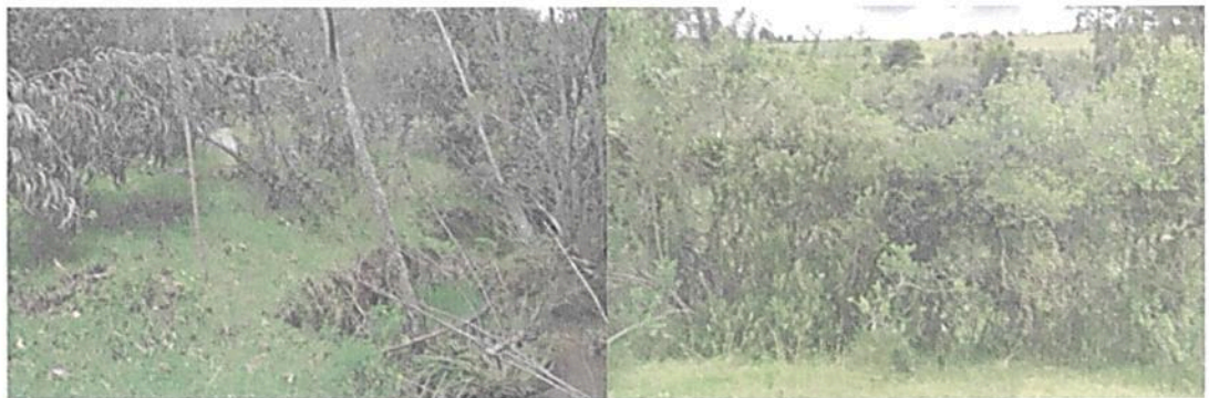
Figura 9. Zona de restauración presente en la RNSC "LA TIERRITA"

de restauración natural asistida y no asistida donde básicamente se ha dejado crecer la vegetación, la cual al cabo varios años ha logrado crecer, al punto de lograr reducir los espacios destinados para uso de agrosistemas, se espera que al cabo de varios años más esta zona se convierta en parte de la zona de conservación. Esta zona se encuentra presente en cada uno de los predios objeto de registro (Figura 9).