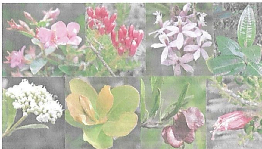
Figura 4. Flora observada en la RNSC "LA TIERRITA".