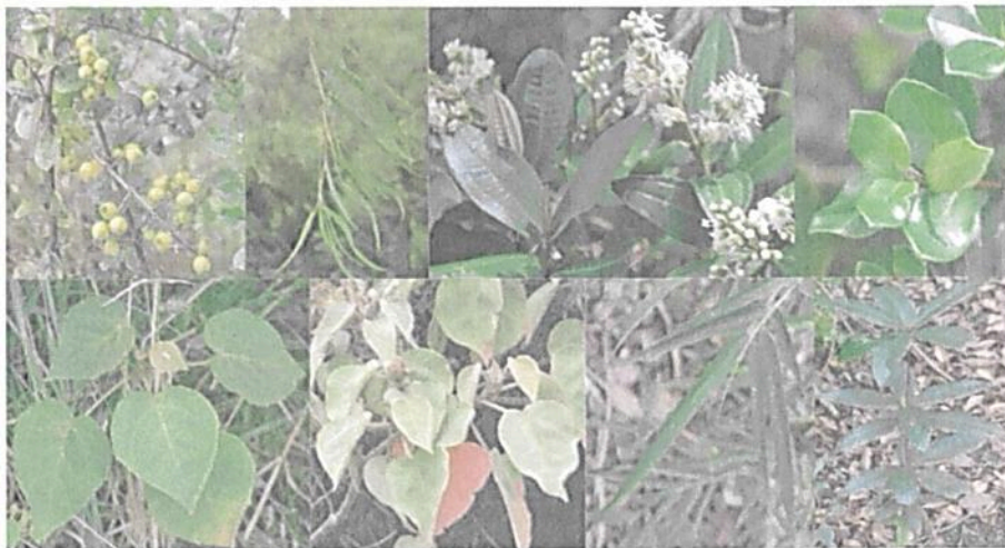
Figura 3. Flora observada en la RNSC "LA TIERRITA".

En la reserva, el bosque húmedo montano bajo se caracteriza por la presencia de bosques densos a abiertos con alturas que varían entre los 5 metros hasta los 14 metros de altura o más, siendo las especies arbóreas más altas que se pueden llegar a encontrar como chicalá ( Tecoma stans ), Roble ( Quercus sp. ), Aliso ( Alnus acuminata ), Sauce llorón ( Salix sp. ), sin embargo, también se encontraron especies como el tuno esmeraldo ( Miconia sp. ), siete cueros, hayuelo ( Dodonea viscosa ), gaque ( Clusia multiflora ), mano de oso ( Oreopanax sp. ), espino garbanzo ( Duranta mutisii ), ciro o chilca ( Baccharis sp. ), pegamosco ( Befaria resinosa ), uva camarona ( Macleania rupestris ), Jazmín del cabo ( Pittosporum undulatum ), sangregado ( Croton sp. ), duraznillo, cordoncillo ( Piper sp. ), chusque ( Chusquea scandens ), algunos líquenes de los géneros Usnea sp. , Parmotrema sp. , Graphis sp. , entre otros más, por último, se logró visualizar algunas orquídeas y bromelias, (Figura 3, 4 y 5).