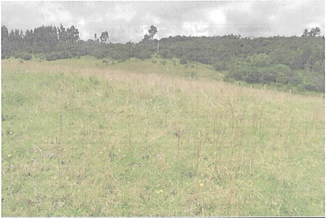
Figura 1. Predio: "Sin dirección. El Cuadro", inscrito bajo el folio de matrícula inmobiliaria No. 070-58221 en el cual no se evidenció presencia de muestra de ecosistema natural de acuerdo con lo relacionado en el artículo 2.2.2.1.17.1 del Decreto 1076 de 2015.

Teniendo en cuenta lo anterior y de acuerdo con la visita técnica efectuada a los cinco predios que conforman la solicitud de registro de la RNSC 103-22 "LA TIERRITA" se verificó que el predio: "Sin Dirección. El Cuadro", inscrito bajo el folio de matrícula inmobiliaria No. 070-58221 , no contiene muestra de ecosistema natural, dado que solo contienen coberturas vegetales de pastizales con unos arbustos y árboles de bajo porte (Figura 1).