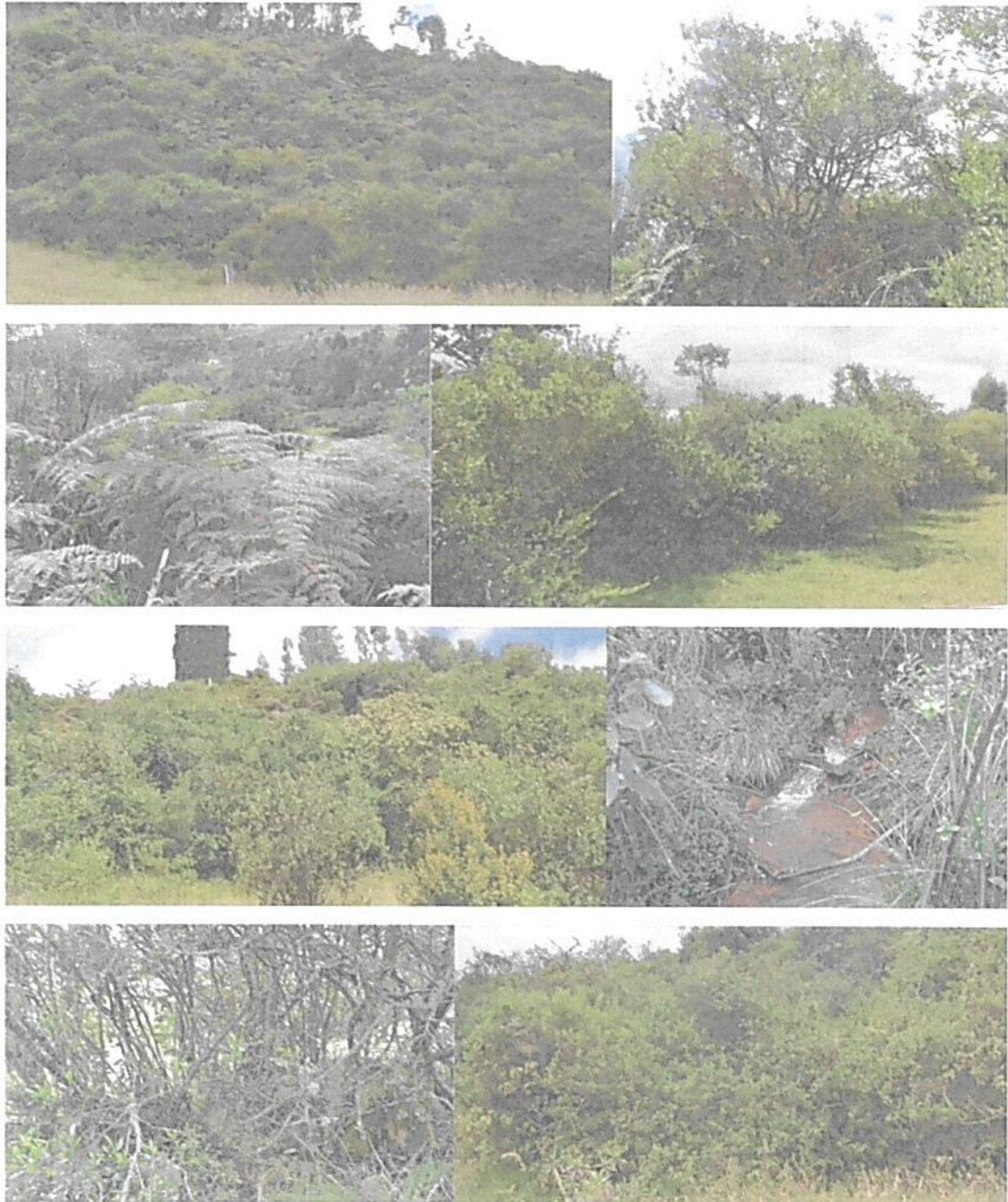
Figura 8. Zona de conservación presente en la RNSC "LA TIERRITA". De arriba hacia abajo zona de conservación de los predios denominados "Sin Dirección. El Terreno", inscrito bajo el folio de matrícula inmobiliaria No.070-33192, "Sin Dirección. El Potrero", inscrito bajo el folio de matrícula inmobiliaria No.070-58222, "Lote San Benito", inscrito bajo el folio de matrícula inmobiliaria No.070-174554 y "Lote El Potrero", inscrito bajo el folio de matrícula inmobiliaria No.070-116261 Fuente: visita técnica PNNC 07/12/2022.

POR MEDIO DE LA CUAL SE REGISTRA LA RESERVA NATURAL DE LA SOCIEDAD CIVIL "LA TIERRITA" RNSC 103-22