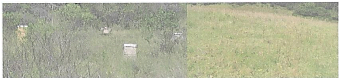
Figura 10. Zona de Agrosistemas presente en la RNSC "LA TIERRITA"

Esta zona corresponde al 42,00 % del total del área a registrar, presentando una extensión total de 2,0925 ha; sobre esta zona se encontraron varias colmenas de abejas, zonas de pastoreo es para unas vacas ganado vacuno presente a lo largo del predio (Figura 10).