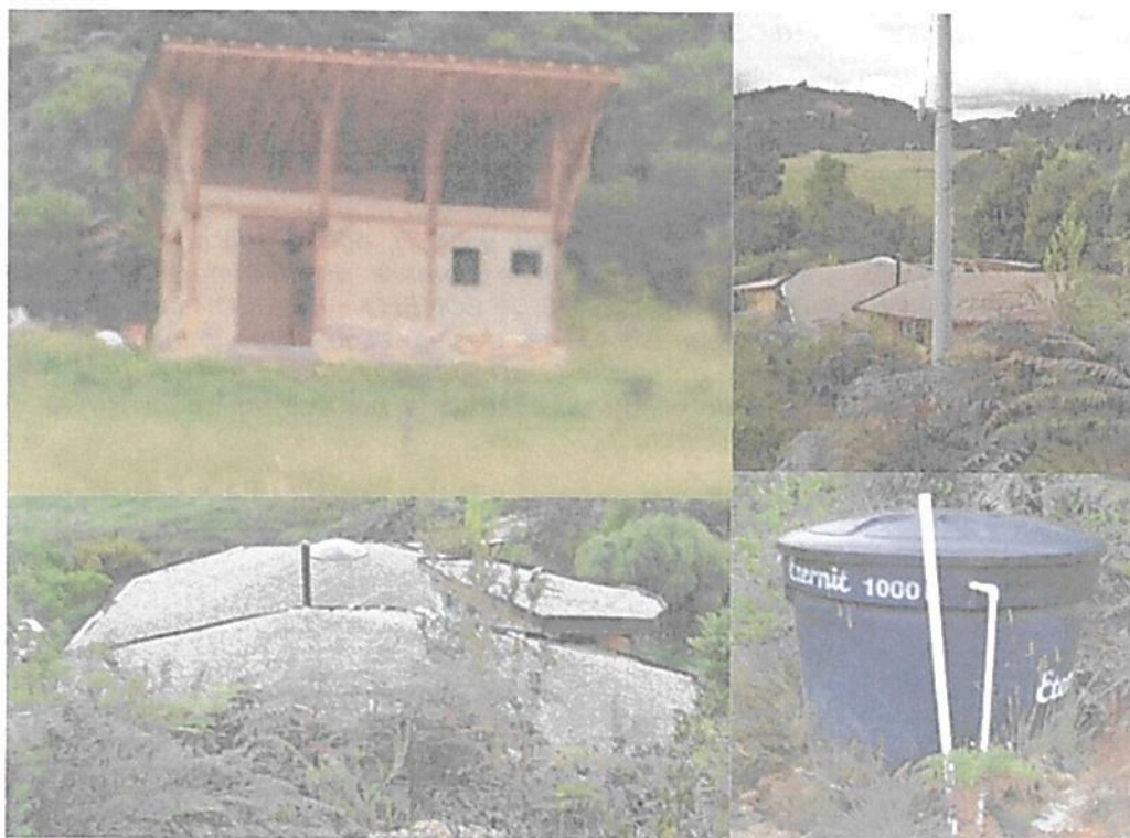
Figura 11. Zona de Uso Intensivo e Infraestructura presente en la RNSC "LA TIERRITA"

Esta zona corresponde al 5,28 % del total del área a registrar, presentando una extensión total de 0,2631 ha; sobre esta zona se encontraron varias casas, senderos, bebederos, y diferentes construcciones. Esta zona se encuentra presente en cada uno de los predios objeto de registro (Figura 11).