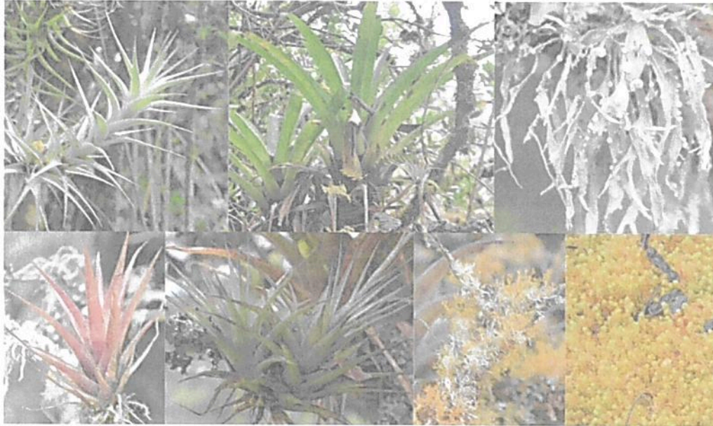
Figura 5. Flora epífita observada en la RNSC "LA TIERRITA".

POR MEDIO DE LA CUAL SE REGISTRA LA RESERVA NATURAL DE LA SOCIEDAD CIVIL "LA TIERRITA" RNSC 103-22