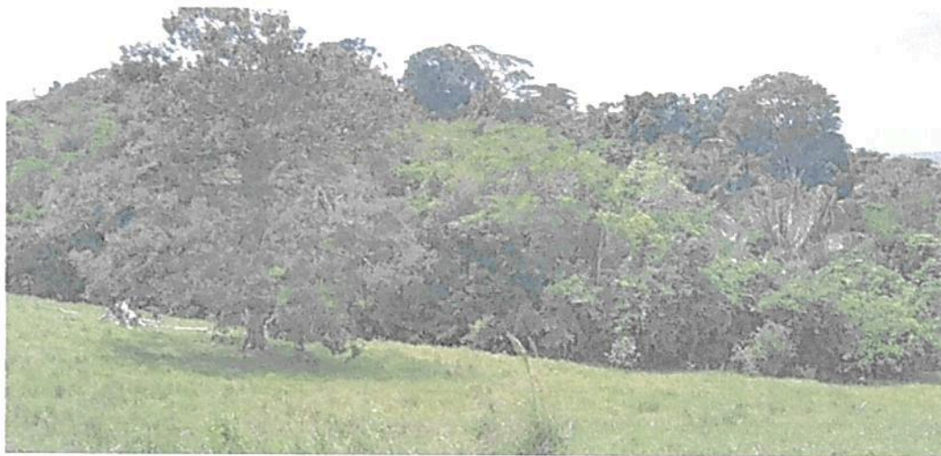
Figura 7. Vista de la Zona de Conservación de la RNSC "LAS DELICIAS".