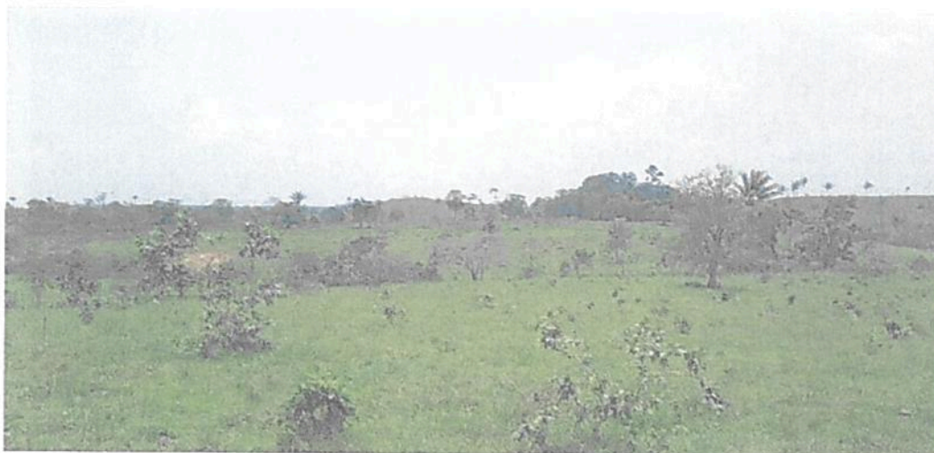
Figura 22. Zona de Agrosistemas de la RNSC "LAS DELICIAS".

POR MEDIO DE LA CUAL SE REGISTRA LA RESERVA NATURAL DE LA SOCIEDAD CIVIL "LAS DELICIAS" RNSC 217-22