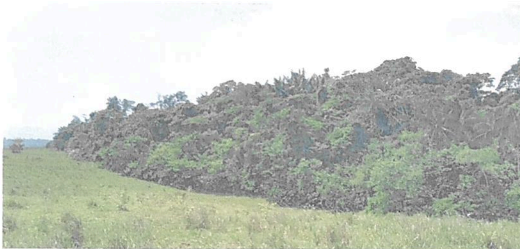
Figura 6. Vista de la Zona de Conservación de la RNSC "LAS DELICIAS".

POR MEDIO DE LA CUAL SE REGISTRA LA RESERVA NATURAL DE LA SOCIEDAD CIVIL "LAS DELICIAS" RNSC 217-22