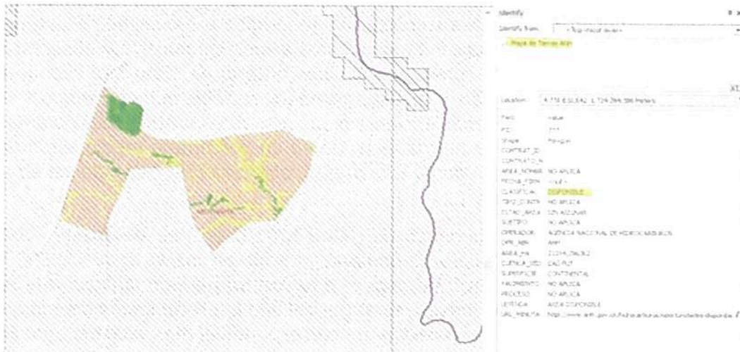
Figura 22. Traslape del predio denominado "SIN DIRECCIÓN LAS DELICIAS" con clasificación: disponible.