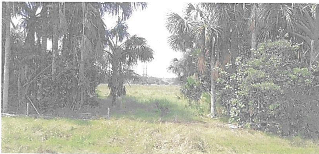
Figura 19. Vista de la Zona de Amortiguación y Manejo Especial de la RNSC "LAS DELICIAS".