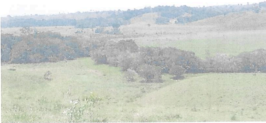
Figura 17. Vista de la Zona de Amortiguación y Manejo Especial en la RNSC "LAS DELICIAS".

POR MEDIO DE LA CUAL SE REGISTRA LA RESERVA NATURAL DE LA SOCIEDAD CIVIL "LAS DELICIAS" RNSC 217-22