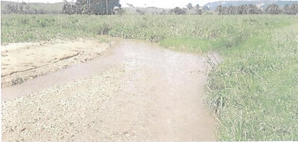
Figura 14. Cauce del caño Los Carbones con un ancho de alrededor de 3 m en la Zona de Restauración de la RNSC "LAS DELICIAS".

POR MEDIO DE LA CUAL SE REGISTRA LA RESERVA NATURAL DE LA SOCIEDAD CIVIL "LAS DELICIAS" RNSC 217-22