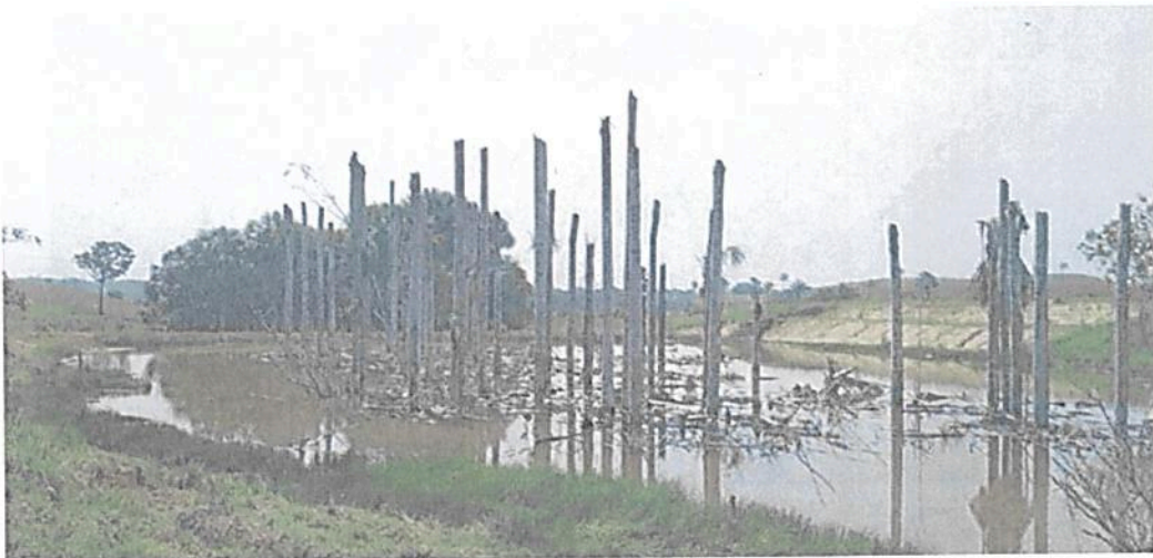
Figura 12. Cananguchal afectado por el deslizamiento de tierra en su margen nororiental en la Zona de Restauración de la RNSC "LAS DELICIAS".