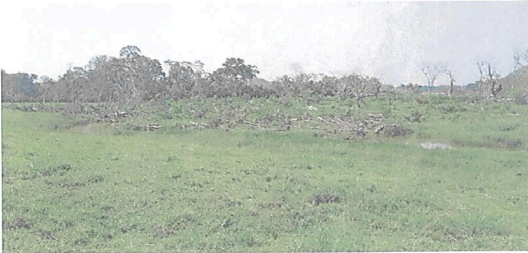
Figura 11. Cauce y vegetación caída producto de ventarrón en la Zona de Restauración de la RNSC "LAS DELICIAS".