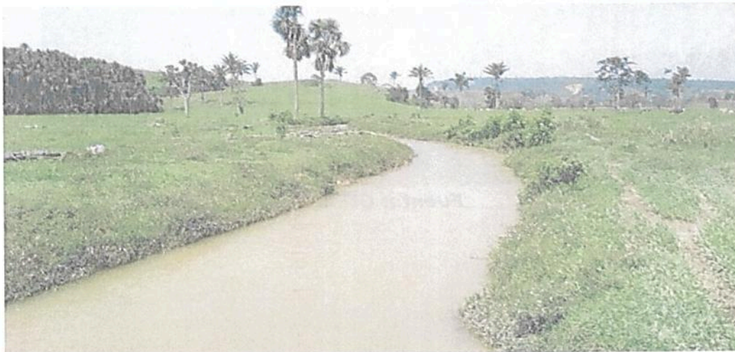
Figura 15. Cauce del caño grande con un ancho de alrededor de 10 m en la Zona de Restauración de la RNSC "LAS DELICIAS".