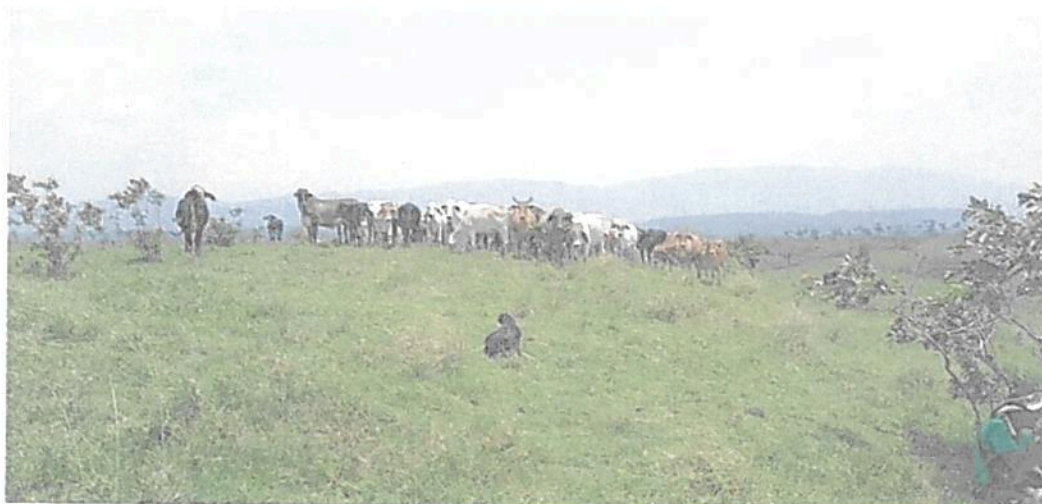
Figura 23. Zona de Agrosistemas de la RNSC "LAS DELICIAS".