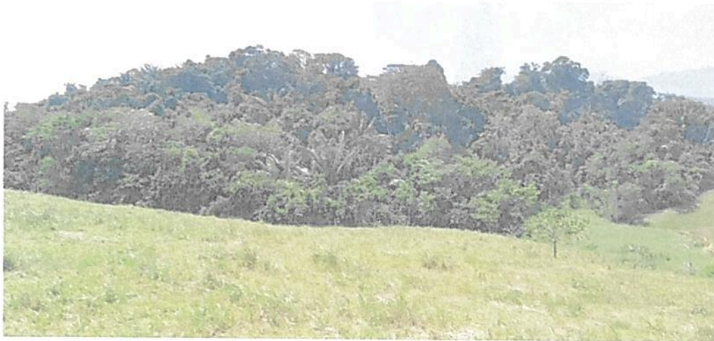
Figura 1. Muestra de ecosistema natural presente en la RNSC "LAS DELICIAS".

De acuerdo con la reseña la muestra de ecosistema natural del "(...) predio "SIN DIRECCIÓN LAS DELICIAS" se encuentra ubicado en el bioma húmedo tropical de la amazonia en el cual predominan dos ecosistemas: bosques naturales y pastos del zonobioma húmedo tropical de la amazonia, presenta un clima cálido muy húmedo, dentro de la unidad geomorfológica de lomerío fluvio-gravitacional. En la reserva predomina la cobertura de pastos limpios, vegetación secundaria o en transición y bosques fragmentados con vegetación secundaria." 2