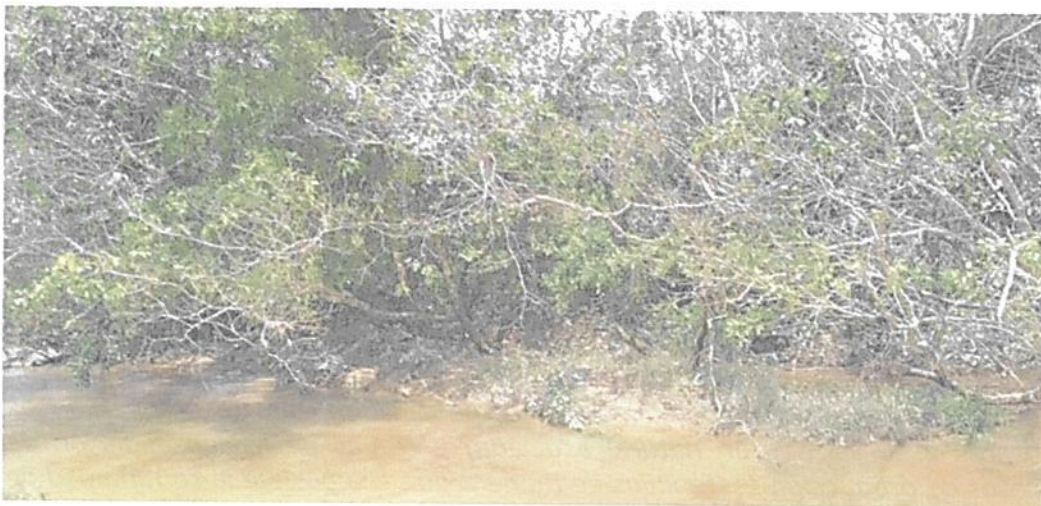
Figura 4. Flora registrada en la Zona de Conservación de la RNSC "LAS DELICIAS".