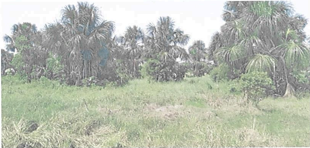
Figura 8. Parches de vegetación en la Zona de Conservación en la RNSC "LAS DELICIAS".