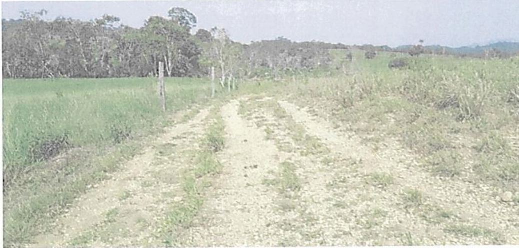
Figura 24. Zona de Uso Intensivo e Infraestructura de la RNSC "LAS DELICIAS".

POR MEDIO DE LA CUAL SE REGISTRA LA RESERVA NATURAL DE LA SOCIEDAD CIVIL "LAS DELICIAS" RNSC 217-22