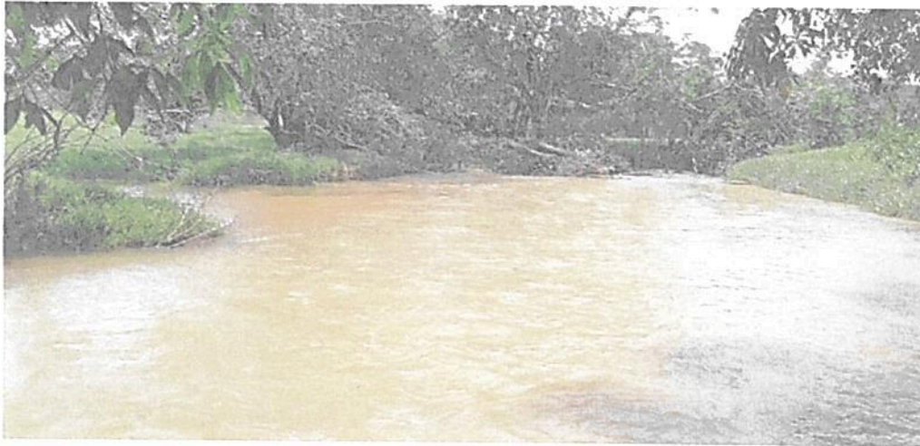
Figura 16. Cauce del caño grande con dos de sus afluentes y vegetación ribereña en la Zona de Restauración de la RNSC "LAS DELICIAS".