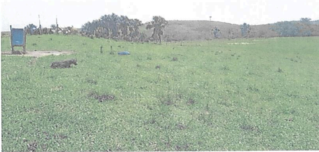
Figura 20. Zona de Agrosistemas de la RNSC "LAS DELICIAS".

POR MEDIO DE LA CUAL SE REGISTRA LA RESERVA NATURAL DE LA SOCIEDAD CIVIL "LAS DELICIAS" RNSC 217-22