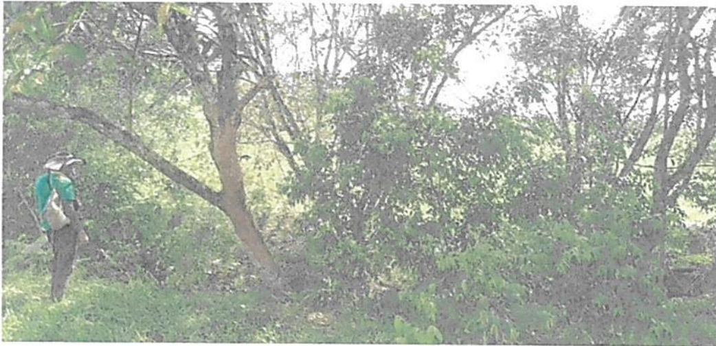
Figura 9. Vegetación que rodea al nacedero Los Carbones en la Zona de Restauración de la RNSC "LAS DELICIAS".

POR MEDIO DE LA CUAL SE REGISTRA LA RESERVA NATURAL DE LA SOCIEDAD CIVIL "LAS DELICIAS" RNSC 217-22