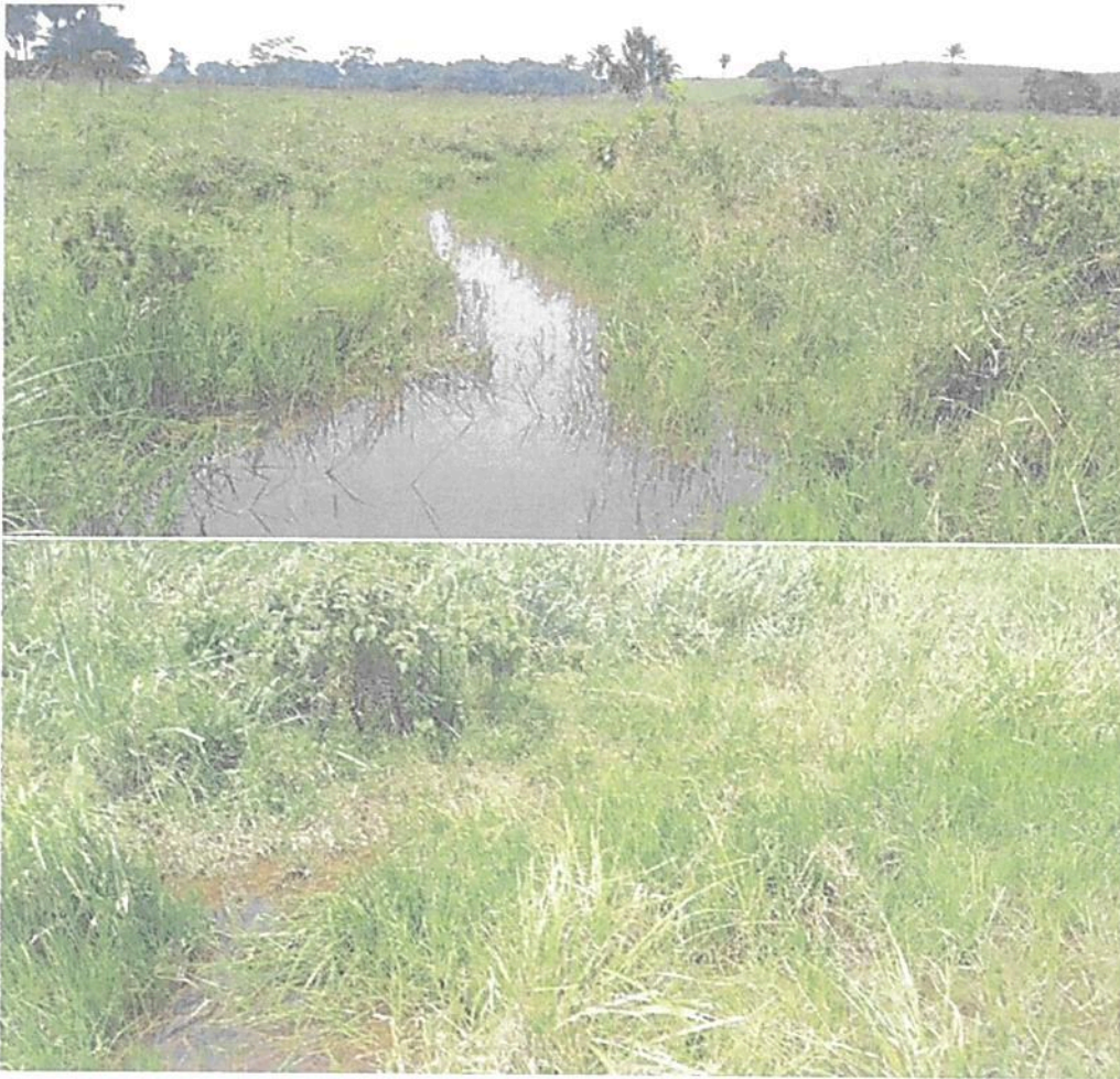
Figura 13. Vega del caño Los Carbones con vegetación acuática y con una profundidad de alrededor de 2 m en la Zona de Restauración de la RNSC "LAS DELICIAS".

POR MEDIO DE LA CUAL SE REGISTRA LA RESERVA NATURAL DE LA SOCIEDAD CIVIL "LAS DELICIAS" RNSC 217-22