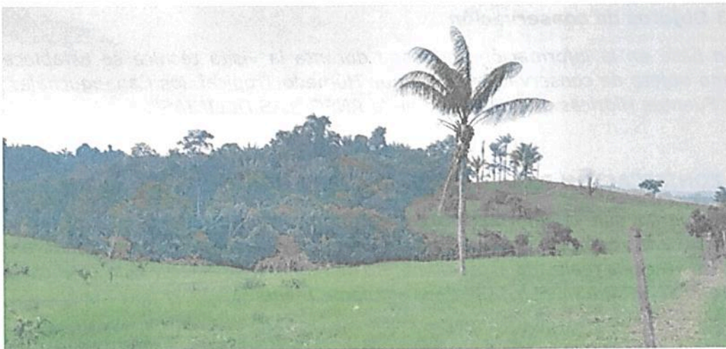
Figura 5. Vista de la Zona de Conservación de la RNSC "LAS DELICIAS".

Esta zona corresponde a 17,7890 ha, equivalentes al 8,5% del área objeto de registro. Se encuentra conformada por una muestra de ecosistema natural de Bosque Húmedo Tropical, Cananguchales y las Fuentes Hídricas asociadas; se encuentra "ubicada en zona de lomerío" 5 (Figuras 5 a 8). Esta cobertura natural se caracteriza por la presencia de relictos de bosque natural intervenido, con alturas promedio de 15 metros y con algunos individuos de aproximadamente 25 metros. "aunque existe la disponibilidad para la conservación de estos bosques, actualmente hay presiones por parte de vecinos de la que invaden el predio con el fin de extraer las pocas maderas finas que quedan en los relictos de bosque." "(...) el manejo [en esta área] está dirigido ante todo a evitar su alteración, degradación o transformación por la actividad humana." 6