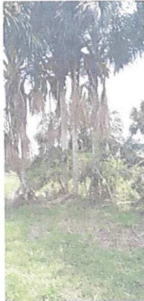
Figura 18. Vista de la Zona de Amortiguación y Manejo Especial de la RNSC "LAS DELICIAS".