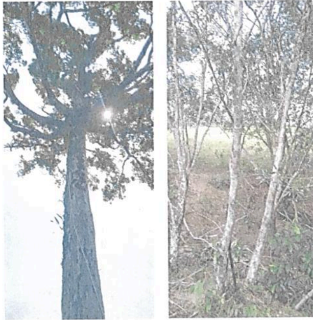
Figura 2. Flora registrada en la Zona de Conservación de la RNSC "LAS DELICIAS".

A continuación, se menciona la información aportada en la solicitud de registro sobre la flora presente en la RNSC "LAS DELICIAS" 3 "Según inventarios realizados en la zona es posible identificar (...) [50 géneros agrupados en 17 familias], se reportan 58 especies vegetales. Las familias que se destacan por el mayor número de especies son Poaceae, Araceae, Euphorbiaceae, Heliconiaceae y Myrtaceae". Algunas de las especies registradas durante la visita técnica se relacionan en las Figuras 2 a 4.