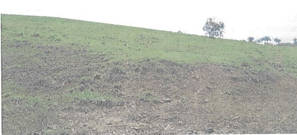
Figura 21. Zona de Agrosistemas de la RNSC "LAS DELICIAS".