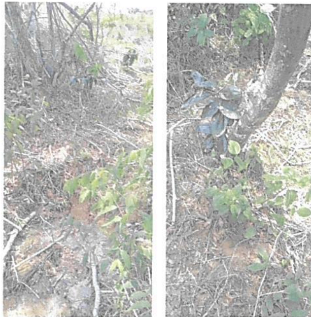
Figura 3. Flora registrada en la Zona de Conservación de la RNSC "LAS DELICIAS".

POR MEDIO DE LA CUAL SE REGISTRA LA RESERVA NATURAL DE LA SOCIEDAD CIVIL "LAS DELICIAS" RNSC 217-22