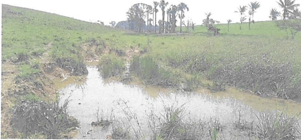
Figura 10. Cauce en la Zona de Restauración de la RNSC "LAS DELICIAS".