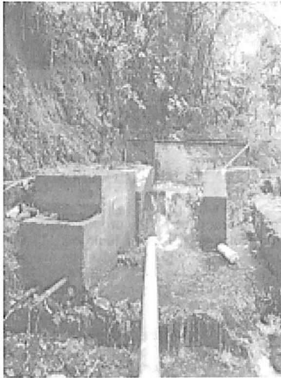
Bocatoma Quebrada Corozal

“POR MEDIO DE LA CUAL SE OTORGA UNA CONCESIÓN DE AGUAS SUPERFICIALES EN EL SANTUARIO DE FAUNA Y FLORA OTÚN QUIMBAYA Y SE TOMAN OTRAS DETERMINACIONES – EXPEDIENTE CASU-001-2023”