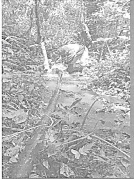
Tubería 4 pulgadas

medidas de 2.40 mts x 2.30 mts x 1.75 mts; cuya capacidad es de 9.66 m 3 . Desde este punto salen 3 redes, la primera con un diámetro de 1" ½ con un recorrido de 100 mts hasta llegar a la escuela; la segunda y tercera red que sale del tanque son de 2" pulgadas en tubería de PVC realizando un recorrido de 100 y 350 mts respectivamente hasta llegar a las viviendas donde se distribuye el agua por tubería de ½ pulgada.