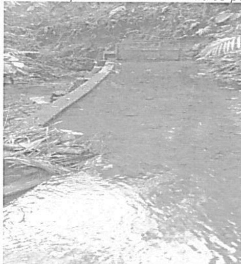
Punto de captación Quebrada Corozal

Se procedió a revisar información de históricos de caudales de la quebrada Corozal, obteniendo un caudal promedio de 56.44 litros por segundo.