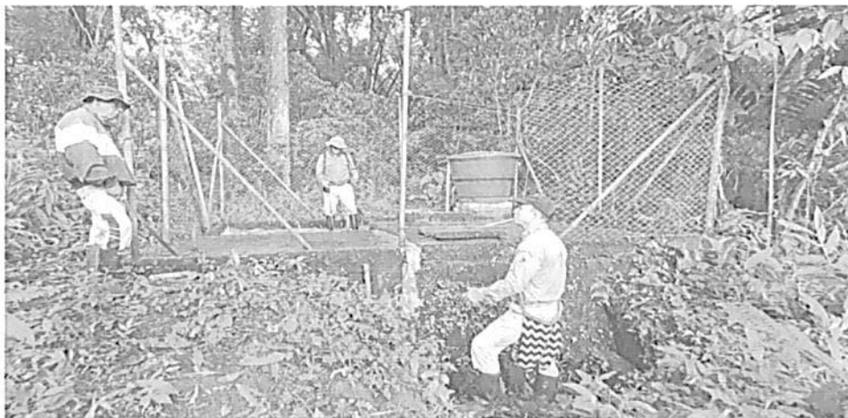
Sistema de almacenamiento y cloración

Propuesta de tratamiento: En la parte superior del tanque de almacenamiento se encuentra un tanque de polietileno de 500 litros que actúa como tanque de cloración y donde se realiza un proceso de desinfección mediante la adición de 1.500 gramos de hipoclorito de calcio granulado al 70 % diluido, con una frecuencia de cada 3 días; desde allí se lleva el cloro a través de dosificador que genera goteo permanente al tanque de almacenamiento. Manejo de vertimientos: La mayoría de las viviendas que se benefician del recurso hídrico que proporciona el acueducto de La Suiza tienen sistemas de tratamiento de aguas residuales domésticas prefabricados o en concreto que garantizan un adecuado manejo de los vertimientos, algunos usuarios del acueducto deberán construir sus propios sistemas sépticos, con el fin de garantizar lo anteriormente descrito.