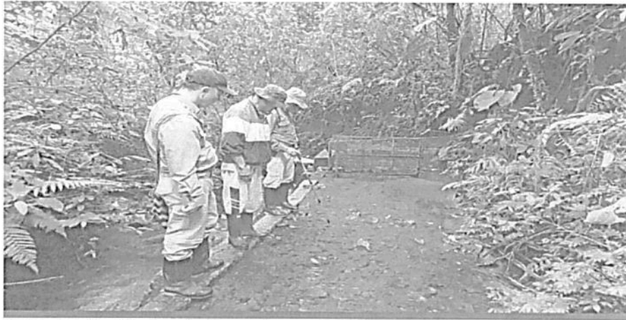
Desarenador Quebrada Corozal

El acueducto tiene una estructura pre-existente desde hace aproximadamente 50 años; cuenta con 14 suscriptores y alrededor de 42 usuarios; el acueducto se abastece a través de una fuente superficial, la Quebrada Corozal, al interior del Santuario de Fauna y Flora Otún Quimbaya, predio La Suiza, de propiedad de Parques Nacionales Naturales, en la cual se realizó una construcción de una bocatoma tipo dique transversal con rejilla de fondo y muros laterales en concreto, cuya agua aun así es captada mediante toma sumergida con tubería de PVC de 4" llevando el agua de forma directa al tanque de almacenamiento, dado que el tanque desarenador se encuentra deshabilitado se mencionan sus dimensiones 1.35 mts x 0.66 mts x 1 mt, una vez tomada el agua en la bocatoma se dirige por tubería de PVC de 4" pulgadas (30 mts), posteriormente reduce a manguera de 2"½ (170 mts) y finalmente termina llegando después de un recorrido de 1.600 mts en tubería de PVC de 2" a un tanque de almacenamiento, el cual está construido en concreto macizo y el cual tiene