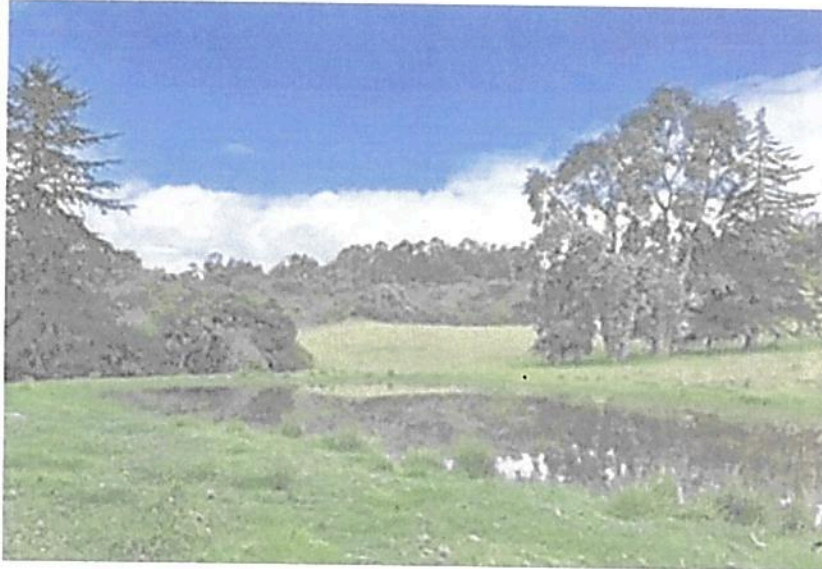
Figura 6. Zona de Amortiguación Cuerpo de agua de la RNSC "LA RAMADA"

Esta área cuenta con 0,0835 ha que corresponden al 0,26% del área total a registrar. Está conformada por dos cuerpos de agua que se encuentran ubicados en la parte central de la reserva, los cuales son considerados áreas especiales para la protección 14 y manejo especial por lo tanto se incluyen dentro de la zona de amortiguación.