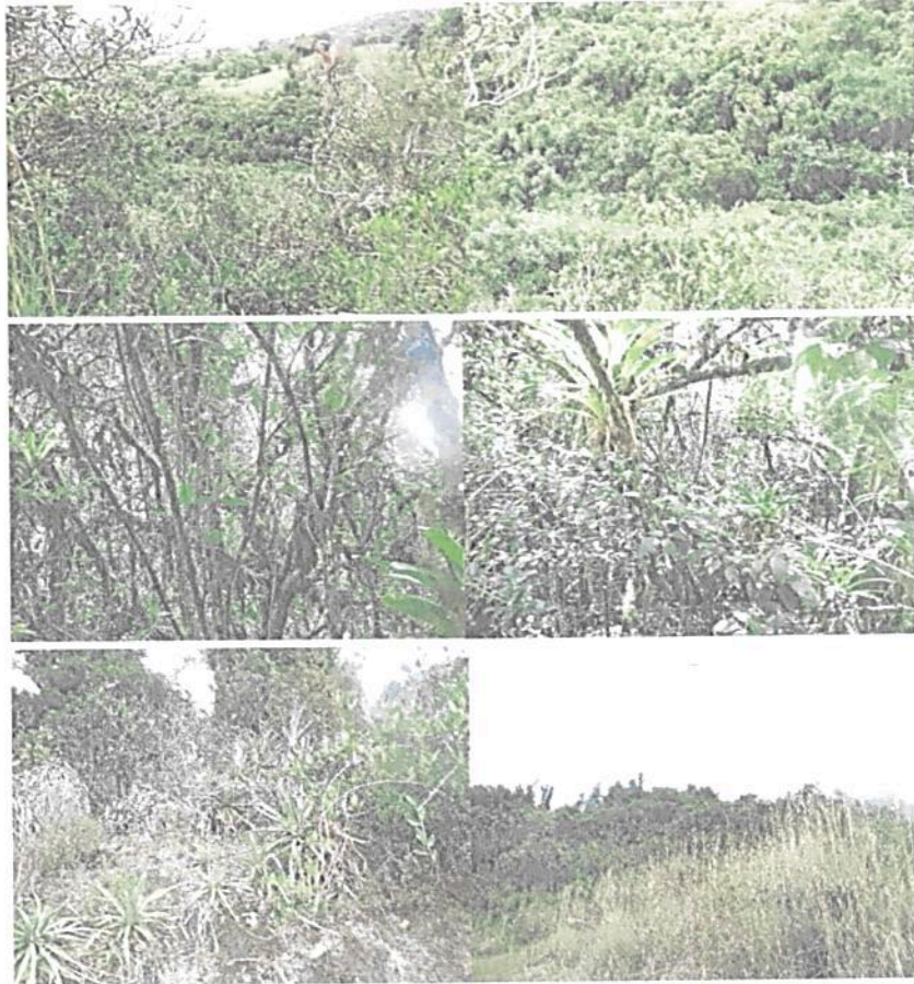
Figura 4. Zona de Conservación de la RNSC "LA RAMADA" Bosque Altoandino