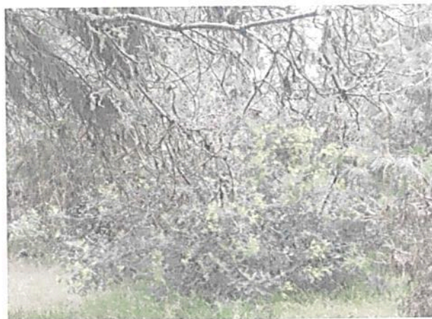
Figura 5. Zona de Amortiguación y Manejo Especial de la RNSC "LA RAMADA"

Esta área cuenta con 8,2817 ha que corresponden al 26,08% del área total a registrar. Está conformada por una franja de protección entre la zona de agrosistemas y la zona de conservación, o entre aquel y la zona de uso intensivo e infraestructura. Esta zona cuenta con especies vegetales no nativas como Acacia decurrens , Pinus patula y Pinus radiata . Esta área se encuentra destinada para realizar actividades de restauración ecológica.