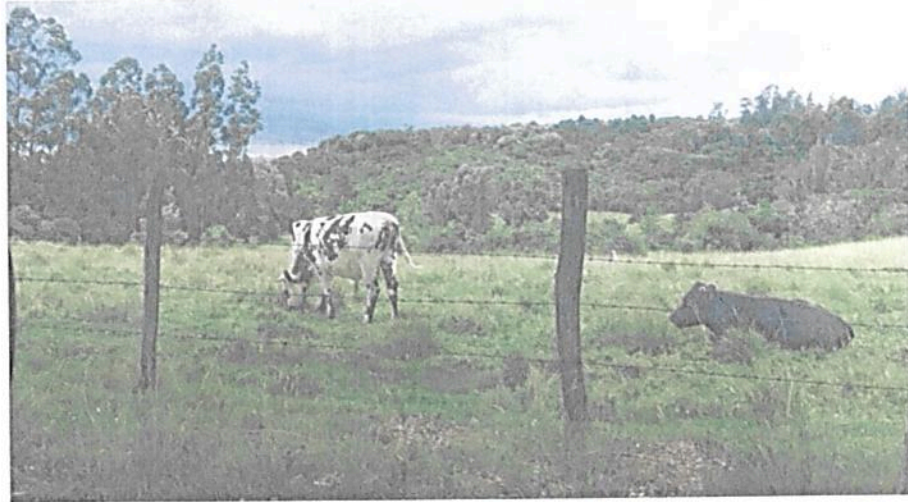
Figura 8. Zona de Agrosistemas de la RNSC "LA RAMADA"

Esta área cuenta con 12,7478 ha que corresponden al 40,14 % del área total a registrar. Está conformada por coberturas de pastos. En esta zona se lleva a cabo actividades ganaderas de baja intensidad mediante uso sostenible, con el fin de garantizar las condiciones bióticas del suelo. Así mismo se hace aprovechamiento maderero doméstico, utilizando solo especies exóticas e invasoras.