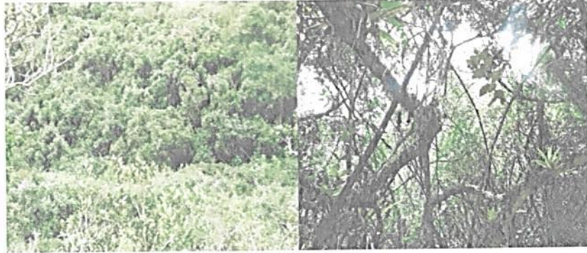
Figura 2. Muestra de ecosistema natural presente en el predio "Lote La Ramada"

El ecosistema se caracteriza por presentar un bosque secundario con coberturas de bosque abierto bajo, bosque de herbazal y bosque ripario, este último conformado por vegetación arbórea y arbustiva densa con abundancia de especies epifitas.