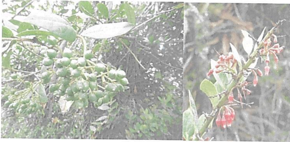
Figura 3. Flora presente en el predio "Lote La Ramada".