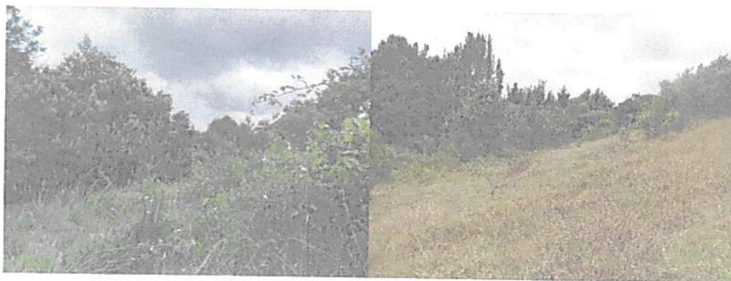
Figura 7. Zona de Restauración de la RNSC "LA RAMADA"

Esta área cuenta con 1,2570 ha que corresponden al 3,96% del área total a registrar. Está conformada por coberturas de pastos, algunos arbustos y especies no nativas las cuales se encuentran en un proceso de recuperación natural.