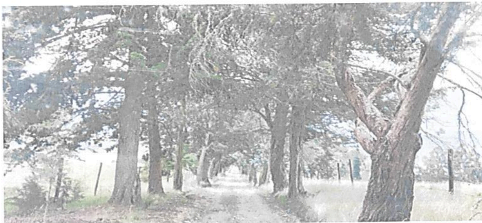
Figura 9. Zona de Uso Intensivo e Infraestructura de la RNSC "LA RAMADA"

Esta área cuenta con 1,5142 ha que corresponden al 4,77 % del área total a registrar. Está conformada por la vivienda principal, un camino rural que conecta la entrada del predio hacia la zona de habitación, y dos senderos que permiten transitar el interior del predio.