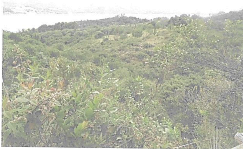
Figura 1. Muestra de ecosistema natural presente en el predio "Lote La Ramada"

El ecosistema natural de Bosque Altoandino presente en el predio "Lote La Ramada" a denominarse Reserva Natural de la Sociedad Civil "LA RAMADA" se encuentra dentro del Orobionoma Azonal Andino Altoandino de Colombia 6 . Esta zona se caracteriza por presentar bajas temperaturas, con un régimen de lluvias bimodal, presenta una altitud entre los 2681 y 2708 m.s.n.m. que lo ubica sobre la franja altoandina de la cordillera oriental.