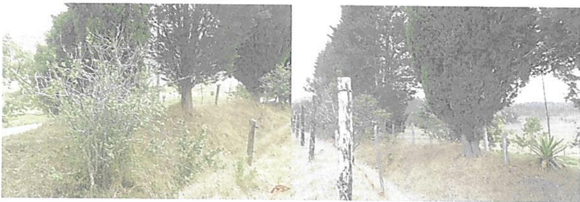
Figura 4. Presencia de pastos, y especies arbóreas dispersas de la zona de conservación propuesta por la propietaria del predio Lote Tibaque (LA PLANADA) registro tomado en la parte norte

El costado norte se encuentra rodeado principalmente por pastos y algunas especies arbóreas nativas que presentan una distribución dispersa, individuos con un DAP \geq 5 cm, y especies no nativas como pino ciprés. Otras especies se encuentran en estados juveniles. Las cerca delimita la zona, aislándola del área contigua donde se realizan actividades antrópicas.