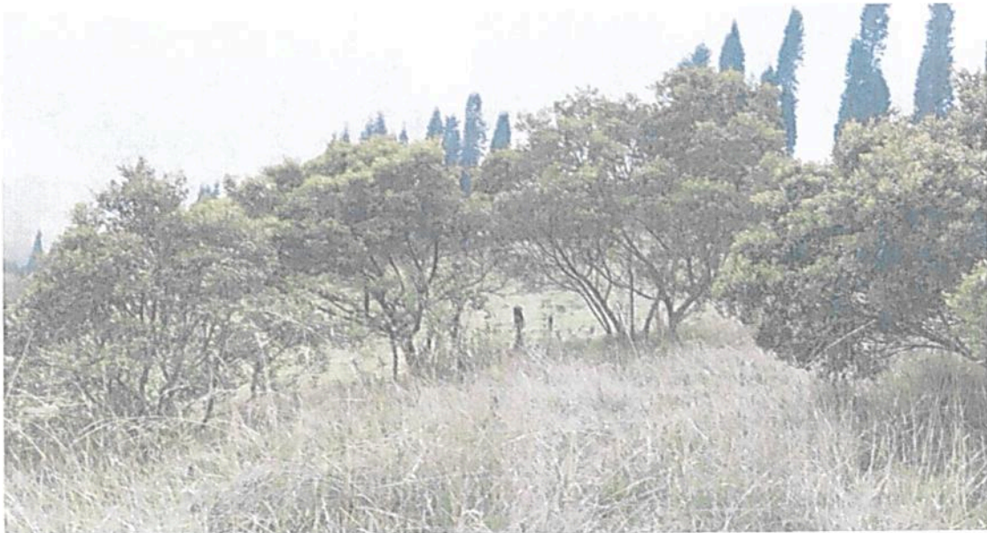
Figura 6. Presencia de pastizales y algunas especies de laureles en el predio Lote Tibaque (LA PLANADA) - costado occidental.

Las especies de laureles presentan una distribución dispersa, las plántulas se han originado mediante un proceso de restauración asistida, y/o siembra con algunos ejemplares obtenidos de viveros, según lo conversado con el encargado de realizar el acompañamiento del recorrido. Figura 7