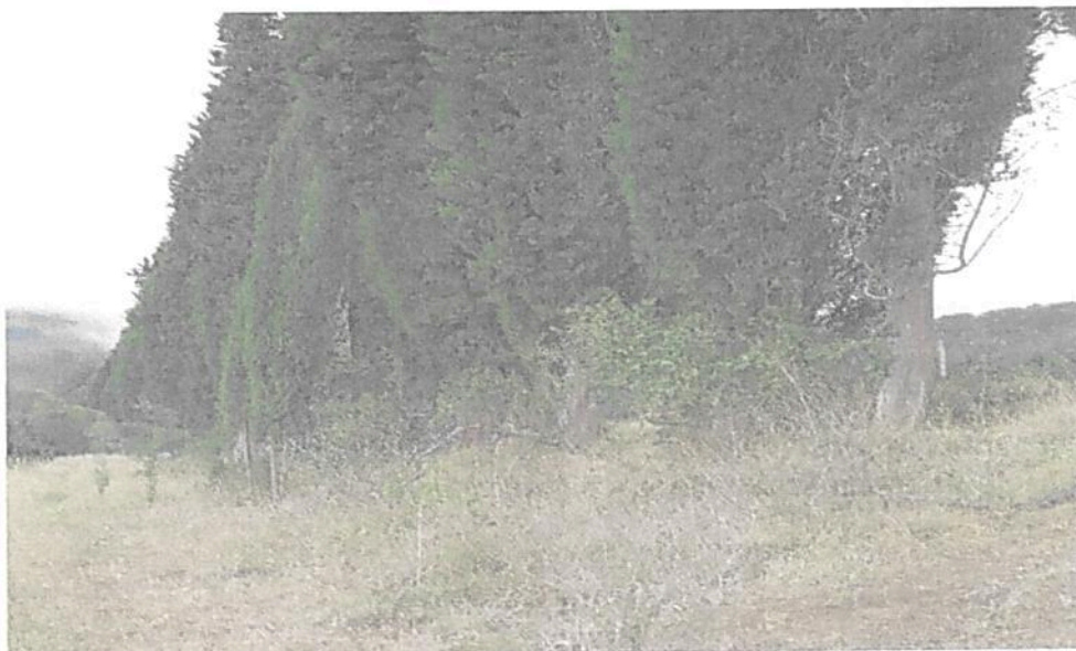
Figura 9. Presencia de pastizales y pinos observados en el predio Lote Tibaque (LA PLANADA)

En el costado sur del predio se aprecian algunos pajonales, pastos, pinos ciprés y algunas plantas nativas en estados juveniles. Figura 9