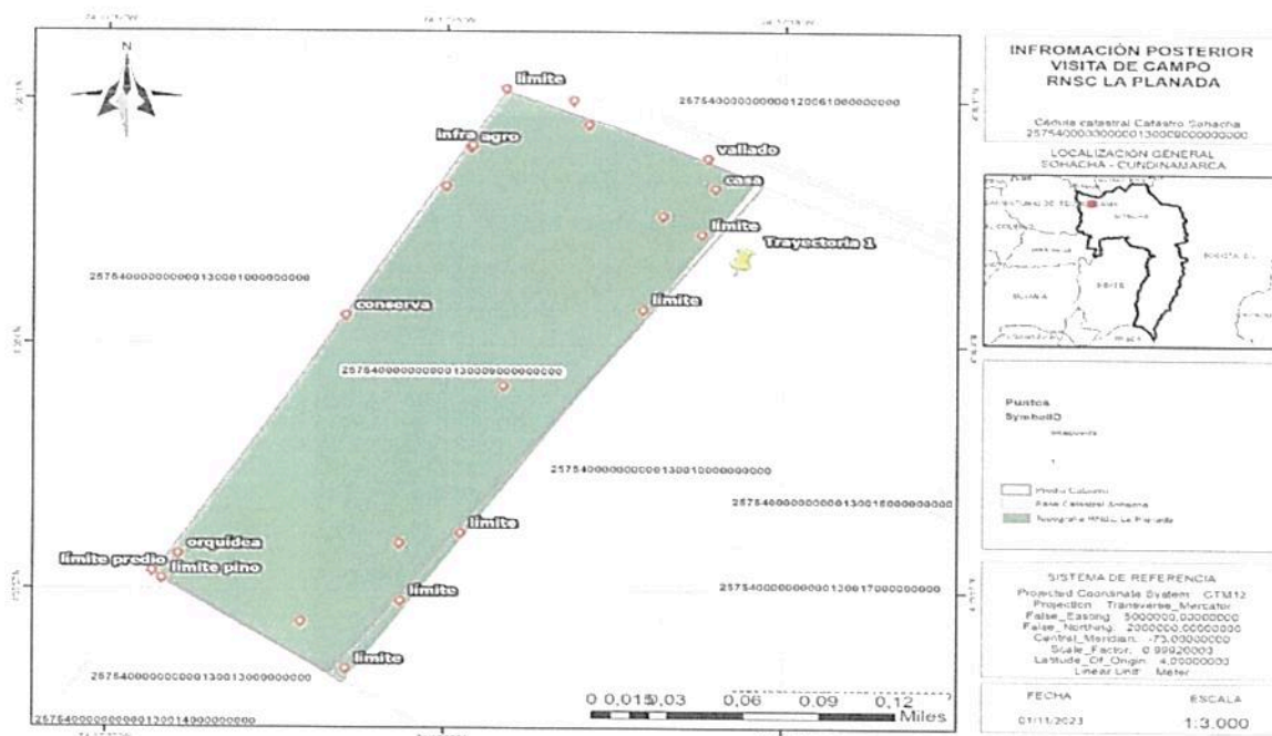
Figura 1. Área del polígono del predio "Lote Tibaque (LA PLANADA)" inscrito bajo FMI No 051-10423 según levantamiento topográfico, frente al recorrido realizado durante la visita técnica y puntos georreferenciados tomados en terreno

De acuerdo con la verificación de la información cartográfica, realizada por el Grupo de Trámites y Evaluación Ambiental GTEA, se evidencio que la información es coincidente frente a los límites verificados en terreno. (Figura 1)