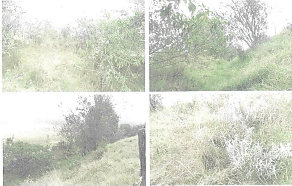
Figura 5. Presencia de pastos y especies arbóreas dispersas asociados a una quebrada en el Lote Tibaque (LA PLANADA) registro tomado en la parte norte

En el costado occidental del predio, se observan pajonales mezclados con pastos. En cuanto a especies arbóreas se observa principalmente laureles y algunos alisos. Figura 6