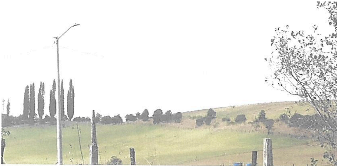
Figura 3. Panorámica predio Lote Tibaque (LA PLANADA), con presencia de pastos, pajonales y algunas especies arbóreas dispersas Fuente: Visita técnica realizada el 25 de octubre de 2023 – PNNC

De acuerdo con el recorrido realizado y lo observado durante la visita técnica, el área objeto de verificación está conformada por vegetación herbácea principalmente por pastizales, pajonales, algunas plantas nativas como laureles, alisos y especies no nativas de pinos.