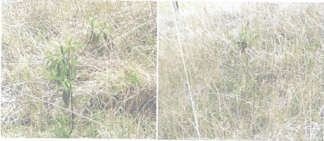
Figura 7. Restauración asistida con plántulas nativas, registro tomado en la parte occidental del predio

"POR MEDIO DE LA CUAL SE RECHAZA EL RECURSO DE REPOSICIÓN INTERPUESTO CONTRA LA RESOLUCIÓN DE NEGACIÓN No. 197 DEL 08 DE SEPTIEMBRE DE 2023 Y SE TOMAN OTRAS DETERMINACIONES RNSC 025-23 LA PLANADA"