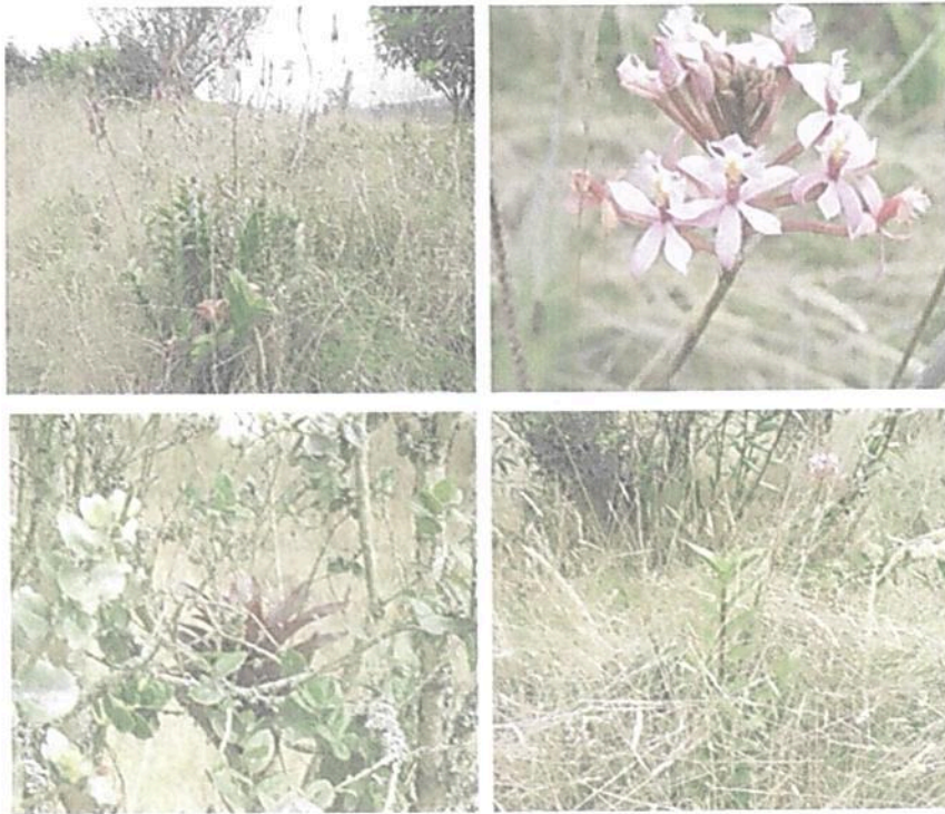
Figura 8. Presencia de especies nativas en el predio Lote Tibaque (LA PLANADA)

"POR MEDIO DE LA CUAL SE RECHAZA EL RECURSO DE REPOSICIÓN INTERPUESTO CONTRA LA RESOLUCIÓN DE NEGACIÓN No. 197 DEL 08 DE SEPTIEMBRE DE 2023 Y SE TOMAN OTRAS DETERMINACIONES RNSC 025-23 LA PLANADA"