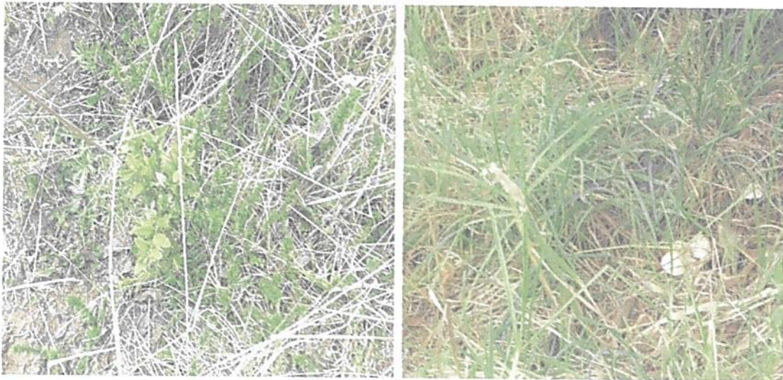
Figura 7. Vegetación rasante dominada por pastos

El suelo está cubierto principalmente por vegetación herbácea con predominio de pastos y pajonales. Figura 7