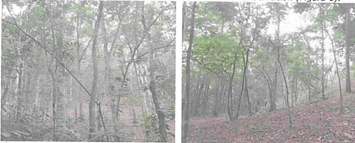
Figura 6. Zona de Amortiguación y Manejo Especial de la RNSC 140-22 "RESERVA BUENAVISTA".

Esta zona representa el 1,3936% del área bajo registro, con una extensión de 0,2058 ha. La zona de amortiguación corresponde a una franja de 10 metros entre la zona de conservación y la zona de agrosistemas, establecida con el fin de reducir el posible impacto de las actividades productivas sobre la zona de conservación (Figura 6).