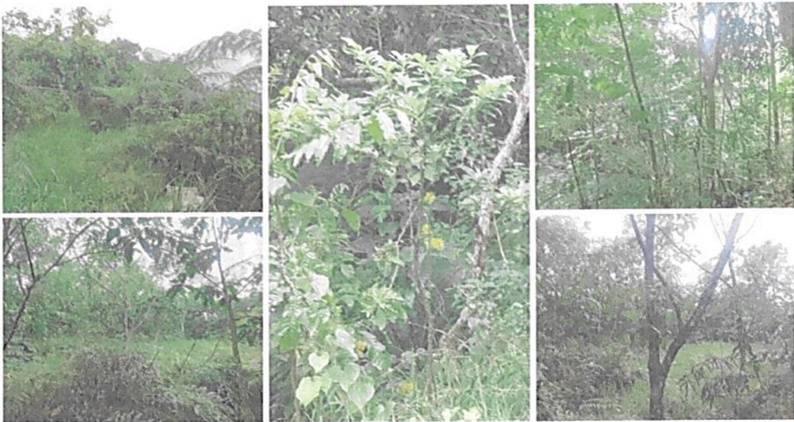
Figura 7. Zona de Restauración de la RNSC 140-22 "RESERVA BUENAVISTA".

Esta zona presenta una extensión de 2,6273 ha, las cuales corresponden al 17,7915% del total del área bajo registro (Figura 7). Esta zona está conformada por una sección de bosque en proceso de regeneración natural. Este proceso ha sido facilitado a partir de la siembra de árboles nativos como Abarco ( Cariniana pyriformis ), Canangucha ( Mauritia flexulosa ) y Caucho ( Hevea brasiliensis ), labor que se viene desarrollando desde el año 2007. A futuro se espera que esta área pueda ser incluida dentro de la zona de conservación, una vez el bosque en regeneración alcance niveles de composición, estructura y función propios del Bosque Húmedo Tropical.