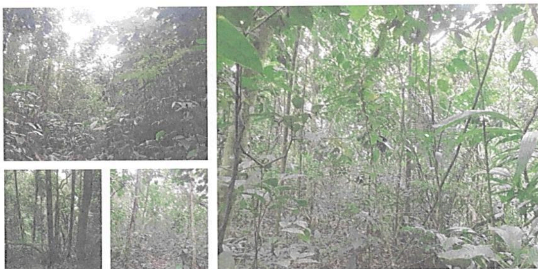
Figura 3. Flora y estructura del bosque en regeneración presente en la RNSC 140-22 RESERVA BUENAVISTA. Fuente: Visita Técnica realizada por Grupo de Trámites y Evaluación Ambiental – GTEA el 28/03/2022.

Según inventarios realizados en sectores de piedemonte amazónico, es posible identificar 304 especies de plantas, distribuidas en 167 géneros y 65 familias. De las especies registradas 20 se encuentran clasificadas dentro de alguna categoría de amenaza. De estas, Swartzia oraria se encuentra clasificada en Peligro Crítico (CR). Por otra parte, tres especies están clasificadas en peligro (EN): Magnolia cf. henaoi , Matisia cf. dolichopoda , Virola surinamensis ; seis especies se encuentran en categoría vulnerable (VU) Crematosperma cf. megalophyllum , Cybianthus cogolloi , Elaeagia pastoensis , Guarea cf. velutina , Naucleopsis cf. Oblongifolia y Pouteria cf. Krukovii 1 .