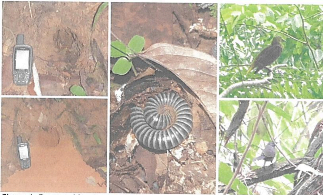
Figura 1. Fauna evidenciada en la RNSC 140-22 BUENAVISTA. Fuente Visita Técnica realizada por Grupo de Trámites y Evaluación Ambiental – GTEA el 28/03/2022.

Durante la visita técnica fue posible evidenciar la presencia de aves como Orpendulas, Semilleros, Sirirí, Torcazas y Atrapamoscas. Igualmente, a través de rastros se identificó la presencia de armadillos y borugas (Figura 1). Para el caso de las serpientes se observó un individuo de coral rabo de ají (Micrurus sp). Por otra parte, los propietarios mencionaron la presencia de monos titicos (Saimiri sp.), zorros (Cerdocyon thous) y tigrillos (Leopardus sp.).