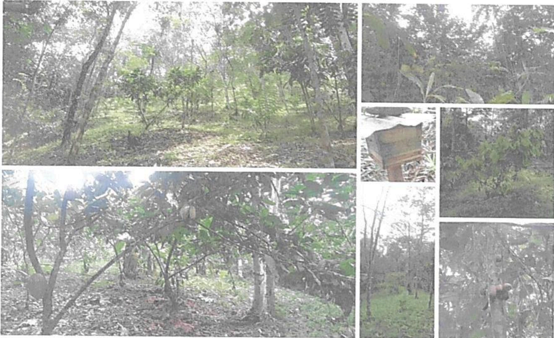
Figura 8. Zona de Agrosistemas de la RNSC 140-22 "RESERVA BUENAVISTA".