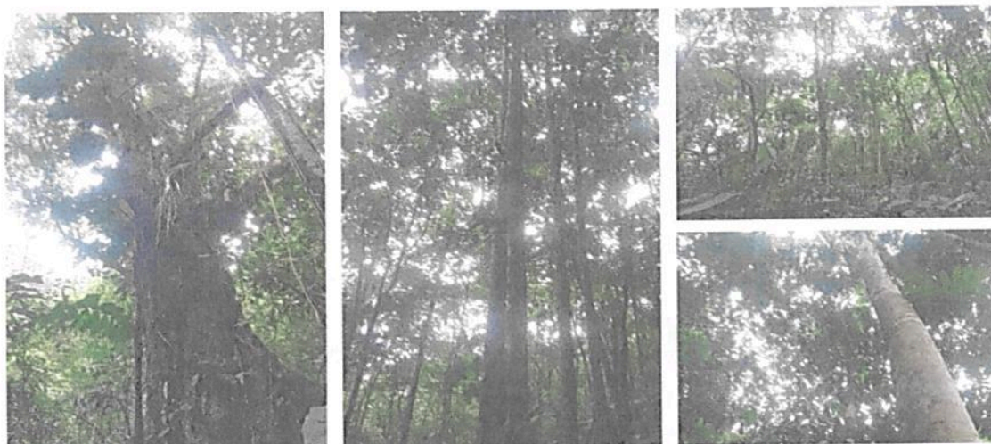
Figura 2. Flora y estructura del bosque secundario maduro presente en la RNSC 140-22 RESERVA BUENAVISTA.

Según inventarios realizados en sectores de piedemonte amazónico, es posible identificar 304 especies de plantas, distribuidas en 167 géneros y 65 familias. De las especies registradas 20 se encuentran clasificadas dentro de alguna categoría de amenaza. De estas, Swartzia oraria se encuentra clasificada en Peligro Crítico (CR). Por otra parte, tres especies están clasificadas en peligro (EN): Magnolia cf. henaoi , Matisia cf. dolichopoda , Virola surinamensis ; seis especies se encuentran en categoría vulnerable (VU) Crematosperma cf. megalophyllum , Cybianthus cogolloi , Elaeagia pastoensis , Guarea cf. velutina , Naucleopsis cf. Oblongifolia y Pouteria cf. Krukovii 1 .