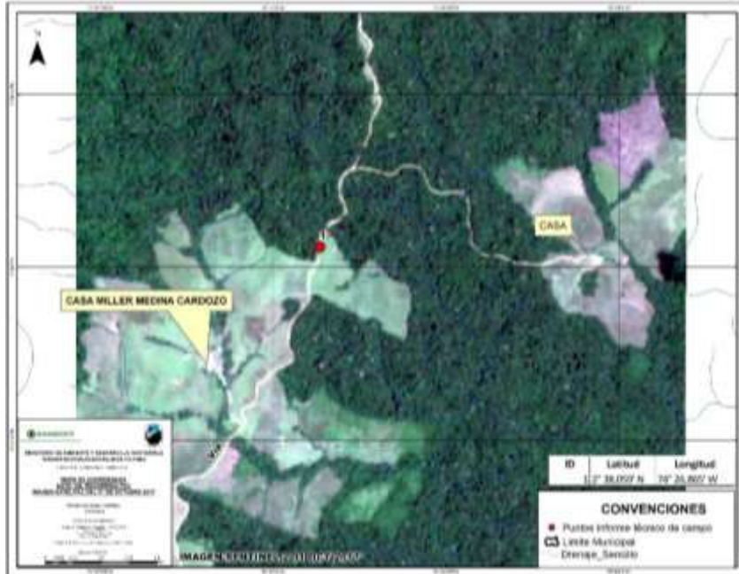
Figura 3. Zona donde se presentó la afectación ambiental el 01 de octubre 2017. Fuente: Concepto Técnico No. 20217030000016. PNNC, 2023

A continuación, se presenta el análisis multitemporal del Concepto Técnico No. 20217030000016, donde se identificó la pérdida de cobertura de bosque producto de la tala rasa entre el 01 de octubre de 2017 y 25 de diciembre de 2017, en la localización señalada en el informe técnico inicial.