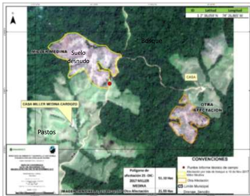
Figura 4. Zona donde se presentó la afectación ambiental el 25 de Diciembre 2017. Fuente: Concepto Técnico No. 20217030000016. PNNC, 2023