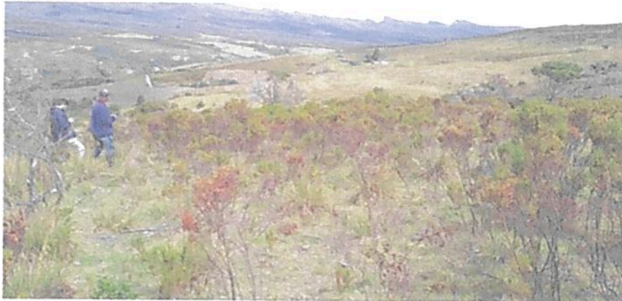
Figura 4. Vista de la Zona de Restauración en la RNSC "EL HATO".

"Es un espacio dirigido al restablecimiento parcial o total a un estado anterior, de la composición, estructura y función de la diversidad biológica. En las zonas de restauración se pueden llevar a cabo procesos inducidos por acciones humanas, encaminados al cumplimiento de los objetivos de conservación del área protegida. Un área protegida puede tener una o más zonas de restauración, las cuales son transitorias hasta que se alcance el estado de conservación deseado y conforme los objetivos de conservación del área, caso en el cual se denominará de acuerdo con la zona que corresponda a la nueva situación. Será el administrador del área protegida quien definirá y pondrá en marcha las acciones necesarias para el mantenimiento de la zona restaurada." 7