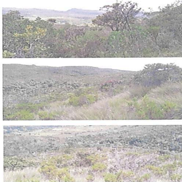
Figura 3. Vista de la Zona de Conservación en la RNSC "EL HATO".

La Zona de Conservación es el "área ocupada por un paisaje o una comunidad natural, animal o vegetal, ya sea en estado primario o que está evolucionando naturalmente y que se encuentra en proceso de recuperación." 5 "Es un espacio donde el manejo está dirigido ante todo a evitar su alteración, degradación o transformación por la actividad humana. (...) se mantienen como intangibles para el logro de los objetivos de conservación. (...)" 6