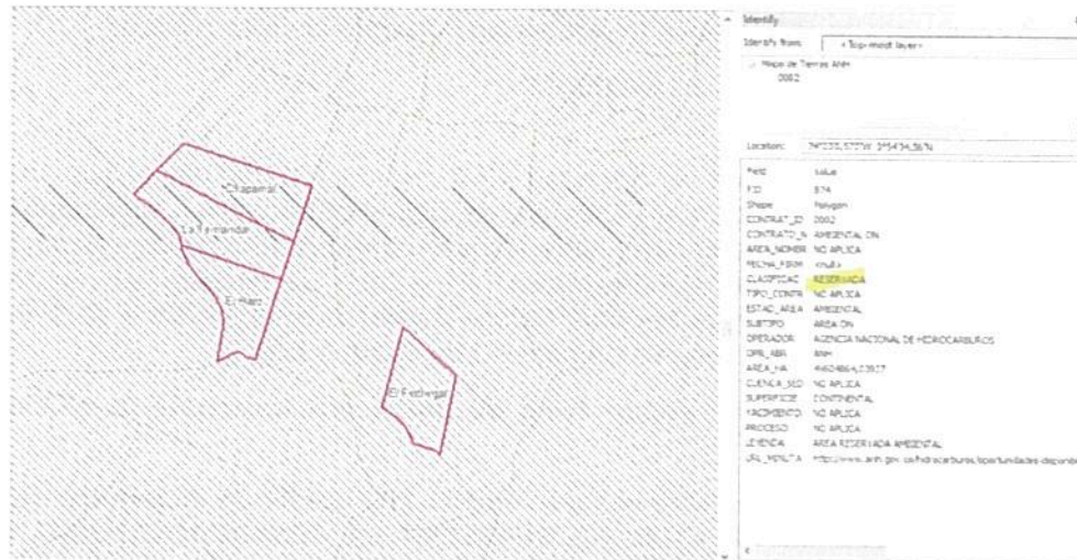
Figura 1. Traslape de la RNSC "EL HATO" con capa de la Agencia Nacional de Hidrocarburos (Mapa de Tierras ANH – 2022), clasificación reservada.

POR MEDIO DE LA CUAL SE MODIFICA LA RESOLUCIÓN No.293 DEL 24 DE DICIEMBRE DE 2007 POR MEDIO DE LA CUAL SE REGISTRA LA RESERVA NATURAL DE LA SOCIEDAD CIVIL "EL HATO" Y SE TOMAN OTRAS DISPOSICIONES