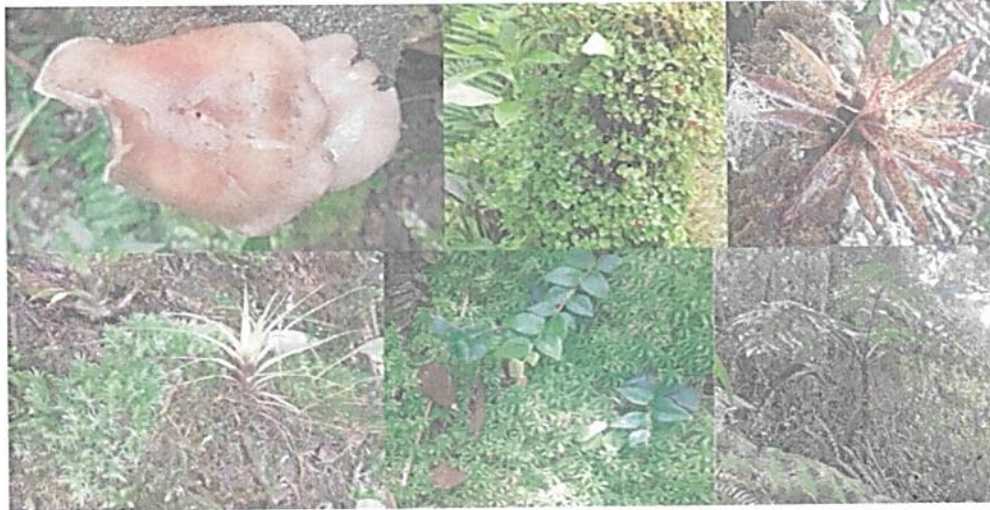
Figura 2. Flora observada en la RNSC "BUENA VISTA".