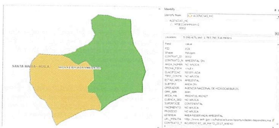
Figura 8. Traslape del predio FMI 200-118914 con área reservada ambiental según lo consultado con la capa de la Agencia Nacional de Hidrocarburos (Mapa de tierras ANH - 2023).

El Grupo de Trámites y Evaluación Ambiental - GTEA informó que la Reserva Natural de la Sociedad Civil RNSC "BUENA VISTA" presenta traslape con Área Reservada Ambiental según lo consultado con la capa de la Agencia Nacional de Hidrocarburos (Mapa de tierras ANH - 2023). (Figura 8).