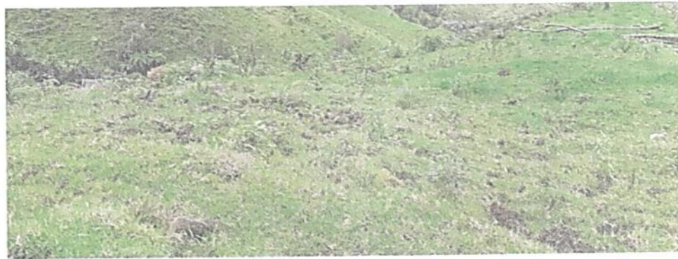
Figura 7. Zona de Agrosistemas presente en la RNSC "BUENA VISTA"

Esta zona corresponde al 37,82 % del total del área a registrar, presentando una extensión total de 11,6635 ha; sobre esta zona se encontraron zonas de pastoreo divididas en potreros. (Figura 7).