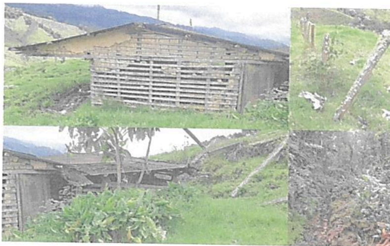
Figura 6. Zona de Uso Intensivo e Infraestructura presente en la RNSC "BUENA VISTA"

Esta zona corresponde al 0,63 % del total del área a registrar, presentando una extensión total de 0,1948 ha; sobre esta zona se encontró una casa, senderos y diferentes construcciones. (Figura 6).