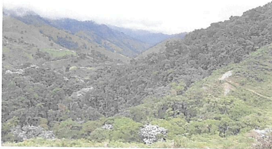
Figura 1. Muestra de ecosistema natural presente en la RNSC "BUENA VISTA".