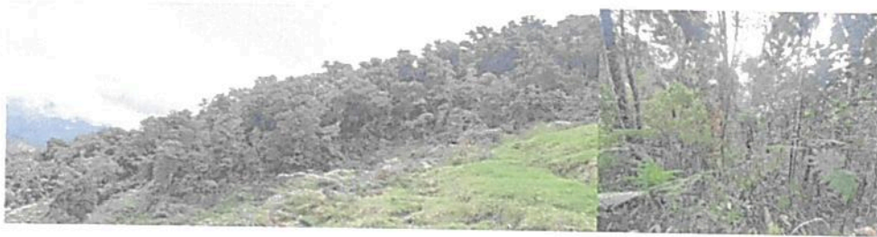
Figura 5. Zona de conservación presente en la RNSC "BUENA VISTA".

del aire, regulación climática, formación del suelo, control de la erosión, entre muchos más; por otra parte, este predio es un corredor biológico de gran importancia para las especies de fauna presentes en la región ya sean residentes permanentes o de paso como las migratorias. Es importante, que sobre esta zona no se realicen actividades que afecten o perturben la flora y fauna, de esta forma se estará garantizando el estado de conservación en que se encuentra el ecosistema natural (Figura 5).