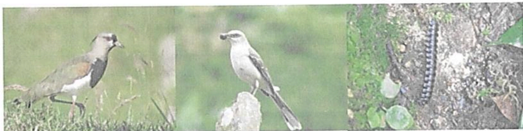
Figura 3. Fauna observada en la RNSC "BUENA VISTA".

Durante el recorrido realizado se logró visualizar especies de reptiles como lagartijas, una amplia variedad de aves propias del bosque alto andino ( Psarocolius angustifrons , Vanellus chilensis , Zonotrichia capensis , Mimus gilvus , etc). Respecto a los artrópodos se evidenció un amplia variedad de órdenes lepidoptera (mariposas, polillas), himenópteros (hormigas, avispas, abejas, abejorros), odonatos (libélulas, caballitos del diablo), araneae (arañas) entre otros. (Figura 3).