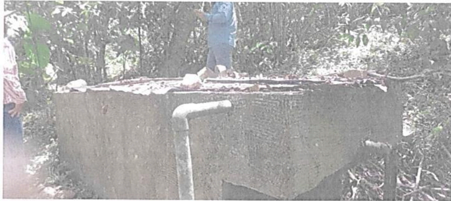
Tanque de almacenamiento y repartición.

“POR MEDIO DE LA CUAL SE OTORGA UNA CONCESIÓN DE AGUAS SUPERFICIALES EN EL ÁREA NATURAL ÚNICA LOS ESTORAQUES Y SE TOMAN OTRAS DETERMINACIONES – EXPEDIENTE CASU-003-2022”