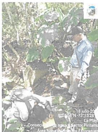
Punto de captación Quebrada Piritama

Se procedió a revisar información de históricos de caudales Promedio de la Quebrada Piritama de los meses secos de marzo, abril, mayo, noviembre, diciembre de 2022 y enero 2023 el cual aportó un caudal de la Quebrada Piritama de 11,996 Litros/segundo.