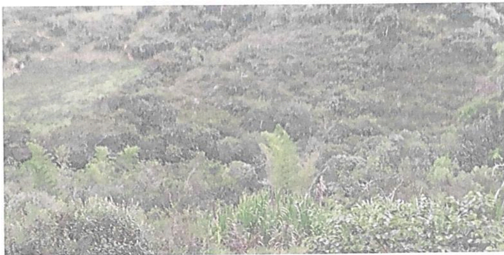
Figura 1. Muestra de ecosistema natural presente en el predio "Sin Dirección Finca El Refugio"