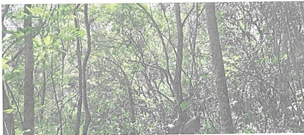
Figura 2. Muestra de ecosistema natural interior presente en el predio "Sin Dirección Finca El Refugio"

El ecosistema presente en la reserva "El refugio de Vida Silvestre - Bocoré" corresponde a un bosque secundario, asociado a coberturas de bosque ripario. Se caracteriza por presentar una vegetación arbustiva densa sobre su estrato medio, mientras que en su estrato más alto las copas de los árboles suelen ser variables, presentan una altura entre los 20 m y 35 m considerado la mayor altura en algunas especies de gran porte. En su estrato más bajo la vegetación herbácea suele ser abundante especialmente en las zonas más abiertas del dosel. La mayoría de estas especies se encuentran en diferentes estados sucesionales.