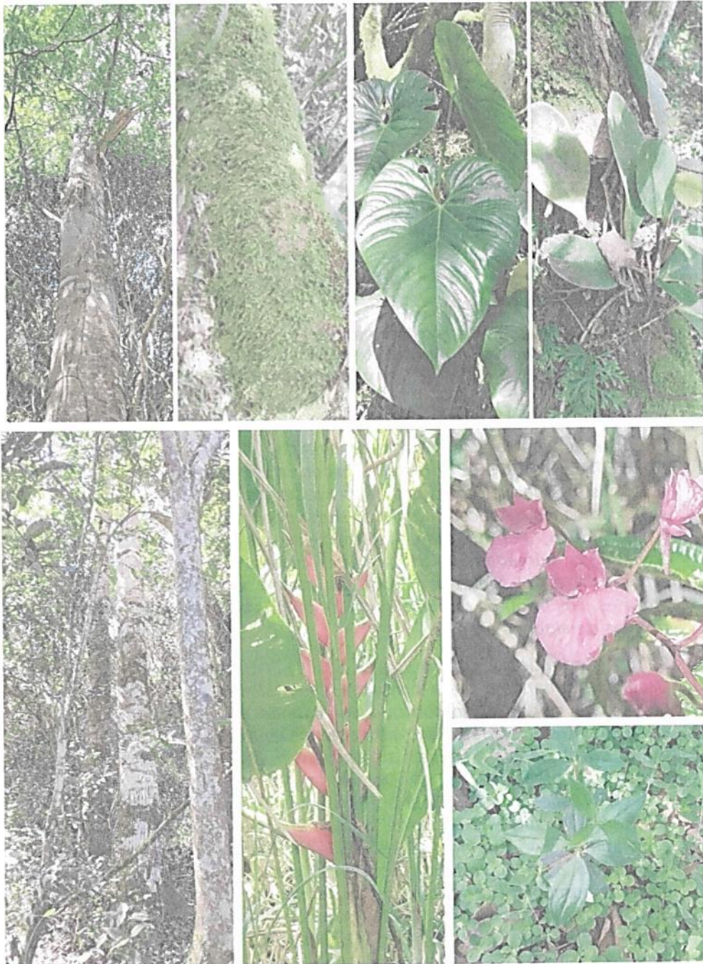
Figura 4. Flora presente en la muestra de ecosistema natural del predio "Finca El Refugio"

"POR MEDIO DE LA CUAL SE REGISTRA LA RESERVA NATURAL DE LA SOCIEDAD CIVIL "EL REFUGIO DE VIDA SILVESTRE-BOCORÉ" RNSC 042-23