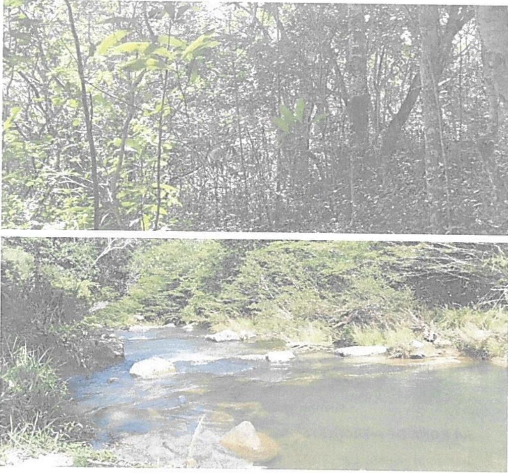
Figura 6. Zona de Conservación de la RNSC "EL REFUGIO DE VIDA SILVESTRE - BOCORÉ" – Bosque subandino y Bosque ripario

"POR MEDIO DE LA CUAL SE REGISTRA LA RESERVA NATURAL DE LA SOCIEDAD CIVIL "EL REFUGIO DE VIDA SILVESTRE-BOCORÉ" RNSC 042-23