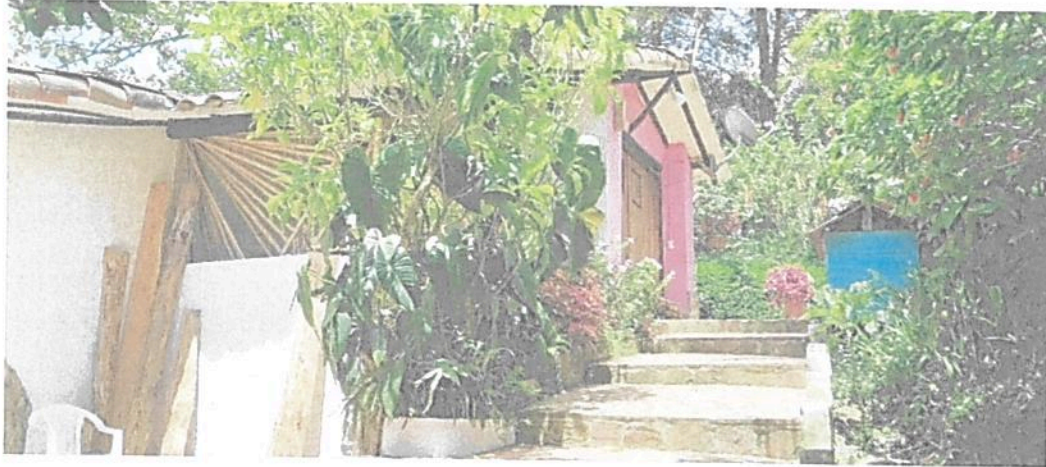
Figura 10. Zona de Uso Intensivo e Infraestructura de la RNSC "EL REFUGIO DE VIDA SILVESTRE - BOCORÉ"

Esta zona cuenta con 1,2274 ha que corresponden a 14,83 % del área total a registrar. Está conformada por el eco hotel, la vivienda principal y algunos senderos habilitados para realizar caminatas ecológicas por algunos turistas y/o huéspedes del hotel.