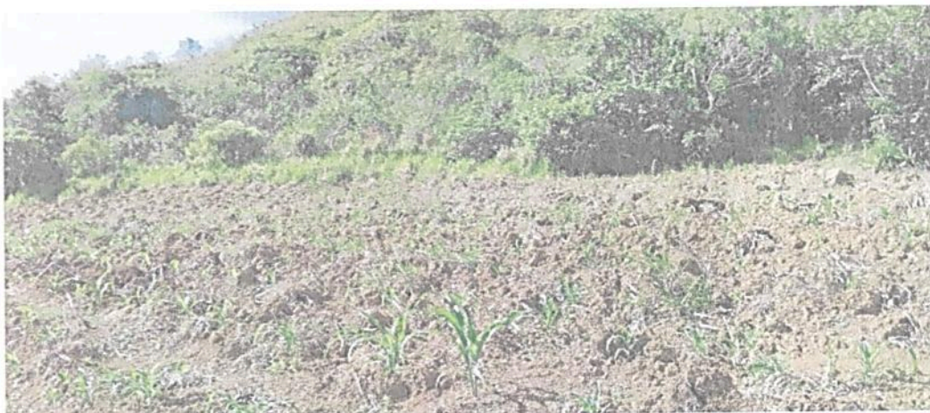
Figura 9. Zona de Agrosistemas de la RNSC "EL REFUGIO DE VIDA SILVESTRE - BOCORÉ"

Esta zona cuenta con 2,7277 ha que corresponden a 32,96 % del área total a registrar. Está conformada por cultivos de pan coger, cafetales y algunos frutales, los cuales tienen un manejo sostenible, mediante el tratamiento de compost y abonos orgánicos (Bocashi) producidos en la misma finca. El café se cultiva sobre bosque sombrío con especies arbóreas nativas. Estos procesos pretenden fomentar el uso autosostenible de la reserva, favoreciendo la seguridad alimentaria.