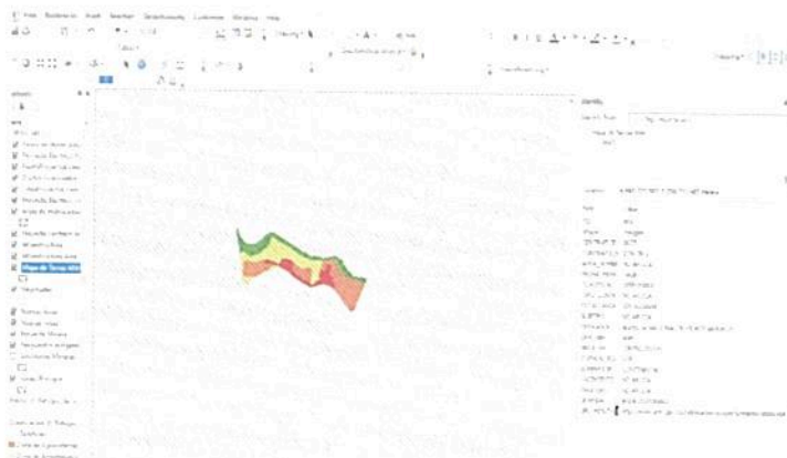
Figura 12. Traslape del predio "Sin Dirección - Finca el Refugio" inscrito bajo FMI 319-13732 con contrato COR-26-1 - Agencia Nacional de Hidrocarburos

De acuerdo con la verificación cartográfica realizada por el Grupo de Trámites y Evaluación Ambiental GTEA, el predio "Sin Dirección - Finca el Refugio" inscrito bajo el folio de matrícula inmobiliaria No. 319-13732 presenta traslape con contrato COR 26-1 en estado disponible, de acuerdo con lo consultado en la capa de la Agencia Nacional de Hidrocarburos (ANH 2022) Figura 12