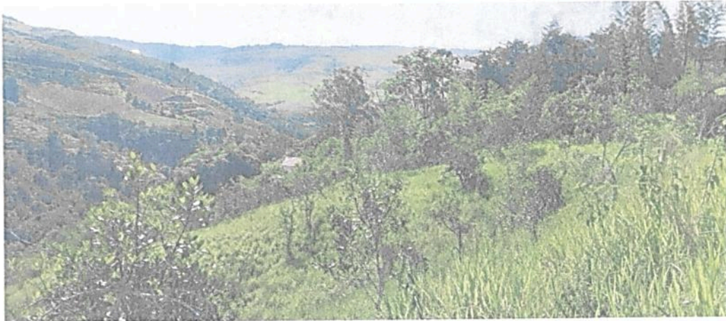
Figura 8. Zona de Restauración de la RNSC "EL REFUGIO DE VIDA SILVESTRE - BOCORÉ"

Esta zona cuenta con 2,0439 ha que corresponden a 24,70 % del área total a registrar. Está conformada por coberturas de pastos y algunos arbustos, se extiende desde la parte central de la reserva hasta el costado occidental. Esta zona se encuentra destinada para realizar actividades de restauración activa y pasiva.