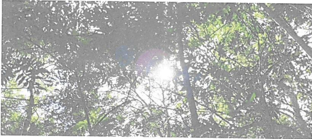
Figura 3. Muestra de ecosistema natural Interior del Bosque presente en el predio "Sin Dirección Finca El Refugio" Fuente de información: Visita técnica realizada por PNNC