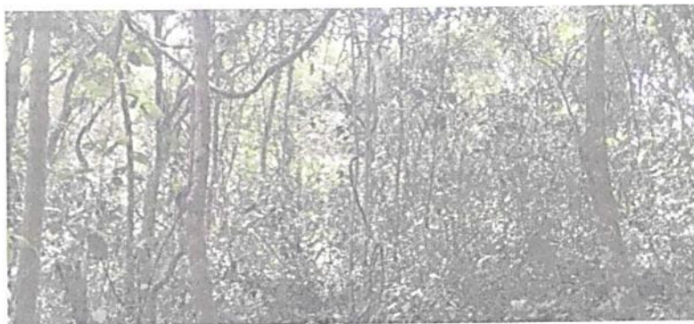
Figura 5. Zona de Conservación de la RNSC "EL REFUGIO DE VIDA SILVESTRE - BOCORÉ"

Esta zona cuenta con 2,2031 ha, que corresponden al 26,62 % del área total a registrar. Está conformada por la muestra de ecosistema natural de Bosque subandino con cobertura de bosque ripario, se localiza en la parte norte del predio. Esta área está destinada para su conservación.