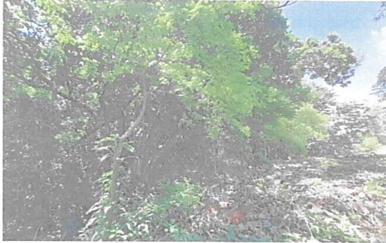
Imagen 6. Zona de Agrosistemas.

6.4. Zona de Agrosistemas: Esta zona corresponde a 0,7443 ha, equivalentes al 41,1989% del área objeto de registro. Esta zona, está conformada por un sistema agroforestal para la producción de mango principalmente, así como otras especies de pancoger.