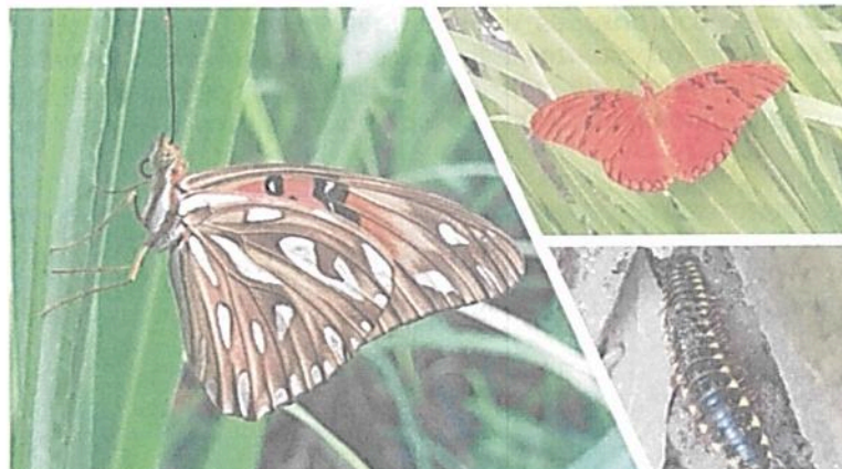
Imagen 3. Fauna observada en la RNSC "AFRA".

En la RNSC "AFRA" se cuenta con los siguientes registros de fauna: En cuanto a aves, se resalta la presencia de rapaces, tucán, búho, lechuza, oropéndola, colibríes, paloma, tangaras, bichofue, palomas, entre otras. En cuanto a mamíferos, se cuenta con los siguientes registros: ñeque, oso hormiguero, venado, ardilla, guartinaja entre otros. En los registros de artrópodos se tienen las siguientes especies: Hormiga arriera, variedades de mariposas, milpiés, escarabajos, libélulas, abejas, avispa, saltamontes entre otras. Anfibios como iguana, rana, lagartija; variedades de serpientes como la mapaná, pudridora, cascabel, bejuquilla entre otras.