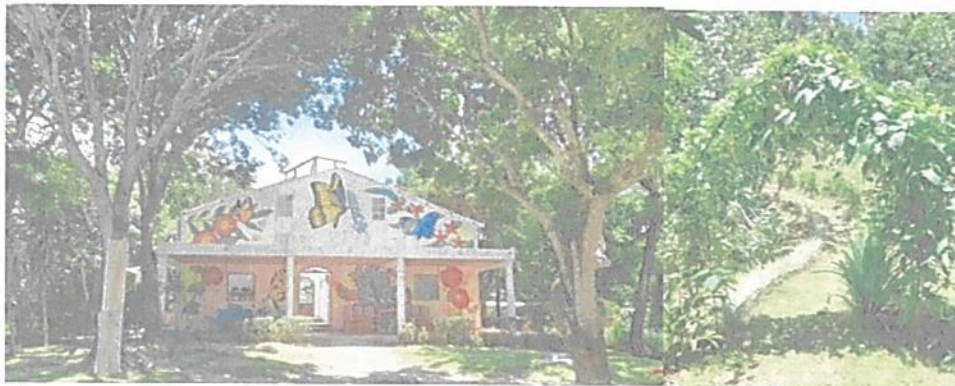
Imagen 8. Zona de Uso Intensivo e Infraestructura.

6.5. Zona de Uso Intensivo e Infraestructura: Esta zona corresponde a 0,2179 ha, equivalentes al 12,0613% del área objeto de registro. Esta zona, está conformada por una vivienda habitable, senderos y un área en la que se proyecta la construcción de otra vivienda.