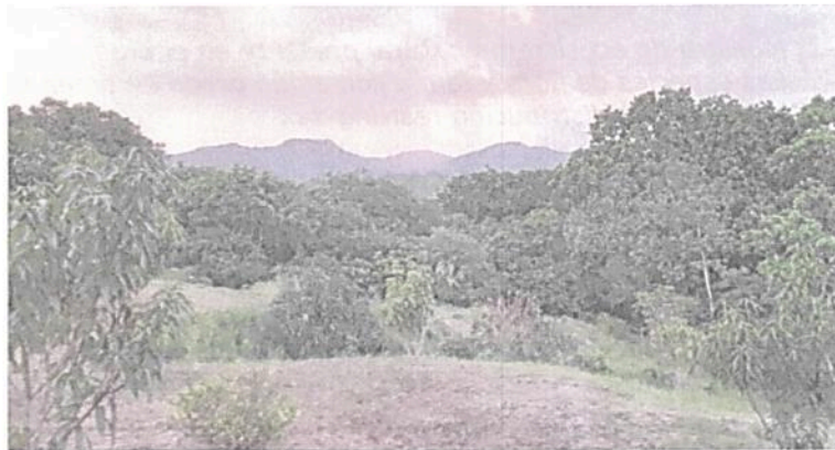
Imagen 5. Zona de amortiguación y manejo especial.

6.2. Zona de Amortiguación y Manejo Especial: Esta zona corresponde a 0,4000 ha equivalentes al 22,1410 % del área objeto de registro. Esta zona está compuesta por pastos arbolados y especies arbustivas, así como algunas especies de pancoger; no obstante, en esta zona actualmente no se realizan actividades productivas, favoreciendo los procesos de recuperación natural del ecosistema en la franja de restauración contigua a ésta.