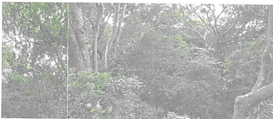
Imagen 1. Muestra de ecosistema natural presente.

La muestra de ecosistema natural presente en la RNSC "AFRA", tiene buena conectividad con bosques vecinos, favoreciendo la oferta de bienes y servicios ecosistémicos importantes para la región como son la regulación del clima, la oferta de hábitats y alimento para la protección de especies con algún grado de amenaza o endemismo, y la oferta de paisajes para el avistamiento de aves entre otros.