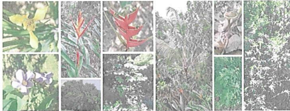
Imagen 2. Flora observada en la RNSC "AFRA".

De acuerdo con la información aportada por los usuarios, así como lo evidenciado en el marco de la visita técnica, se cuenta con los siguientes registros de flora para la RNSC "AFRA": Caracolí, indio desnudo, borrachero, hobo, matarratón, acacia, matapalo, chusque, ceiba, carbonero, variedad de melastomatáceas, y de bromelias, palmas, guarumo entre otras. Asimismo, cuenta con algunas especies de pancoger como plátano, mango, marañon y yuca entre otras plantas aromáticas, medicinales y ornamentales.