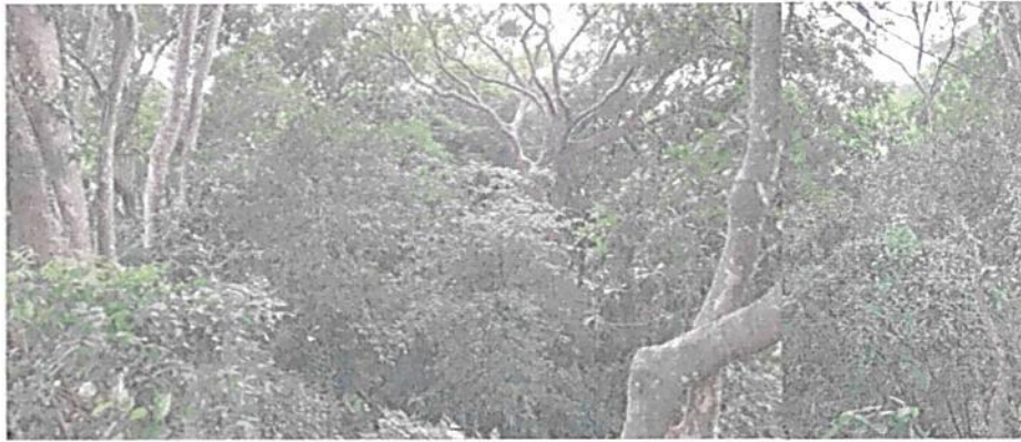
Imagen 4. Zona de conservación.

6.2. Zona de Amortiguación y Manejo Especial: Esta zona corresponde a 0,4000 ha equivalentes al 22,1410 % del área objeto de registro. Esta zona está compuesta por pastos arbolados y especies arbustivas, así como algunas especies de pancoger; no obstante, en esta zona actualmente no se realizan actividades productivas, favoreciendo los procesos de recuperación natural del ecosistema en la franja de restauración contigua a ésta.