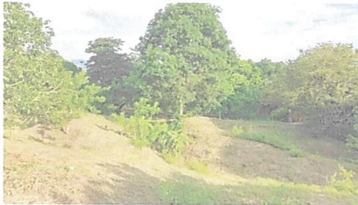
Imagen 7. Zona de Agrosistemas.

6.4. Zona de Agrosistemas: Esta zona corresponde a 0,7443 ha, equivalentes al 41,1989% del área objeto de registro. Esta zona, está conformada por un sistema agroforestal para la producción de mango principalmente, así como otras especies de pancoger.