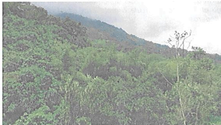
Figura 1. Vista General RNSC 185-22 ZAMU FLORESTA.

De acuerdo con la visita técnica realizada al predio "Zamu Fracción La María Ibagué", el ecosistema predominante corresponde a Bosque Húmedo Premontano, el cual presenta un estado de desarrollo secundario y algunas zonas en proceso de regeneración natural desde hace 30 años (Figura 1). En general el bosque maduro presenta árboles de más de 20m de altura con dosel conectado y cuatro estratos bien definidos, manteniendo características propias de este tipo de ecosistema, como la presencia de orquídeas y bromelias en las ramas de los árboles, alta presencia de briofitos y pteridofitos.