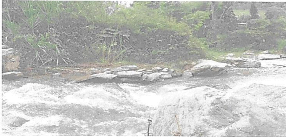
Figura 5. Zona de amortiguación de la RNSC 185-22 ZAMU FLORESTA.