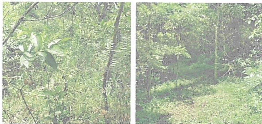
Figura 6. Zonas en proceso de regeneración natural o con interés de restauración evidenciadas en la RNSC 185-22 ZAMU FLORESTA.

Aunque inicialmente esta zona no estaba contemplada dentro de la zonificación propuesta en la solicitud de registro, se sugirió a la usuaria incluirla dentro de la zonificación, teniendo en cuenta que en el predio se evidenciaron zonas en proceso de regeneración natural, y interés de la propietaria en realizar siembra de especies forestales nativas, para ayudar al proceso de recuperación del ecosistema natural (Figura 6). Con base en eso se sugirió excluir algunas áreas de la zona de conservación e incluirlas en la zona de Restauración, una vez que estas aún no presentan la composición, estructura y/o función propias del Bosque Húmedo Premontano maduro. Una vez dichas zonas hayan alcanzado el estado de madures adecuado, podrán ser incluidas como zonas de conservación.