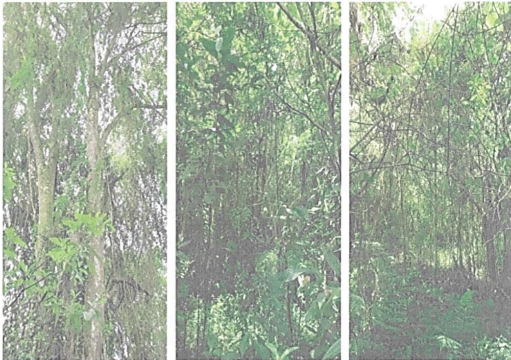
Figura 4. Zona de conservación presente en la RNSC 185-22 ZAMU FLORESTA.

Esta zona está conformada por áreas de Bosque Húmedo Premontano en buen estado de conservación y algunas áreas en procesos avanzados de regeneración. Igualmente la conforman bosques de galería asociados a la quebrada Corazón y al río Combeima. En general la vegetación es cerrada con árboles con altura promedio superior a 20m y DAP > 32cm, con estratos bien definidos. Esta zona ayuda a la conectividad estructural y funcional del ecosistema, el cual presenta una fuerte presión por el crecimiento turístico y el desarrollo urbanístico de la región, gracias a su cercanía al municipio de Ibagué. Adicionalmente aporta al sostenimiento de los servicios ecosistémicos, en especial a la regulación hídrica (Figura 4).