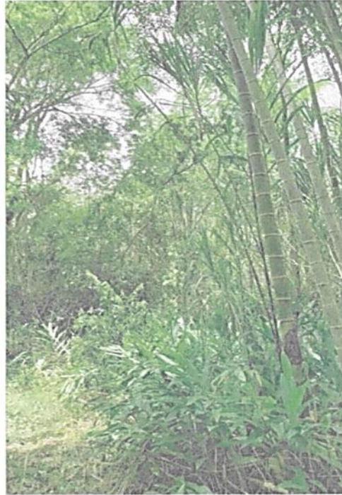
Figura 7. Zona de agrosistemas de la RNSC 185-22 ZAMU FLORESTA.