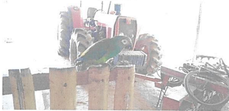
Figura 6. Cotorra registrada en la Zona de Conservación de la RNSC "EL TRIUNFO".