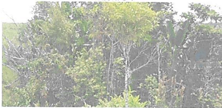
Figura 2. Flora registrada en la Zona de Conservación de la RNSC "EL TRIUNFO".

A continuación, se menciona la información aportada en la solicitud de registro sobre la flora presente en la RNSC "EL TRIUNFO" 3 "Según inventarios realizados en la zona es posible identificar (...) [50 géneros agrupados en 17 familias], se reportan 59 especies vegetales. Las familias que se destacan por el mayor número de especies son Poaceae, Araceae, Euphorbiaceae, Heliconiaceae y Myrtaceae". Algunas de las especies registradas durante la visita técnica se relacionan en las Figuras 2 a 4.