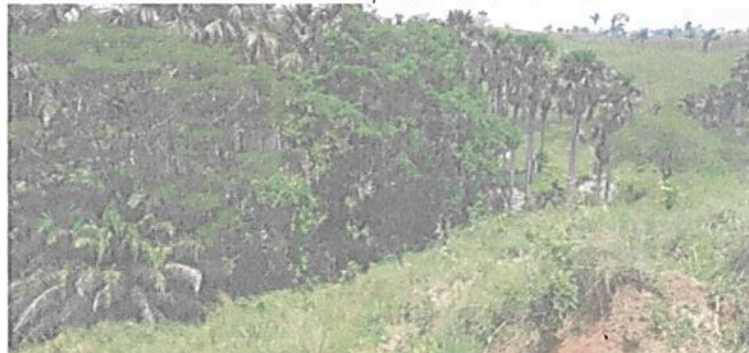
Figura 1. Muestra de ecosistema presente en la RNSC "EL TRIUNFO".

De acuerdo con la reseña la muestra de ecosistema natural del "(...) predio "SIN DIRECCIÓN . " El Triunfo " se encuentra ubicada en el bioma húmedo tropical de la amazonia en el cual predominan dos ecosistemas: bosques naturales y pastos del zonobioma húmedo tropical de la amazonia, presenta un clima cálido muy húmedo, dentro de la unidad geomorfológica de lomerío fluvio- gravitacional. En la reserva predomina la cobertura de pastos limpios, vegetación secundaria o en transición y bosques fragmentados con vegetación secundaria." 2