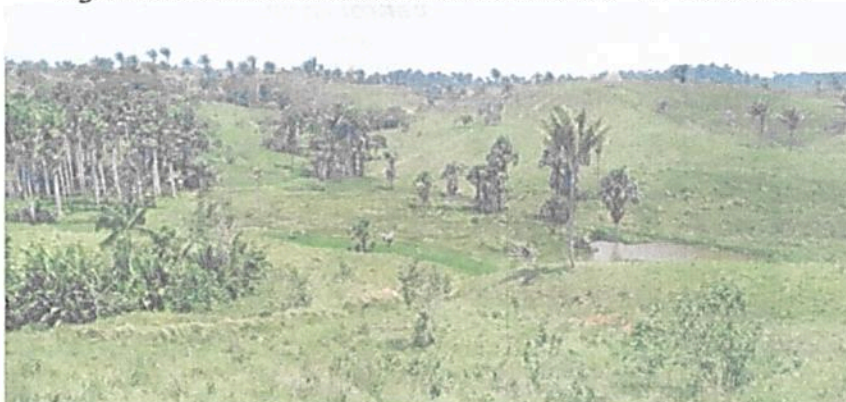
Figura 12. Zona de Restauración de la RNSC "EL TRIUNFO".

Esta zona corresponde a 1,4195 ha, equivalentes al 2,00 % del área objeto de registro. Con el objetivo de propiciar la continuidad de los parches de zona de conservación al suroccidente y al suroriente de la reserva se establecen zonas de restauración (Figuras 12 y 13). "Es un espacio dirigido al restablecimiento parcial o total a un estado anterior, de la composición, estructura y función de la diversidad biológica [del lugar], (...) se pueden llevar a cabo procesos inducidos por acciones humanas, encaminados al cumplimiento de los objetivos de conservación" 6 como "actividades de recuperación y rehabilitación de ecosistemas; manejo, repoblación, reintroducción o trasplante de especies y enriquecimiento y manejo de hábitats, dirigidas a recuperar los atributos de la diversidad" 7