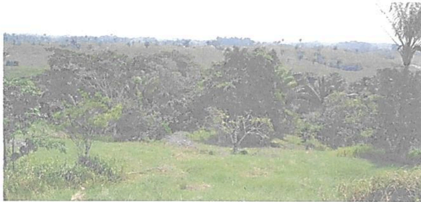
Figura 9. Relicto de bosque húmedo tropical de la Zona de Conservación en la RNSC "EL TRIUNFO".