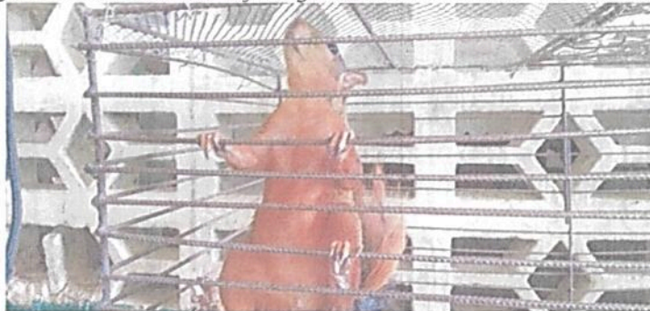
Figura 5. Ardilla cola roja registrada en la RNSC "EL TRIUNFO".

Para el grupo de las aves se reportan 55 especies; "las especies más comunes fueron Milvago chimachima , Ortalis gutata , Cyanocorax violaceus , Penelope jacquacu , registrados durante el recorrido, generalmente estas especies son comunes en boques húmedos en estados óptimos de conservación. De acuerdo con el listado de la UICN (2001) la gran mayoría de las especies están dentro de la categoría de menor preocupación (LC). Según las listas rojas de la UICN (Unión Internacional Para la Conservación de la Naturaleza)".