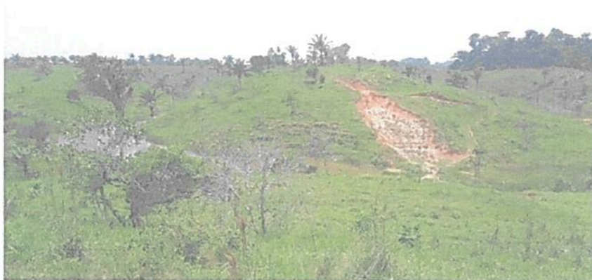
Figura 14. Vista de la Zona de Amortiguación y Manejo Especial de la RNSC "EL TRIUNFO".

Esta zona corresponde a 11,1728 ha, equivalentes al 15,73 % del área objeto de registro. Con el objetivo de propiciar la continuidad y protección a los parches de zona de conservación se encierran entre una franja de amortiguación de 3 m de ancho y se busca conectar con las zonas de amortiguación que se ubican en las zonas más bajas y húmedas de la reserva. Esta zona se encuentra conformada por cobertura "en descanso, que presenta un proceso de sucesión secundaria (Figuras 14 y 15). Esta área correspondía a pasturas que por cuestiones de manejo se degradaron; así mismo por causa del descanso la naturaleza comienza a regenerarse al punto de volver a su estado inicial (bosque), siempre y cuando las condiciones como la capacidad para regenerarse (resiliencia) lo permita." Es un "área de transición entre el paisaje antrópico y las zonas de conservación, o entre aquel y las áreas especiales para la protección como los nacimientos de agua, humedales y cauces." 8