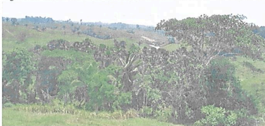
Figura 7. Vista de la Zona de Conservación de la RNSC "EL TRIUNFO".

Esta zona corresponde a 2,4301 ha, equivalentes al 3,42 % del área objeto de registro. Se encuentra conformada por muestras de ecosistema natural de Bosque Húmedo Tropical, Cananguchales y las Fuentes Hídricas asociadas; se encuentran "ubicadas en zona de lomerío" al suroriente, al sur y al suroccidente de la reserva (Figuras 7 a 11). Esta cobertura natural se caracteriza por la presencia de relictos de bosque natural intervenido en proceso de recuperación, con alturas promedio de 10 metros y con algunos individuos de aproximadamente 15 metros. "(...) el manejo [en esta área] está dirigido ante todo a evitar su alteración, degradación o transformación por la actividad humana" 5