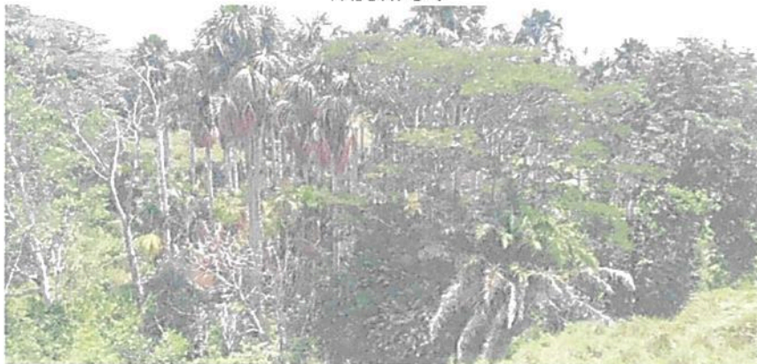
Figura 10. Cananguchales de la Zona de Conservación en la RNSC "EL TRIUNFO".