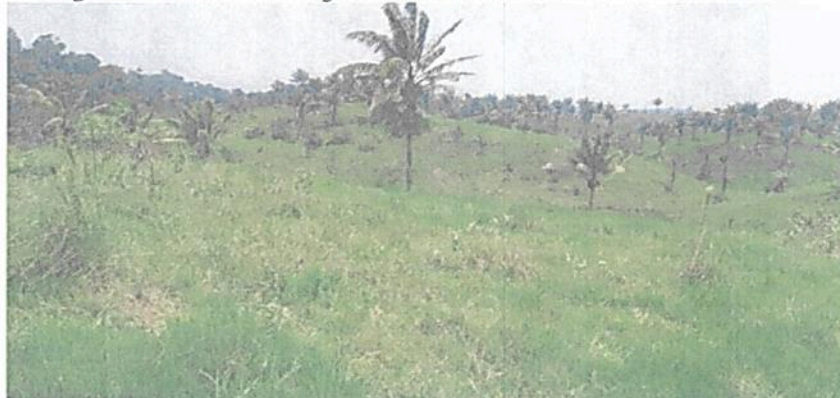
Figura 16. Zona de Agrosistemas de la RNSC "EL TRIUNFO".

Esta zona corresponde a 55,9918 ha, equivalentes al 78,85 % del área objeto de registro. "Las pasturas es la cobertura que predomina (...) [en esta zona], está constituida principalmente por pastos africanos tipo Brachiaria , adaptados a las condiciones edafoclimáticas de la zona y empleados para la producción ganadera (Figuras 16 y 17). Esta cobertura es densa y homogénea en todo el paisaje, en ella encontramos las especies Brachiaria decumbens , Brachiaria humidicola , Brachiaria brizantha . Algunos aspectos de manejo influyen sobre el mantenimiento de las pasturas, al igual que la resistencia del sistema para soportar una cobertura ajena. Por estas razones, muchas pasturas se encuentran mezcladas con pastos nativos y otras herbáceas que brotan de las semillas latentes del suelo, entre estas especies encontramos conocidas como paja de zorro, guaduilla, pasto nativo, cortadera, entre otras. [Así mismo,] se encontraron arboles aislados asociados como: guayabo, ( Psidium guajava ), samanes, ( Samanea saman (Jacq.)) y otros árboles presentes en este tipo de cobertura fueron el tachuelo ( Zanthoxylum rhoifolium ), yarumo ( Cecropia sp), patevaca ( Bauhinia forficata ), pomo silvestre ( Syzygium jambos ), cordoncillo ( Piper aduncum ), en general."