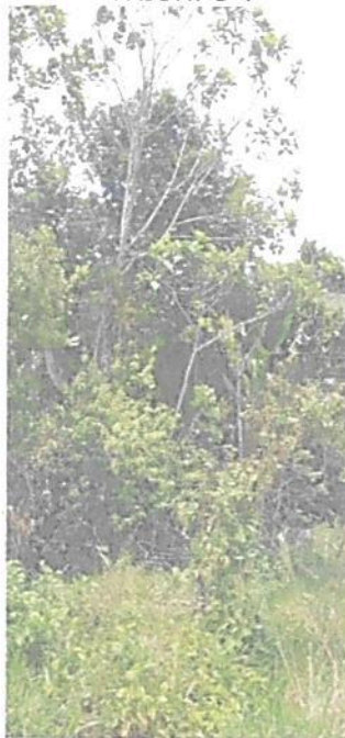
Figura 3. Flora registrada en la Zona de Conservación de la RNSC "EL TRIUNFO".