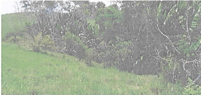
Figura 4. Flora registrada en la Zona de Conservación de la RNSC "EL TRIUNFO".