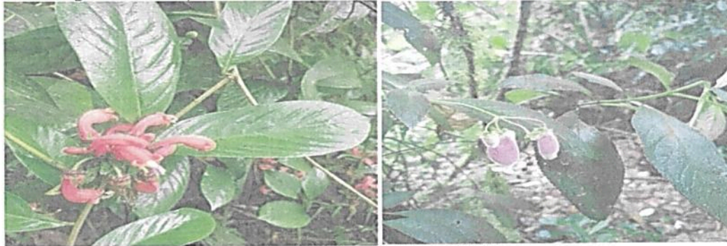
Figura 2. Composición de la flora presente en la RNSC "CONCHUCUA".