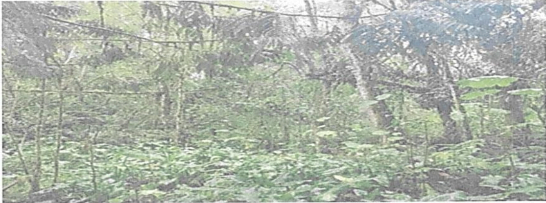
Figura 5. Zona de amortiguación y manejo especial del predio denominado "SIN DIRECCION" inscrito bajo el folio de matrícula inmobiliaria No. 018-33956, que conforma la RNSC "CONCHUCUA".