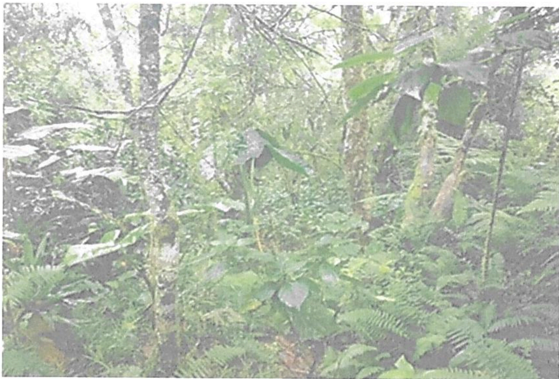
Figura 4. Zona de conservación de los predios denominados "SIN DIRECCION" inscrito bajo el folio de matrícula inmobiliaria No. 018-33956 y el predio "LOTE" inscrito bajo el folio de matrícula inmobiliaria No. 018-79743, que conforma la RNSC "CONCHUCUA".

Fuente: Equipo de Biodiversidad de CORNARE.