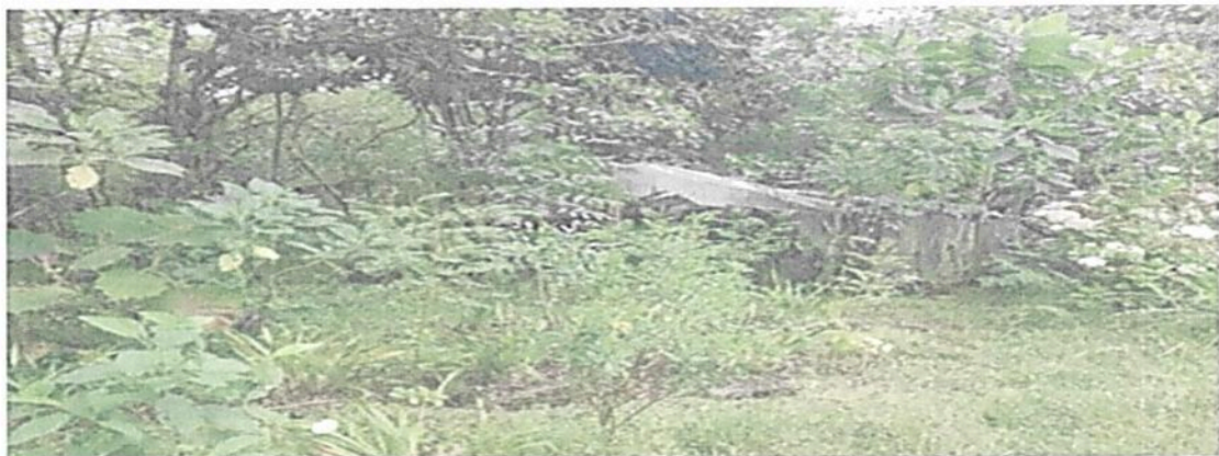
Figura 6. Zona de Agrosistemas del predio denominado "SIN DIRECCION" inscrito bajo el folio de matrícula inmobiliaria No. 018-33956, que conforma la RNSC "CONCHUCUA".

Fuente: Equipo de Biodiversidad de CORNARE.