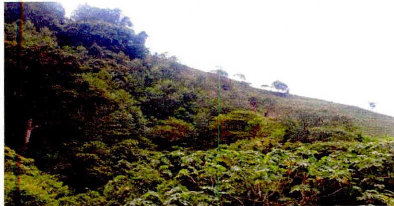
Fotografía: Muestra de ecosistema presente en el predio La Miranda

El predio "La Miranda" se ubica en la zona amortiguadora del PNN las Herosas, en la zona media de la Subcuenca Amoyá, área caracterizada por tener ecosistemas fragmentados, los ecosistemas predominantes son el Bosque subandino, que a través de la historia ha sido transformado de forma extensiva, para cultivos de café, pancoger y ganadería. El predio contiene dos parches de bosques, con vegetación secundaria que albergan biodiversidad significativa y contribuyen con la regulación del ciclo hidrológico de la zona debido a su cercanía con los bosques protectores asociados a la quebrada Aguas claras, tributarios del río Davis que desemboca en el río Amoyá. Áreas que cohabitan con zonas en potrerización.