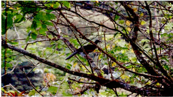
Fotografía: Avifauna presente en el predio La Miranda, Guacharaca (Otalis ruficauda)