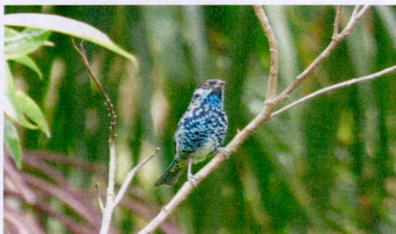
Fotografía: Avifauna presente en el predio "La Miranda", Tangara de Lentejuelas ( tangara nigroviridis )

La organización articuladora evidencia la presencia del tigrillo lanudo ( Leopardus tigrinus ) que se encuentra en una categoría de vulnerable (VU).