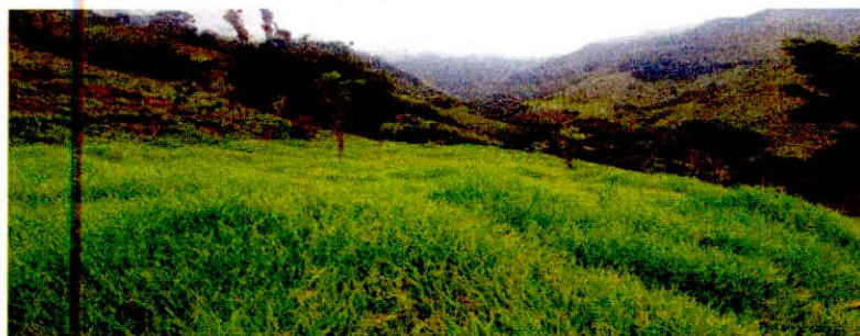
Fotografía: Zona de Agrosistemas, presente en el predio La Miranda

El área de agrosistemas equivale al 72,46% (27,1883 ha) del predio "La Miranda", esta zona está representada por un área para potreros, con cerca eléctrica, actualmente posee 15 novillos. Tiene además dos lotes para el cultivo de café (variedad castillo y caturra).