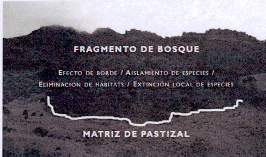
Imagen: Algunas de las principales consecuencias de la fragmentación de los ecosistemas de alta montaña.

Es de tener en cuenta que la zona andina, caracterizada como cordillerana, ha sido una de las regiones colombianas donde se han desarrollado diferentes actividades económicas y culturales, lo que ha generado un incremento desordenado en la demografía de la región, con grandes amenazas (MinAmbiente et al., 2002) 12 . El factor de desarrollo económico y cultural acelerado, sumado a la falta de planificación territorial, ha generado un incremento de las amenazas y la vulnerabilidad, como es, entre otras, la transformación y destrucción de las coberturas vegetales presentes en la región andina (Castaño-Uribe, 1991 13 ; Cavelier, 1991 14 ; Van der Hammen & Rangel, 1997 15 ).