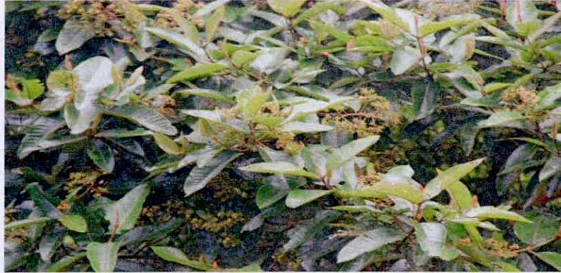
Fotografía: Flora presente en el predio La Miranda