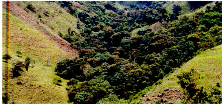
Fotografía: Zona de Conservación, presente en el predio La Miranda

"... La zona conservación del predio "La Miranda" se compone por muestras de ecosistemas de bosque sub andino que cumplen funciones de regulación hídrica por la presencia de drenajes asociados a la Quebrada Aguas Claras, tributaria del Río Davis, de la cuenca del Amoyá, donde habitan diversas especies de fauna y flora local. Esta zona presenta 8,5970 ha en la zona norte y sur del predio, que corresponden al 22,91% del total del área del predio 5 ....".