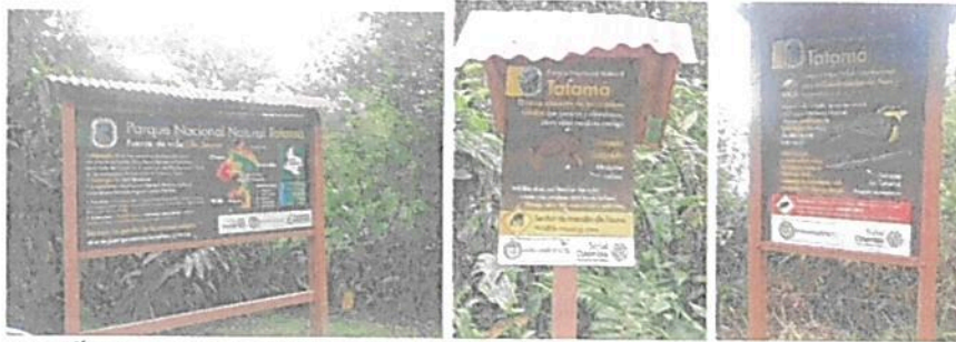
Fotografía 1, 2 y 3. Registro del estado de recuperación o mantenimiento de algunas de las vallas instaladas en el PNN Tatamá.

Situación encontrada: Durante la visita a la estación no se suministraron los soportes documentales de las jornadas de capacitación al personal vinculado a la estación en temas de conservación y protección de fauna silvestre (por parte de Parques Nacionales). Sin embargo, se informó que estos soportes se encuentran dentro de los Informes trimestrales internos, por lo que serán suministrados inmediatamente una vez sean notificados de dicho requerimiento. Por otra parte, es de señalar, que no se registra la presencia de especies silvestres al interior del área de influencia de la estación (avistamientos). Igualmente se informa que no se reporta la presencia de especies silvestres de fauna en los alrededores de las instalaciones. En lo relacionado con la señalización, se pudo observar que las vallas recibieron un tratamiento preventivo de lacado en barniz sobre la madera, lo que ha garantizado una mayor duración de las vallas ante las condiciones de intemperie (lluvia – sol).