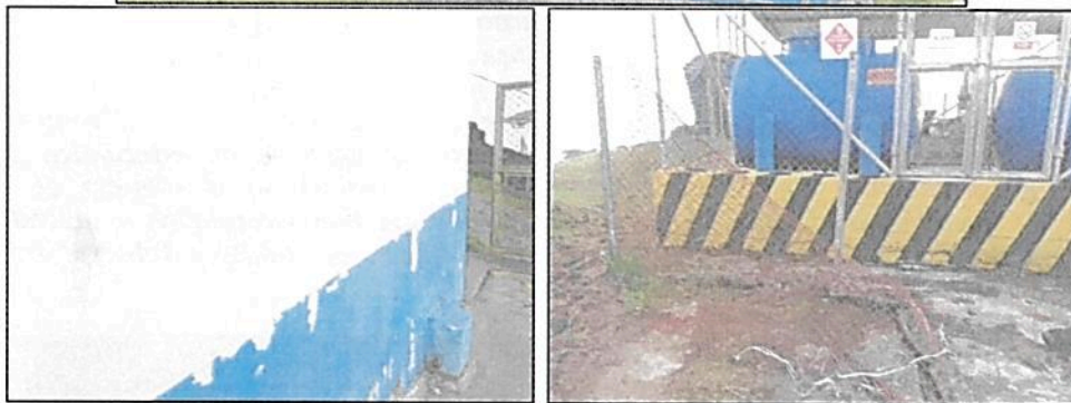
Fotografía 3, 4 y 5. Estado de tejas de cuarto de plantas, malla de cerramiento de tanque y pintura de las instalaciones de la estación.