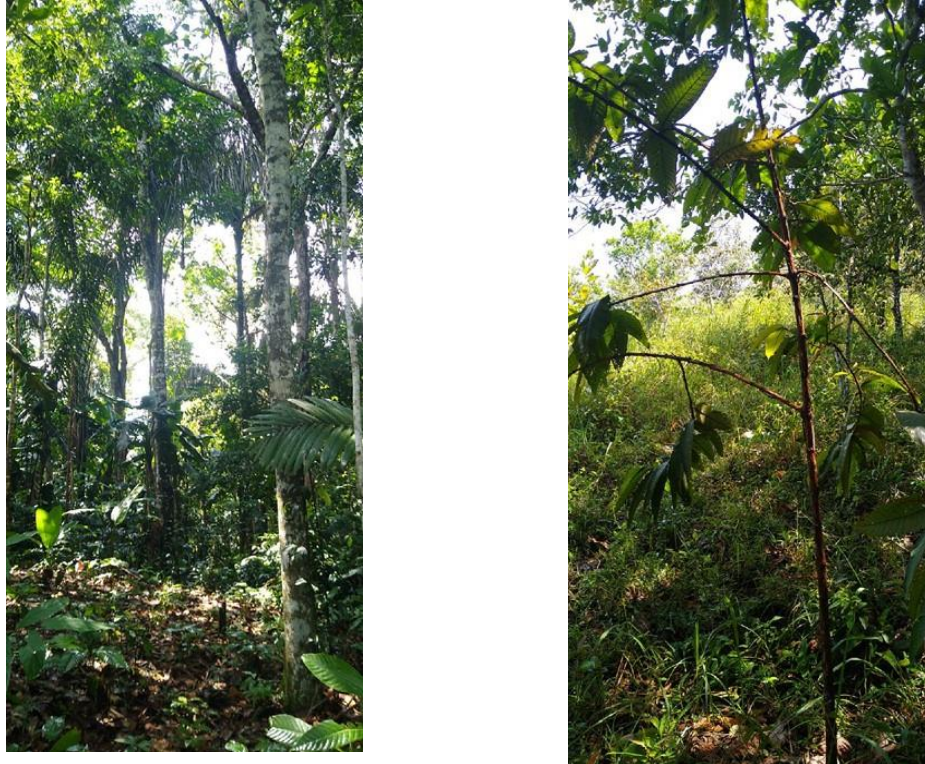
Figura 4. Flora registrada en la RNSC "COSTA RICA".