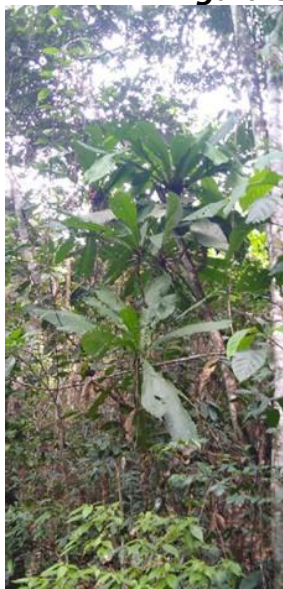
Figura 3. Flora registrada en la RNSC "COSTA RICA".