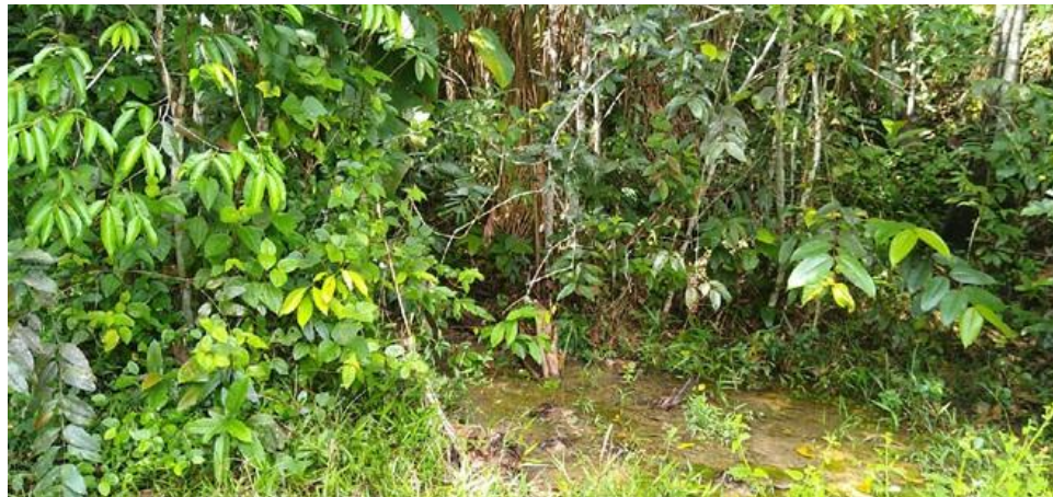
Figura 2. Nacederos registrados en la RNSC "COSTA RICA".