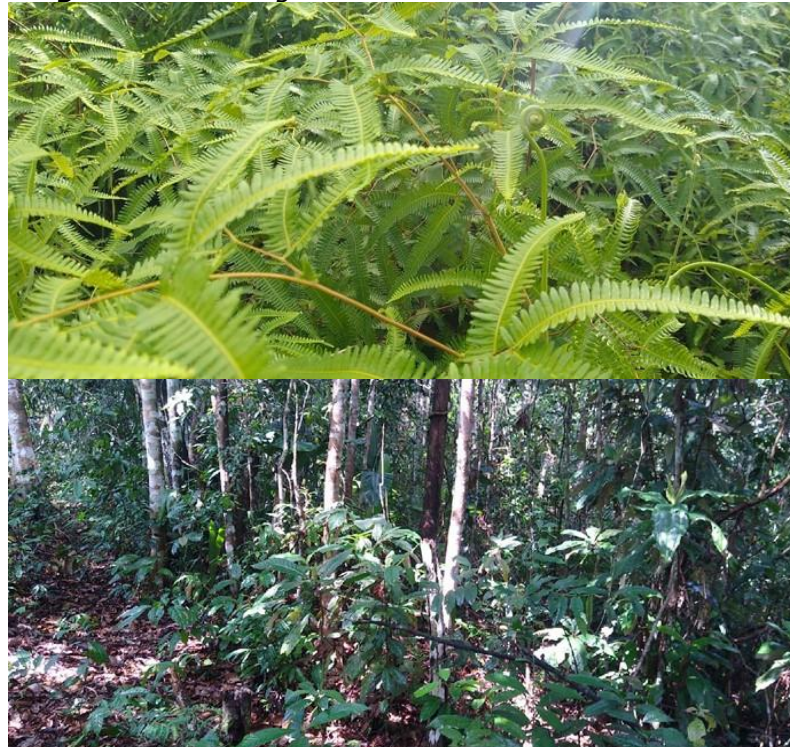
Figura 5. Flora registrada en la RNSC "COSTA RICA".