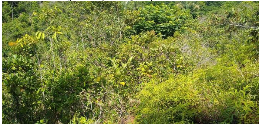
Figura 8. Zona de Amortiguación y Manejo Especial en la RNSC "COSTA RICA".

Esta zona corresponde a 5,8857 ha, equivalentes al 12% del área objeto de registro. Conformada por potreros en descanso que presentan un proceso de sucesión secundaria temprana (Figura 8). Se encuentra formando principalmente franjas de aproximadamente 5 metros de ancho que separan las Zonas de Conservación y de Restauración de la Zona de Agrosistemas. También se encuentra sobre el sendero que atraviesa la reserva y mide un ancho aproximado de 6 metros. Es un "área de transición entre el paisaje antrópico y las zonas de conservación, o entre aquel y las áreas especiales para la protección como los nacimientos de agua, humedales y cauces." 8