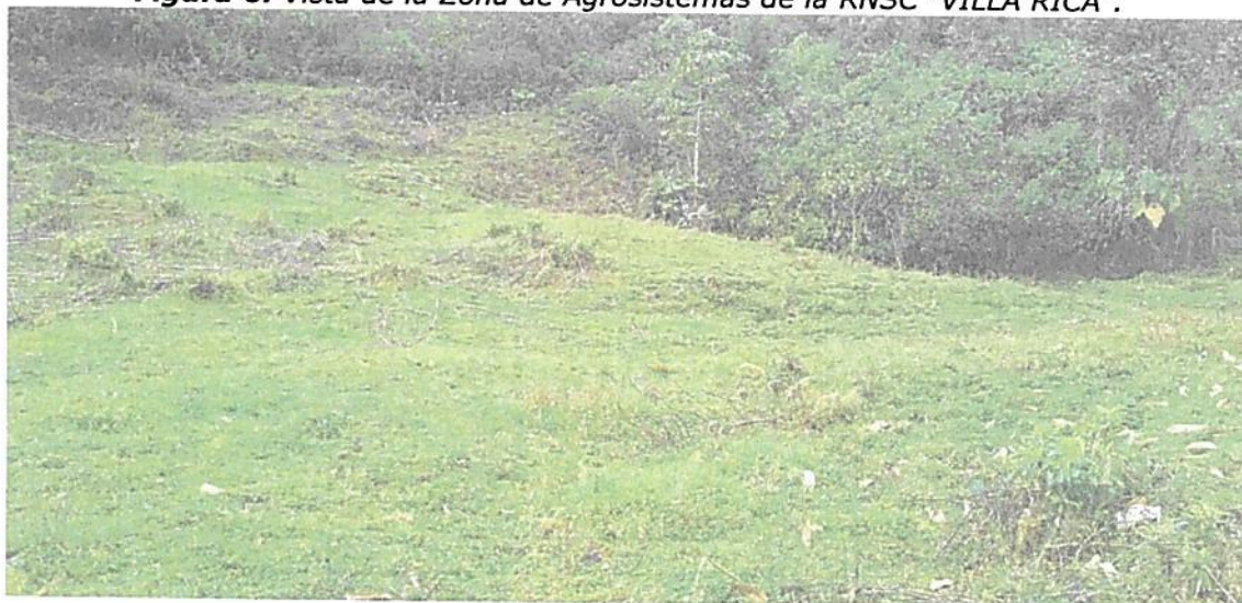
Figura 6. Vista de la Zona de Agrosistemas de la RNSC "VILLA RICA".

Esta zona corresponde a 5,4731 ha del área de actualización del registro, es decir, 53,36% y corresponde a potreros abiertos destinados a la cría de ganado bovino.