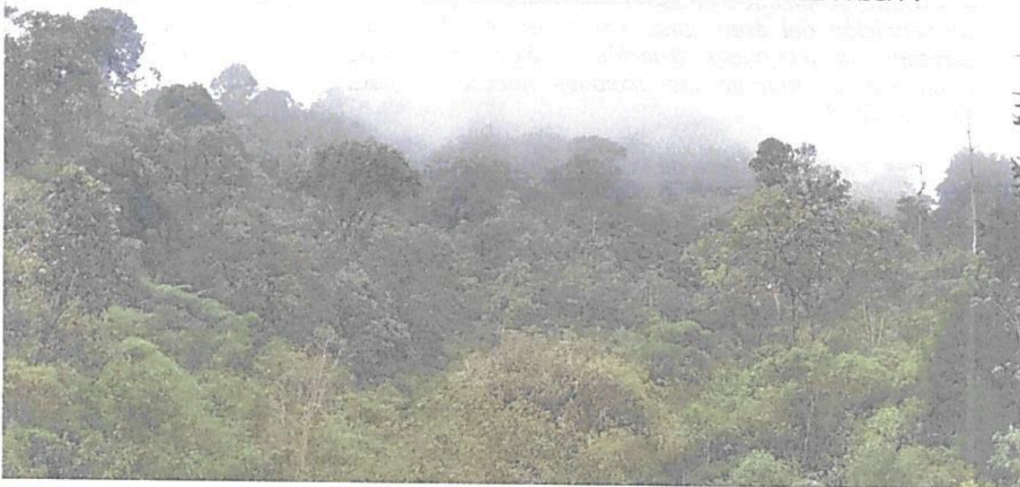
Figura 3. Vistas de la Zona de Conservación de la RNSC "VILLA RICA".

Esta zona corresponde a 3,5815 ha del área de actualización del registro, es decir, 34,92% y está conformada por una muestra de "bosque subandino (...) [secundario en el cual] se pueden encontrar árboles de procesos avanzados de sucesión y de alturas mayores a 20 metros (...). En esta zona se encuentra la franja protectora de las quebradas, y del nacimiento (...)" "(...) el manejo [en esta área] está dirigido ante todo a evitar su alteración, degradación o transformación por la actividad humana" 3