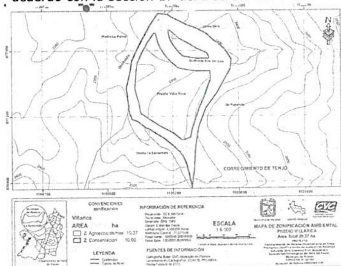
Figura 1. Zonificación Reserva Natural de la Sociedad Civil "VILLA RICA" de acuerdo con la sección 17 del Decreto 1076 de 2015.

Fuente: Resolución No. 056 del 06 de noviembre de 2012.