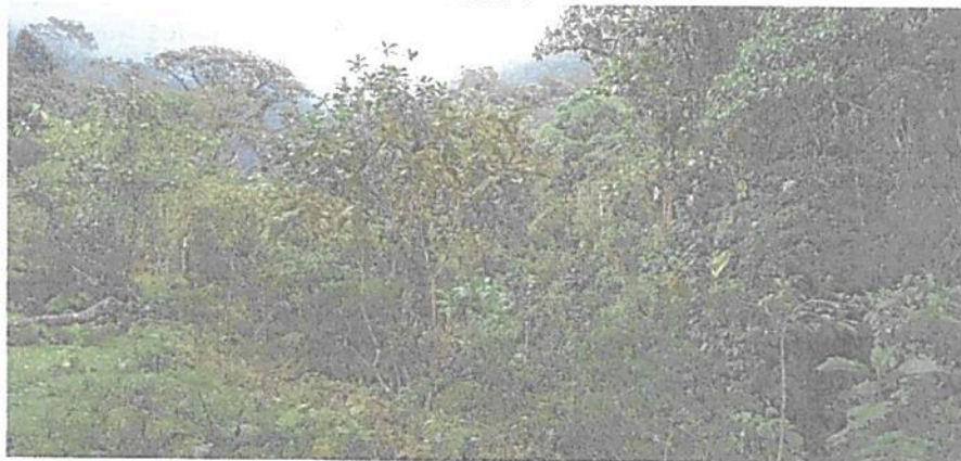
Figura 5. Vista de la Zona de Amortiguación y Manejo Especial de la RNSC "VILLA RICA".

POR MEDIO DE LA CUAL SE MODIFICA LA RESOLUCIÓN NO. 056 DEL 06 DE NOVIEMBRE DE 2012 "POR MEDIO DE LA CUAL SE REGISTRA LA RESERVA NATURAL DE LA SOCIEDAD CIVIL "VILLA RICA"