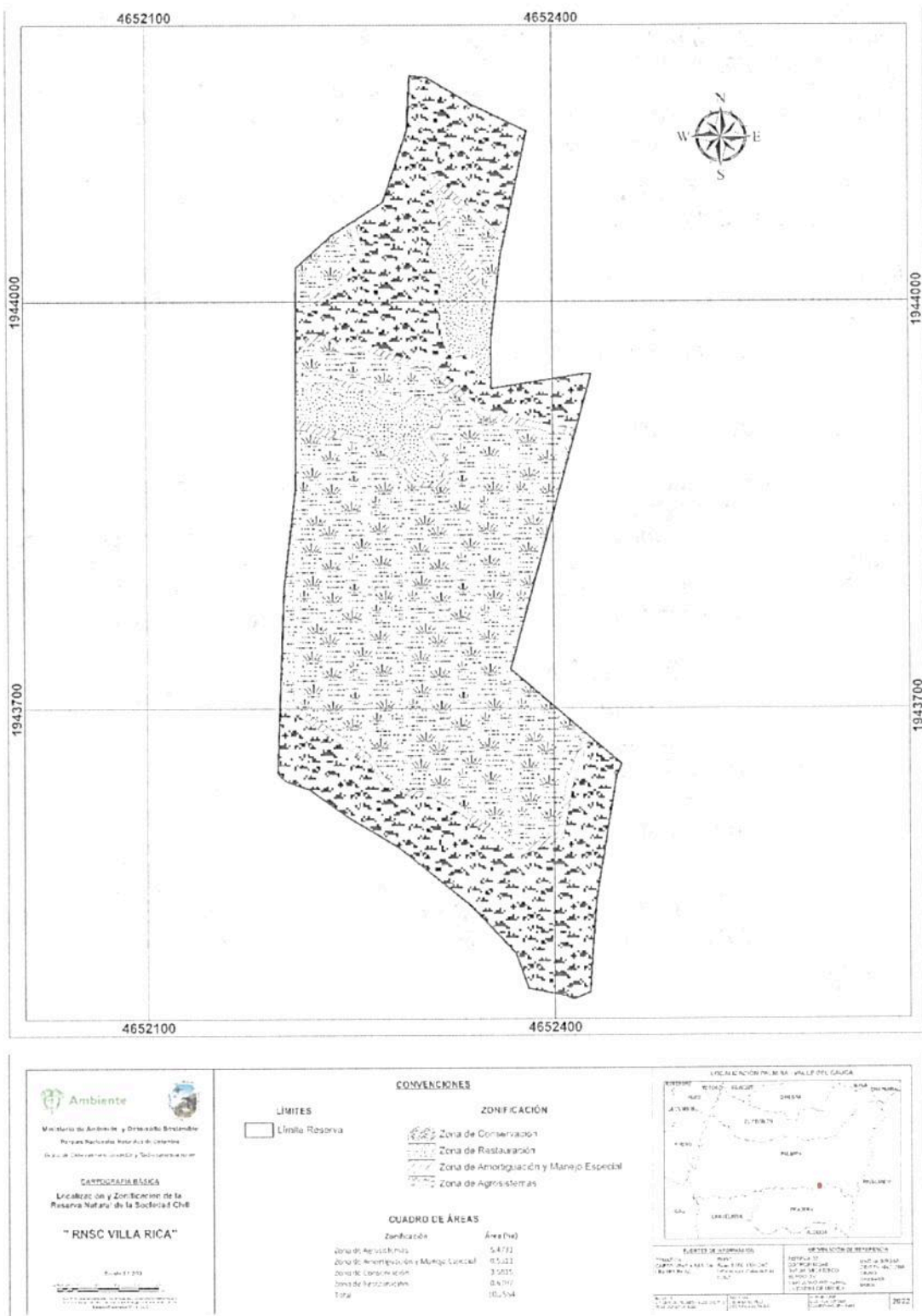
Figura 2. Nueva zonificación para el registro de la Reserva Natural de la Sociedad Civil "VILLA RICA".

POR MEDIO DE LA CUAL SE MODIFICA LA RESOLUCIÓN NO. 056 DEL 06 DE NOVIEMBRE DE 2012 "POR MEDIO DE LA CUAL SE REGISTRA LA RESERVA NATURAL DE LA SOCIEDAD CIVIL "VILLA RICA"