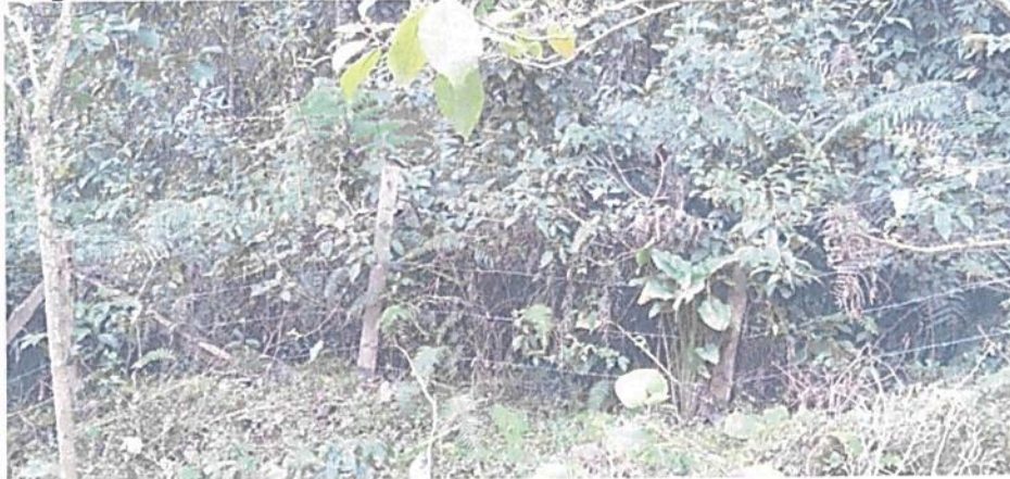
Figura 4. Vista de la Zona de Restauración de la RNSC "VILLA RICA".

Esta zona corresponde a 0,6707 ha del área de actualización del registro, es decir, 6,54% y está conformada por vegetación nativa asociada a los cuerpos de agua, la cual se encuentra rodeada por una cerca para protegerla. Se encuentra ubicada al norte y al sur de la reserva. "Es un espacio dirigido al restablecimiento parcial o total a un estado anterior, de la composición, estructura y función de la diversidad biológica. En las zonas de restauración se pueden llevar a cabo procesos inducidos por acciones humanas, encaminados al cumplimiento de los objetivos de conservación del área protegida. Un área protegida puede tener una o más zonas de restauración, las cuales son transitorias hasta que se alcance el estado de conservación deseado y conforme los objetivos de conservación del área, caso en el cual se denominará de acuerdo con la zona que correspondan a la nueva situación. Será el administrador del área protegida quien definirá y pondrá en marcha las acciones necesarias para el mantenimiento de la zona restaurada." 4