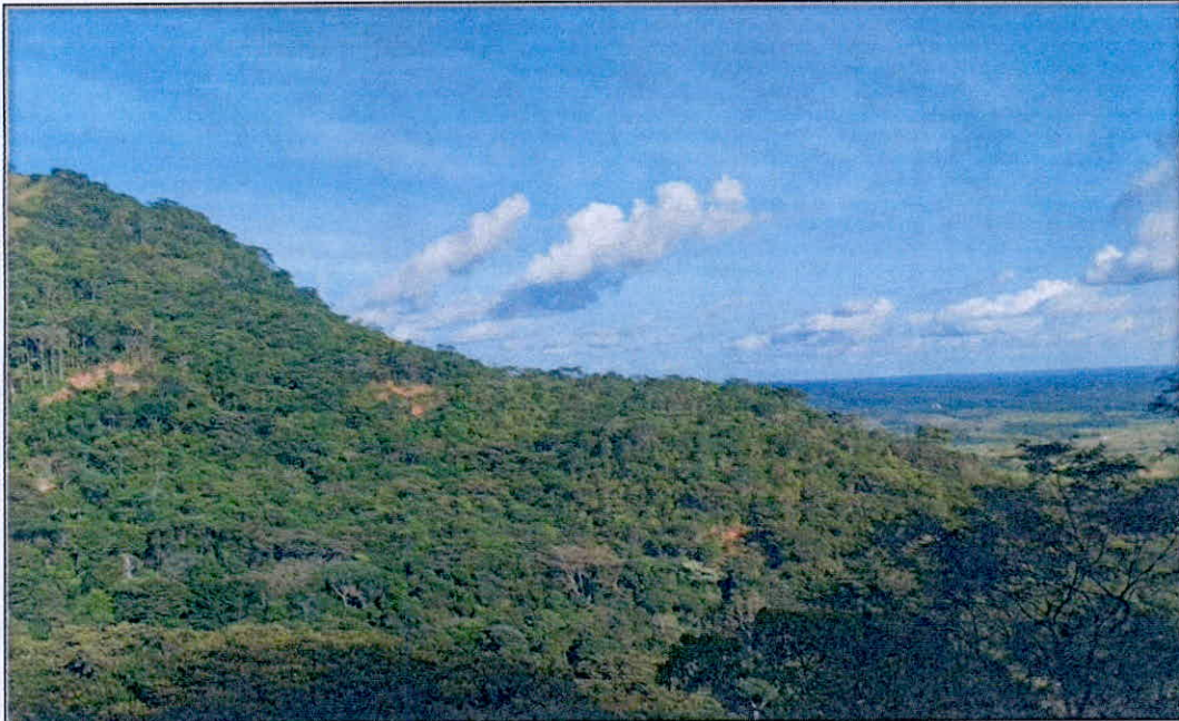
Figura 1. Panorámica de la muestra de ecosistema natural presente en el predio "Sin dirección. Las Mercedes"

El bosque presenta una cobertura de bosque alto denso heterogéneo de tierra firme 1 y bosque ripario. En su interior, se evidencia una estratificación definida donde se encuentra una vegetación espesa con predominio de especies arbóreas de gran porte, las cuales presentan una altura superior a los 30 metros, con un dosel continuo, en algunas zonas un poco abierto, mientras que en el estrato emergente se aprecian principalmente especies de la familia Arecaceae. Sobre la parte media y baja el sotobosque es dominado por algunas especies arbustivas y arbóreas en diferentes estados sucesionales, y en su estrato herbáceo presenta gran cantidad de hojarasca.