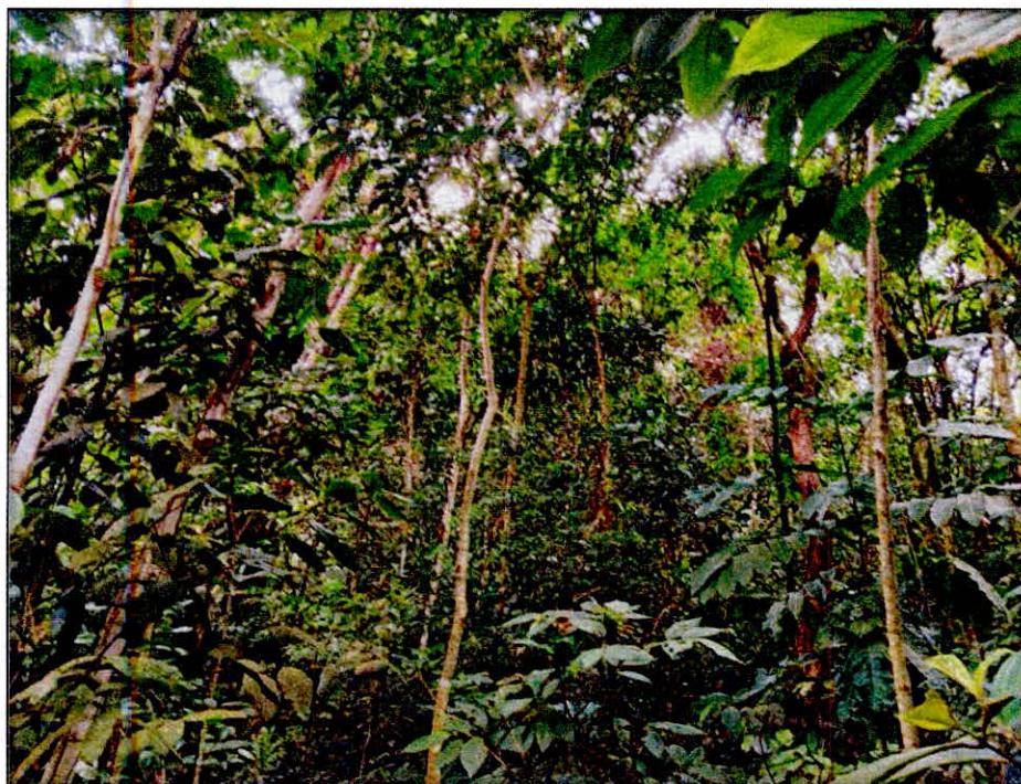
Figura 2. Muestra de ecosistema natural presente en el predio "Sin dirección. Las Mercedes" en su interior

Fuente de información: Visita técnica realizada por PNNC