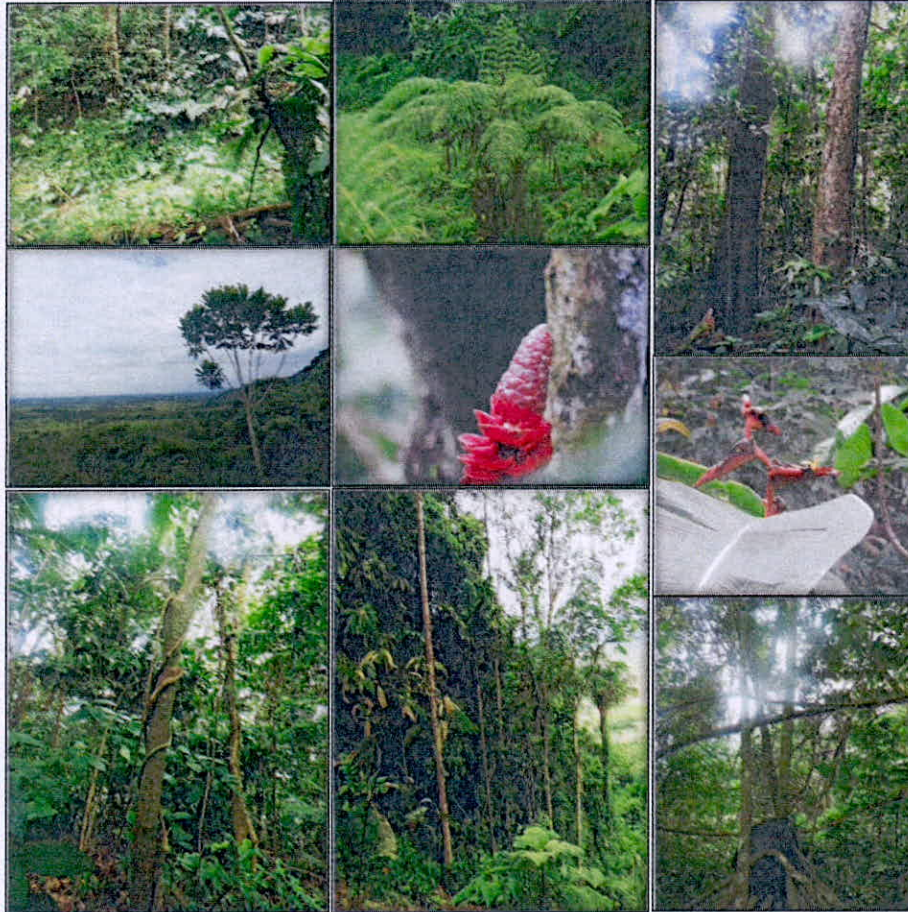
Figura 3. Flora presente en el predio "Sin dirección. Las Mercedes"