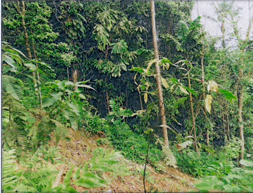
Figura 6. Zona de Amortiguación y Manejo Especial de la RNSC "Las Mercedes"