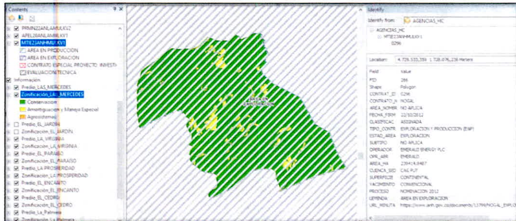
Figura 7. Traslape del predio "Sin dirección. Las Mercedes" inscrito bajo FMI 420-38301 con área de exploración y producción contrato 0296 a cargo de EMERALD ENERGY PLC

Ahora bien, el día 12 de septiembre de 2023 mediante oficio radicado No 20232300006553 de 11/09/2023 se solicitó a EMERALD ENERGY PLC información sobre la realización de actividades de excavación, adecuación de servidumbres y/o rellenos entre otras, al interior del predio "Sin Dirección Las Mercedes" identificado con FMI No. 420-38301 ubicado en la vereda Las Margaritas del municipio La Montañita, departamento del Caquetá. No obstante, a la fecha no se ha obtenido respuesta por parte de la operadora EMERALD ENERGY PLC.