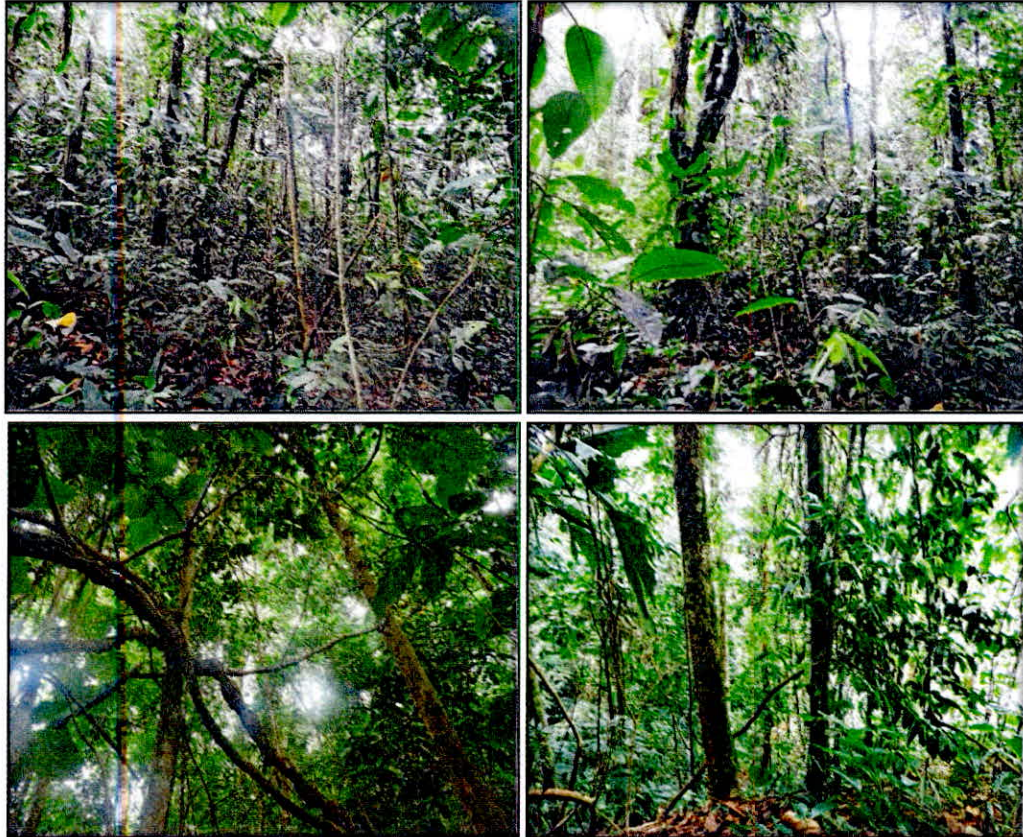
Figura 5. Zona de Conservación de la RNSC "LAS MERCEDES" Bosque Húmedo tropical (BHT)

Esta zona cuenta con 34,4907 ha, que corresponden al 94,28 % del área total a registrar. Está conformada por la muestra de ecosistema natural de Bosque húmedo tropical (BHT), representado por una cobertura de Bosque alto denso heterogéneo y Bosque ripario. Esta área está destinada para su conservación