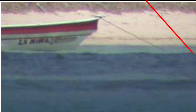
Figura 5. Zona de la presunta infracción en el costado sur occidental de la bahía de Chengue, donde los vientos alisios dan directamente en un sitio donde la pendiente pronunciada (línea roja) y el oleaje es alto, lo cual puede brindar susceptibilidad a erosión naturalmente, la cual se podría agravar por la extracción de arena.

El 08 de marzo de 2011 siendo las 09:00 am, se encontró en el sector de Chengue con unos bultos de arena que se extrajeron presuntamente en la bahía de Chengue, estos bultos serían transportados en una lancha de nombre La Niña Juana, procedente de Taganga. En el momento que fueron sorprendidas cuatro personas las cuales huyeron del sitio, se tomaron como evidencias fotos y videos (figura 5 y 6).