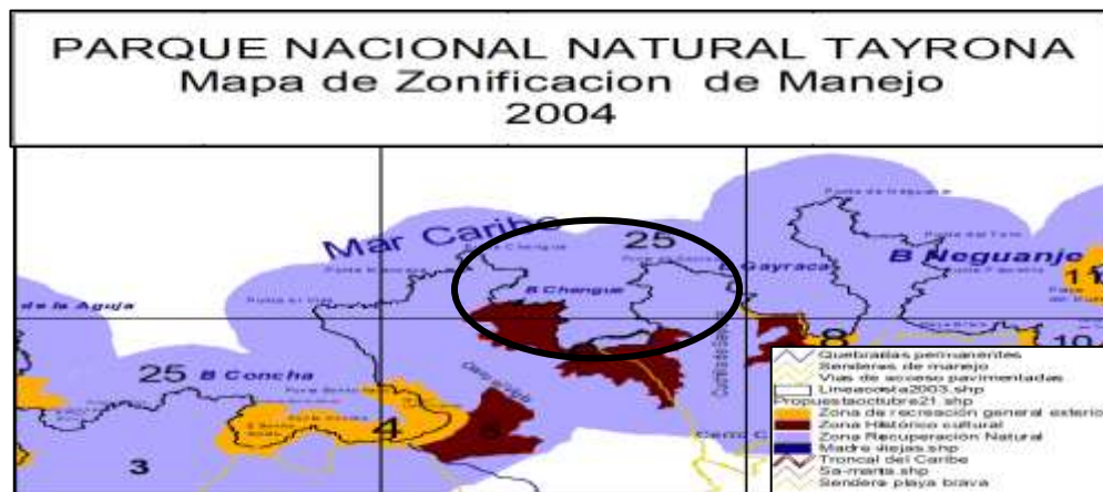
Figura 2. Zonificación del PNNT según resolución 0234 de 2004. Se resalta la Bahía de Chengue - Zona 6 Histórico Cultural, donde presuntamente ocurrió la extracción de arena - Expediente 013//2011 PNNT.

Zona 6. Zona Histórico Cultural, Cuenca baja de la Quebrada de Chengue: Con un área total de doscientos veinticuatro punto siete hectáreas (224.7 Ha aproximadamente), ubicada en el sector sur y suroccidental de la Bahía de Chengue , partiendo de la desembocadura del cauce (sin nombre) por su ramal izquierdo, siendo éste el punto de partida, se va aguas arriba por su ramal izquierdo hasta encontrar la cota doscientos metros sobre el nivel del mar (200 m.s.n.m.) se sigue dicha cota hacia el norte hasta encontrar el cruce con el cauce (sin nombre) que desemboca en la playa de la Ensenada Macuaca y se continua por la línea de más alta marea hacia el terreno consolidado hasta el punto de partida.