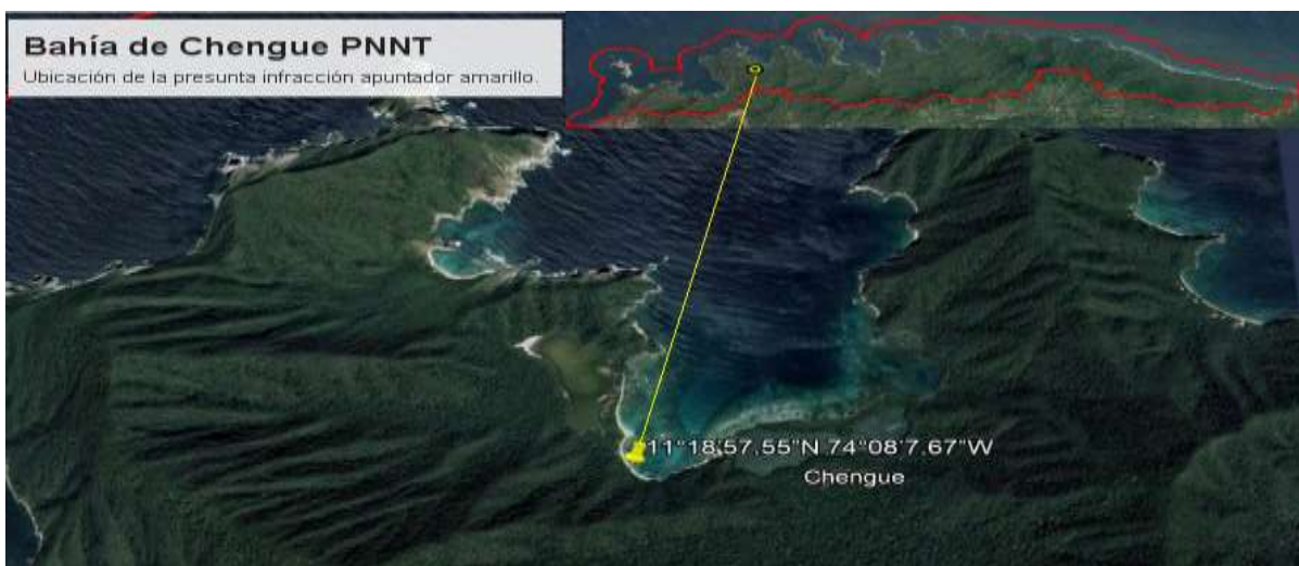
Figura 1. Ubicación de la Bahía de Chengue al interior del PNNT, lugar donde presuntamente se dio la extracción de arena (punto amarillo)- Expediente. 013/2011 PNNT.. Proyectó Ana María Valderrama.

Chengue es una pequeña bahía (3,3km 2 de superficie) que alberga una gran biodiversidad marina y un número reducido de pobladores permanentes, localizada dentro del Parque Nacional Natural Tayrona a unos 14 km al nororiente de la ciudad de Santa Marta (11°20'N – 74°08'W) (Díaz et al., 2003) 9 . Esta Bahía es reconocida como un lugar de interés arqueológico, debido a que sus playas son sitios de pagamento de las comunidades indígenas habitantes de la Sierra Nevada de Santa Marta, siendo uno de los objetivos de conservación del PNN Tayrona la protección de estos sitios sagrados. Además de esto se encuentran tres lagunas costeras (al oriente al occidente y al sur). La del occidente es llamada madre de la sal Jaba Natunsama ( SENUNULANG, NIWI KA' GUMO -concepto de territorio) - tomado del Plan de manejo 2005-2009 PNNT, puesto que se encuentra en un playón salino, el cual es una pequeña depresión, correspondiente a una laguna de colmatación temporal, caracterizado por abundancia de sales y ausencia de vegetación Plan de manejo 2005-2009 PNNT.