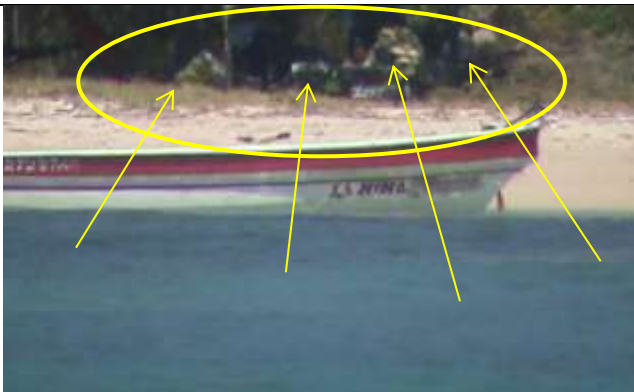
Figura 6. Se observa lo que presuntamente serían los 4 sacos de arena extraída, al parecer de la parte alta de la playa (duna) entre la vegetación.

Mediante concepto técnico del 01 de julio de 2012, la extracción de material biológico por parte de la comunidad y pescadores que frecuentan Chengue, representa uno de los principales problemas ambientales, incidiendo en el deterioro de las comunidades de flora y fauna. La probabilidad de la ocurrencia de los hechos fue determinada como ALTA, debido a que es la Bahía que tiene los ecosistemas en mejor estado de conservación.