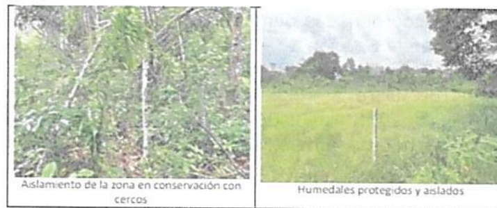
Figura 7. Ecosistemas destacados del predio.

El predio cuenta con 4.3405 Has, en bosque clasificados como bosque secundario heterogéneo de tierra firme.