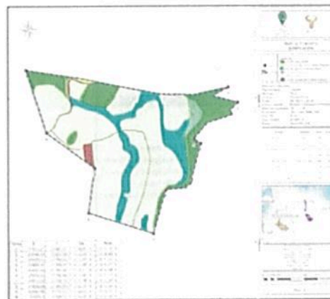
Figura 4. Zonificación Ambiental de predio.