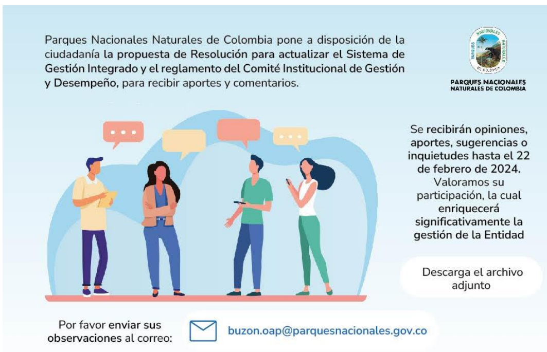
Imagen No.1. Publicación Consulta Pública Banner Noticias.

Fe de erratas: Consulta la propuesta de Resolución por la cual se actualiza el Sistema de Gestión Integrado de Parques Nacionales 2024/PÁGINA WEB/Consulta Ciudadana