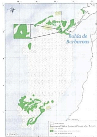
Mapa 2. Ubicación Isla Arena o Corona Island

Por otro lado, el solicitante manifiesta que los demás sitios de filmación se concentraran en la Isla Arena, o Corona Island (Punto de filmación 0) ubicada en las coordenadas 10°08'42"N 75°43'39" W, para lo cual es importante resaltar que las zonas de la isla que no se encuentran bañadas por la línea de más alta marea están fuera de la jurisdicción de Parques Nacionales Naturales de Colombia, esto en concordancia con el concepto 20242400000373 del Grupo de Gestión de la Información y la Innovación de la Subdirección de Gestión y Manejo.