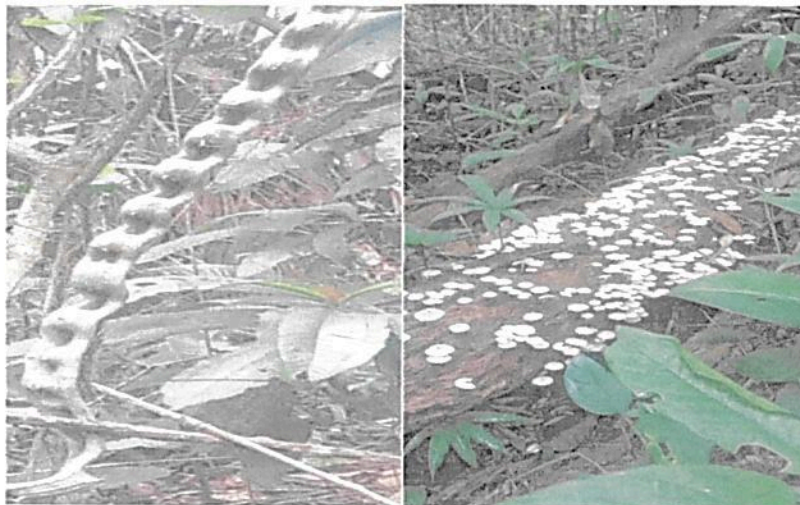
Figura 2. Composición de la flora en el predio "SIN DIRECCION . LA ARGELIA " que conforma la RNSC "LA ARGELIA ".