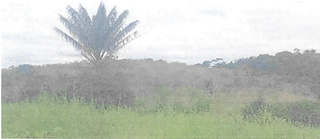
Figura 7. Zona de Agrosistemas del predio denominado "SIN DIRECCION. LA ARGELIA" identificado con FMI No. 420-27560, que conforman la RNSC "LA ARGELIA".

Fuente: Visita técnica PNNC 13 de agosto 2023.