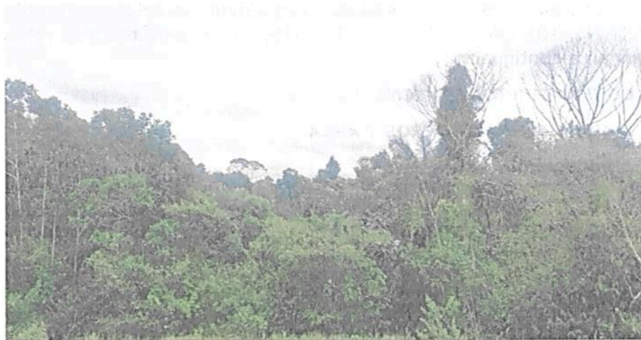
Figura 1. Muestra de ecosistema natural presente en el predio "SIN DIRECCION. LA ARGELIA" que conforma la RNSC "LA ARGELIA".

La Reserva Natural de la Sociedad Civil "LA ARGELIA" que será registrada a favor del predio "SIN DIRECCION. LA ARGELIA" corresponde a Bosque Húmedo Tropical que se encuentra dentro del Zonobioma húmedo tropical para Colombia 1 . Esta zona se caracteriza 2 por presentar un clima cálido muy húmedo, con una precipitación media anual de 3000 - 4000 mm, temperaturas promedio de 24 °C un rango altitudinal entre los 267 y 285 m.s.n.m.