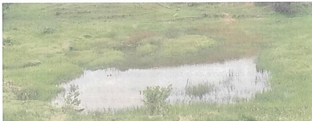
Figura 6. Zona de Amortiguación y Manejo Especial Cuerpos de Agua del predio denominado "SIN DIRECCION. LA ARGELIA" identificado con FMI No. 420-27560, que conforman la RNSC "LA ARGELIA".

Fuente: Visita técnica PNNC 13 de agosto 2023.