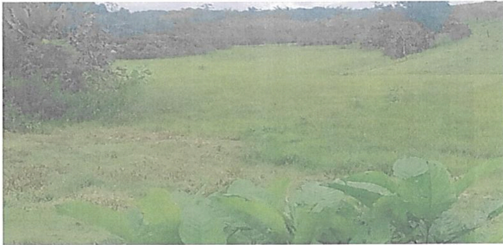
Figura 5. Zona de Amortiguación y Manejo Especial del predio denominado "SIN DIRECCION. LA ARGELIA" identificado con FMI No. 420-27560, que conforman la RNSC "LA ARGELIA".

Fuente: Visita técnica PNNC 13 de agosto 2023.