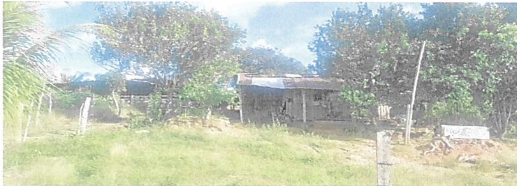
Figura 8. Zona de Uso Intensivo e Infraestructura del predio denominado "SIN DIRECCION. LA ARGELIA" identificado con FMI No. 420-27560, que conforman la RNSC "LA ARGELIA".

Fuente: Visita técnica PNNC 13 de agosto 2023.