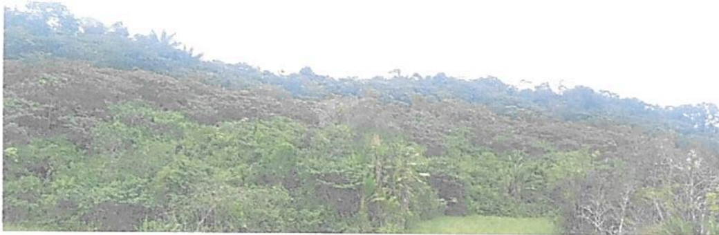
Figura 4. Zona de conservación del predio denominado "SIN DIRECCION . LA ARGELIA " identificado con FMI No. 420-27560 , que conforman la RNSC "LA ARGELIA ".

Esta zona corresponde al 31,1 % del área total a registrar, es decir a 20,3975 ha y está conformada por la muestra de ecosistema natural de Bosque húmedo tropical (BHT), representado por una cobertura de Bosque alto denso heterogéneo y Bosque ripario.