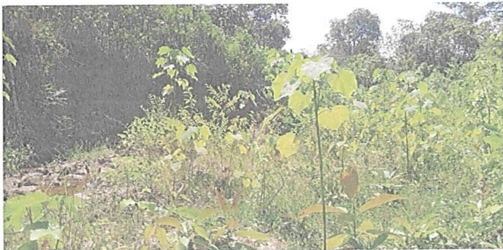
Figura 7. Vista de la Zona de Amortiguación y Manejo Especial en la RNSC "LA PALESTINA"

Esta zona corresponde a 1,1089 ha, equivalentes al 9,28% del área objeto de registro. Corresponde a franjas que separan las zonas de conservación y de restauración de los potreros ubicados al sur de la reserva, los cuales son del mismo propietario. La zona donde se encuentra la reserva en mayo de 2022 se vio afectada por procesos fuertes de deslizamiento de tierra sobre todo en las cuencas de las quebradas, por lo que el suelo y el material vegetal se precipitó hacia las zonas más bajas; en este momento se observan procesos erosivos en algunos lugares y en otros hay depósitos de arenas y gravas de diferentes tamaños, así como rocas; también es posible observar los troncos y raíces de los árboles que fueron removidos en las avalanchas. Sirve como "área de transición entre el paisaje antrópico y las zonas de conservación, o entre aquel y las áreas especiales para la protección como los nacimientos de agua, humedales y cauces. Esta zona puede contener rastrojos o vegetación secundaria y puede estar expuesta a actividades agropecuarias y extractivas sostenibles, de regular intensidad." 7