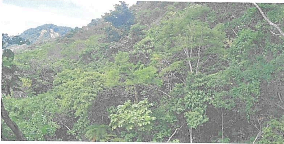
Figura 1. Muestra de ecosistema presente en la RNSC "LA PALESTINA"

naturales y pastos del zonobioma húmedo tropical de la amazonia, presenta un clima cálido muy húmedo, dentro de la unidad geomorfológica de lomerío fluvio-gravitacional 2 . Se encuentran varios cuerpos de agua al interior de la reserva.