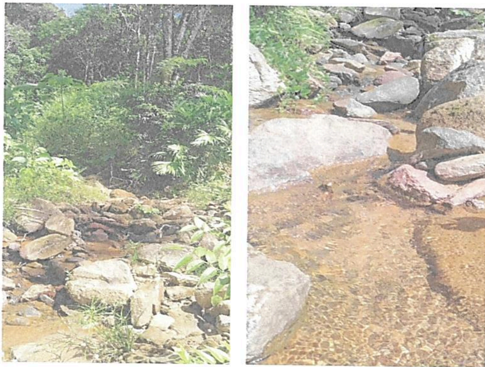
Figura 2. Dos de los cuerpos de agua presentes en la RNSC "LA PALESTINA".