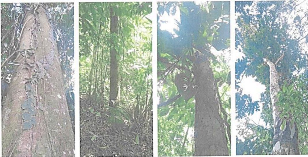
Figura 4. Flora registrada en la Zona de Conservación de la RNSC "LA PALESTINA".