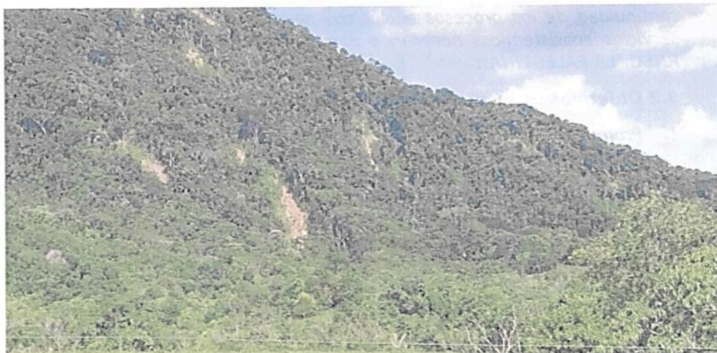
Figura 5. Vista de la Zona de Conservación al sur de la RNSC "LA PALESTINA"

Esta zona corresponde a 5,0124 ha, equivalentes al 41,93% del área objeto de registro. Conformada por cobertura boscosa clasificada como bosque alto denso heterogéneo de tierra firme, con árboles de porte alto e individuos de alrededor de 18 metros de altura. Presenta relictos de bosque húmedo tropical al norte de la reserva, así como bosque de galería asociado a nacedores, ambos en relativo buen estado de conservación. El predio tiene conectividad con bosques en mejor estado de conservación presentes en predios colindantes. "(...) el manejo [en esta área] está dirigido ante todo a evitar su alteración, degradación o transformación por la actividad humana" 5