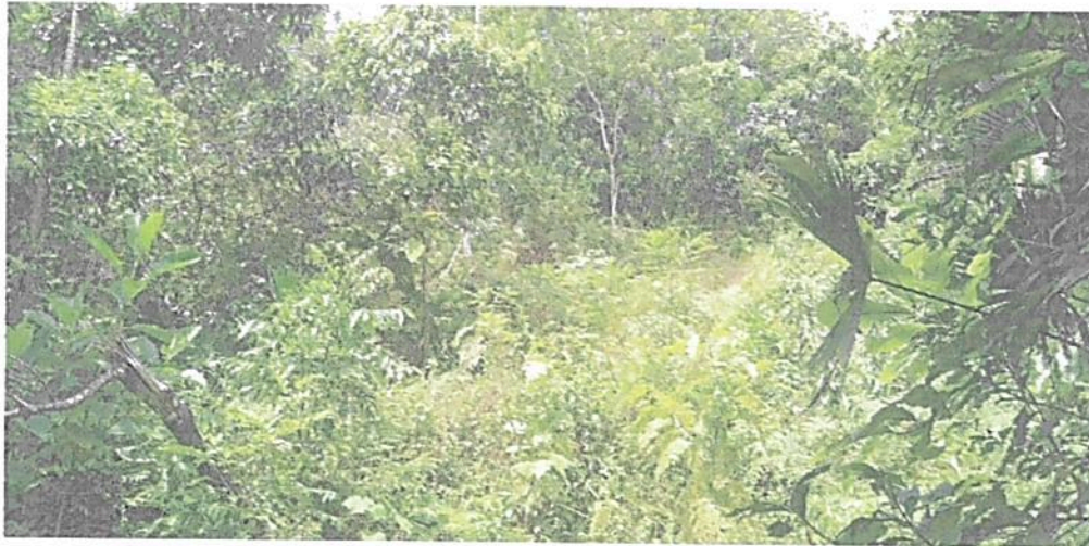
Figura 6. Vistas de la Zona de Restauración al norte de la RNSC "LA PALESTINA"

Esta zona corresponde a 5,8322 ha, equivalentes al 48,79% del área objeto de registro. Corresponde a bosque secundario en diferentes estados de regeneración como resultado del cambio de uso de lo que hace aproximadamente 15 años fueron potreros; los últimos potreros iniciaron su proceso de regeneración hace 10 años. "Es un espacio dirigido al restablecimiento parcial o total a un estado anterior, de la composición, estructura y función de la diversidad biológica. En las zonas de restauración se pueden llevar a cabo procesos inducidos por acciones humanas, encaminados al cumplimiento de los objetivos de conservación del área protegida. Un área protegida puede tener una o más zonas de restauración, las cuales son transitorias hasta que se alcance el estado de conservación deseado y conforme los objetivos de conservación del área, caso en el cual se denominará de acuerdo con la zona que correspondan a la nueva situación. Será el administrador del área protegida quien definirá y pondrá en marcha las acciones necesarias para el mantenimiento de la zona restaurada." 6