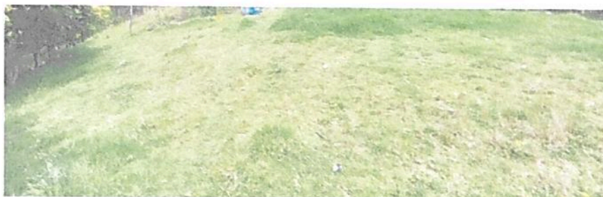
Figura 4. Zona de Amortiguación y Manejo Especial del predio denominado "LOTE SAN BENIGNO" identificado con FMI No. 50N-20342941, que conforman la RNSC "EL RETIRO".