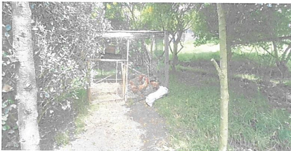
Figura 6. Zona de Agrosistemas del predio denominado "LOTE SAN BENIGNO" identificado con FMI No. 50N-20342941, que conforman la RNSC "EL RETIRO".