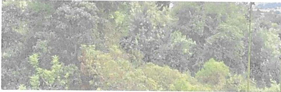
Figura 1. Muestra de ecosistema natural presente en el predio "LOTE SAN BENIGNO" que conforma la RNSC "EL RETIRO".