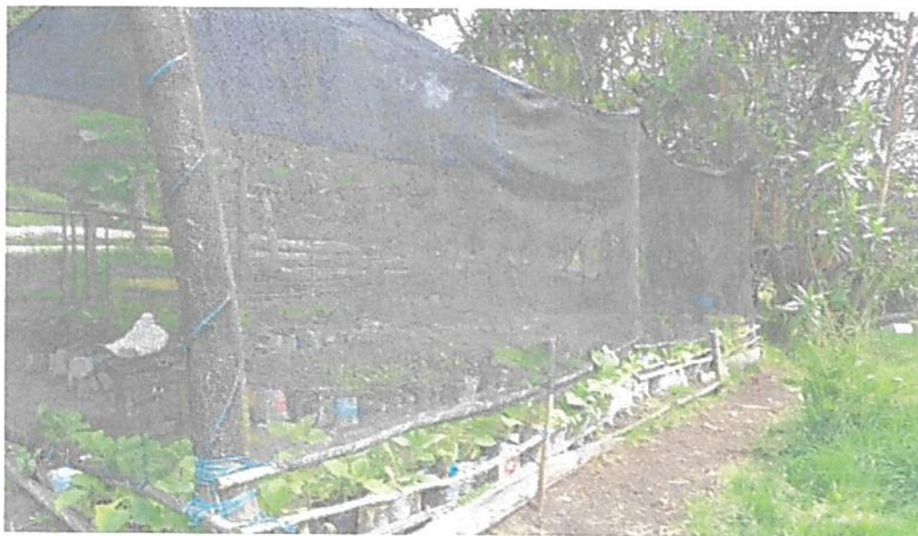
Figura 7. Zona de Uso Intensivo e Infraestructura del predio denominado "LOTE SAN BENIGNO" identificado con FMI No. 50N-20342941, que conforman la RNSC "EL RETIRO".

Esta zona corresponde al 14,3 % del área total a registrar, es decir a 0,0951 ha y está conformada por las infraestructuras de la huerta, el vivero, el galpón y la vivienda donde pernocta la titular del registro, además del camino de paso para la entrada del predio hacia la ubicación de la casa.