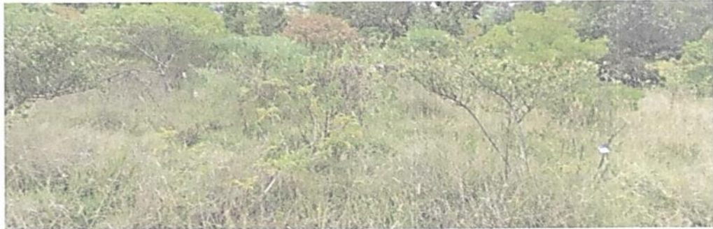
Figura 5. Zona de Restauración del predio denominado "LOTE SAN BENIGNO" identificado con FMI No. 50N-20342941, que conforman la RNSC "EL RETIRO".

Esta zona corresponde al 31 % del área total a registrar, es decir a 0,2075 ha y está conformada por la reforestación que se adelanta en el predio "LOTE SAN BENIGNO" por parte de la titular del registro donde han venido sembrando especies nativas, con mosaicos de restauración pasiva y activa dentro del predio.