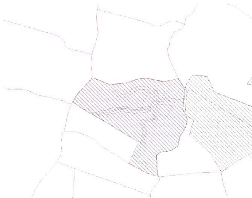
Figura 2. Verificación del polígono de la RNSC ELDIAMANTE con la capa catastral del IGAC (2023)

Así mismo, esta información se verificó con la capa catastral del IGAC (2023) para el municipio de San Juan Nepomuceno, la cual se traslapa con predios vecinos. (Figura 2)