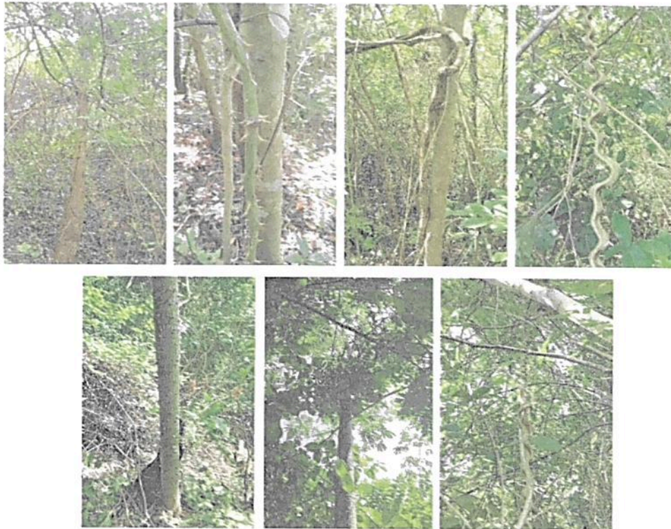
Figura 7. Flora presente en la Reserva Natural de la Sociedad Civil "EL DIAMANTE"

Conforme con la información suministrada por el acompañante del recorrido y lo observado en la visita técnica realizada a la RNSC EL DIAMANTE" las siguientes especies de flora son las más representativas para la reserva; (Hura crepitans) Ceiba, (Anacardium excelsum) caracolí, (Aspidosterma polyneuron) carreto, (Gustavia superva) membrillo, (Artocarpus altilis) fruta de pan, (Sterculia apetala) piñon, (Lecythis minor) coco de mono, (Bursera simaruba) resbalamonos, (Samanea saman) saman, (Crecopia peltata) guarumo, entre otras.