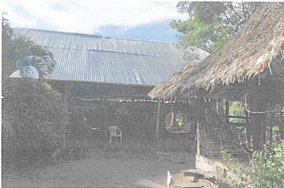
Figura 15. Zona de Uso Intensivo e Infraestructura de la RNSC "EL DIAMANTE"

Esta zona cuenta con 0,6329 Ha que corresponden al 2,25% de la reserva y está conformada por la vivienda principal, los corrales y la vía de acceso a los mismos.