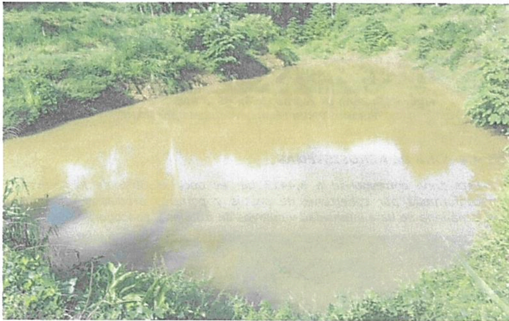
Figura 12. Zona de Amortiguación y Manejo especial de la RNSC "EL DIAMANTE"

Así mismo, se incluye un cuerpo de agua que se localiza en la parte central de la reserva, y es utilizado como reservorio para el suministro de agua durante la época de sequía, y la ronda hídrica de dos quebradas localizadas en el costado sur de la reserva. Estas extensiones de agua cubren 0,0459 ha que corresponden al 0,16% de la reserva.