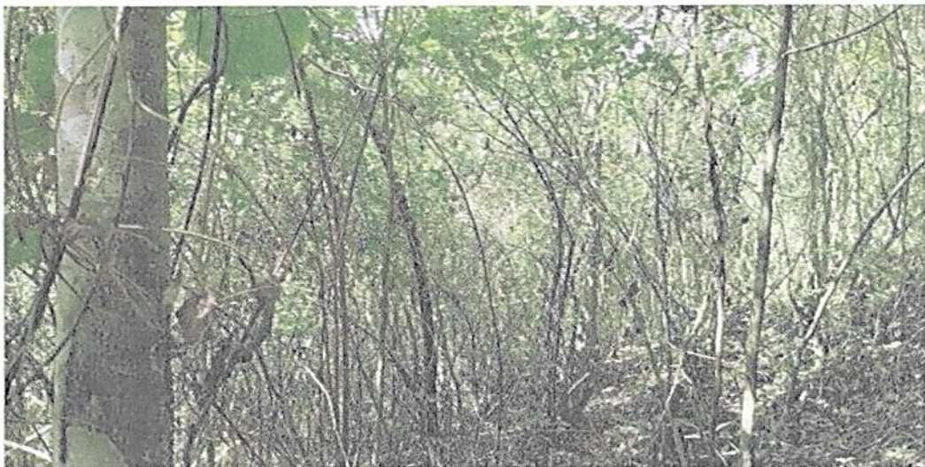
Figura 6. Bosque seco tropical en su interior presente en la RNSC "EL DIAMANTE"