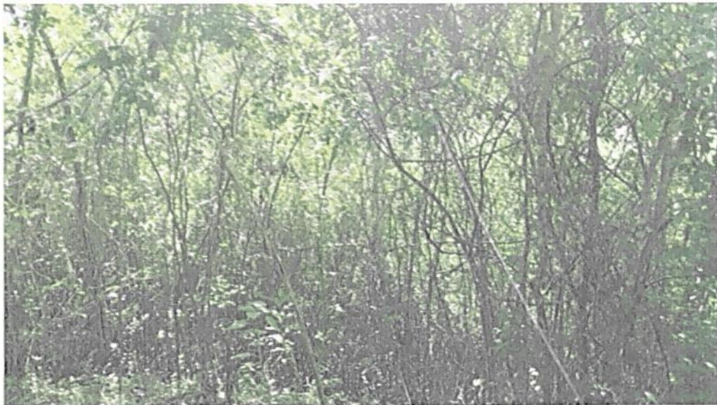
Figura 10. Zona de Conservación de la RNSC "EL DIAMANTE"

Esta zona corresponde a 16,4816 ha, es decir el 58,57% de la reserva. Donde se encuentra la muestra de ecosistema natural de Bosque seco Tropical caducifolio (Bs-T). El cual cuenta con una cobertura de bosque denso y bosque de galería. Esta área se encuentra destinada para su conservación.