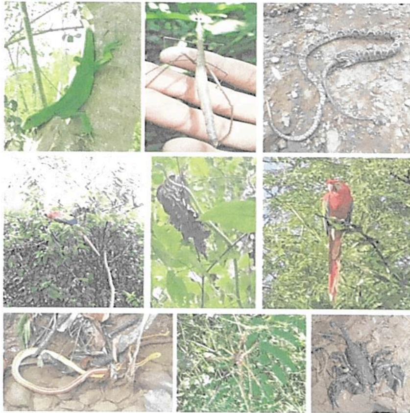
Figura 8. Fauna representativa de la Reserva Natural de la Sociedad Civil “EL DIAMANTE” y avistada en algunas RNSC locales de la zona de influencia durante los recorridos realizados en el marco del seguimiento.

norte de Bolívar y los Montes de María con las especies Dendrophidion percarinatum y Xenodon rabdocephalus