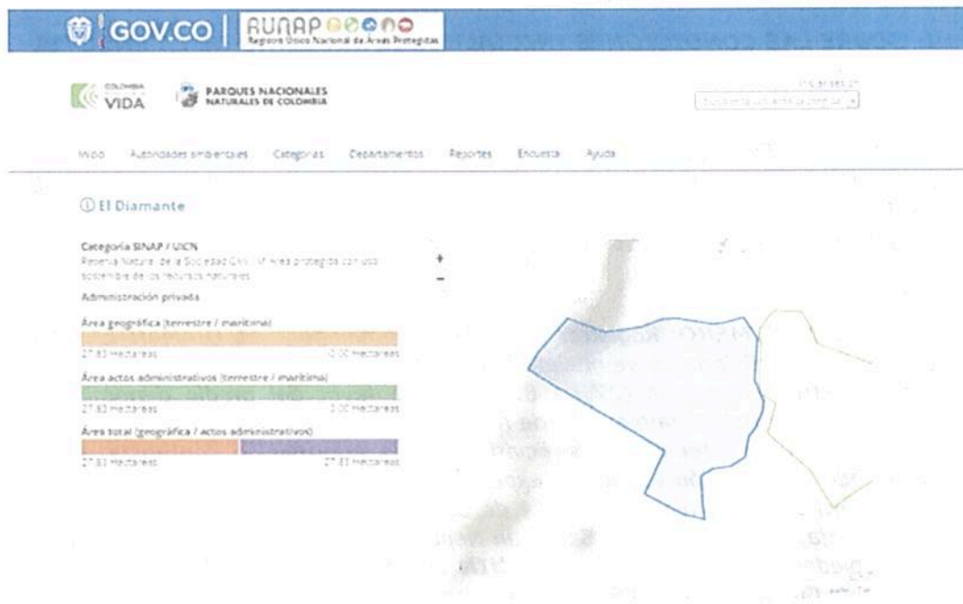
Figura 1 Reserva Natural de la Sociedad Civil "EL DIAMANTE" en el Registro Único Nacional de Áreas Protegidas – RUNAP.

Esta información puede consultarse en el enlace: https://runap.parquesnacionales.gov.co/area-protegida/1524