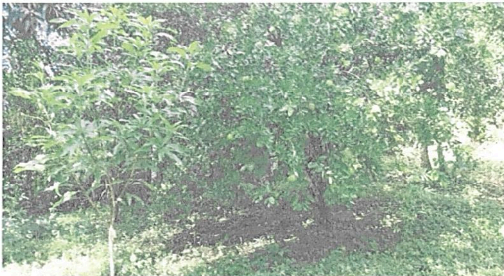
Figura 14. Zona de agrosistemas de la RNSC "EL DIAMANTE"

Esta zona corresponde a 8,4417 ha, es decir el 30% de la reserva. Está conformada por coberturas de pastos y potreros arbolados utilizadas para ganadería de baja intensidad y cultivos de frutales y pançoger.