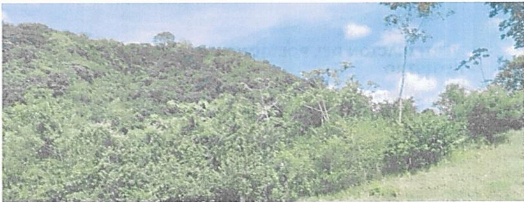
Figura 5. Muestra de ecosistema natural de Bosque seco Tropical presente en la RNSC "EL DIAMANTE"

De acuerdo con el recorrido realizado durante la visita técnica a la Reserva Natural de la Sociedad Civil "EL DIAMANTE", presenta un bosque secundario con una muestra representativa de un ecosistema natural de Bosque seco Tropical caducifolio (Bs-T), representado por una cobertura de bosque denso de tierra firme y bosque de galería. Presenta una estratificación definida, con un dosel cerrado y continuo, constituido por especies arbóreas con alturas superiores a los 15 metros, sobre el sotobosque se encuentran especies arbustivas y arbóreas en diferentes estados sucesionales y sobre su estrato más bajo predomina la vegetación herbácea y hojarasca.