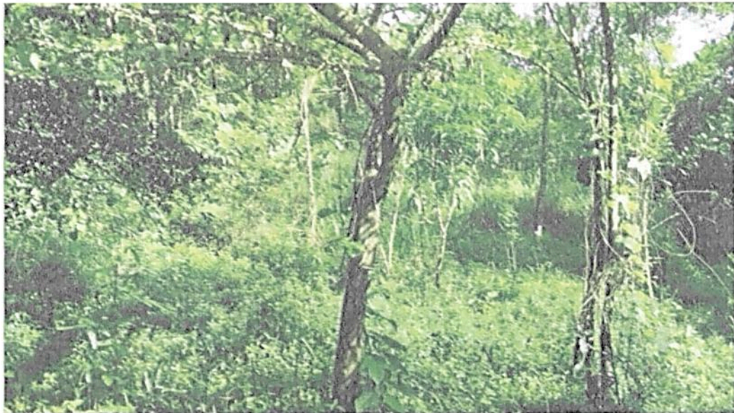
Figura 13. Zona de restauración de la RNSC "EL DIAMANTE"

"POR MEDIO DE LA CUAL SE MODIFICA LA RESOLUCIÓN No.151 DEL 24 DE SEPTIEMBRE DE 2019 POR MEDIO DE LA CUAL SE REGISTRA LA RESERVA NATURAL DE LA SOCIEDAD CIVIL RNSC 145-18 "EL DIAMANTE" Y SE TOMAN OTRAS DISPOSICIONES