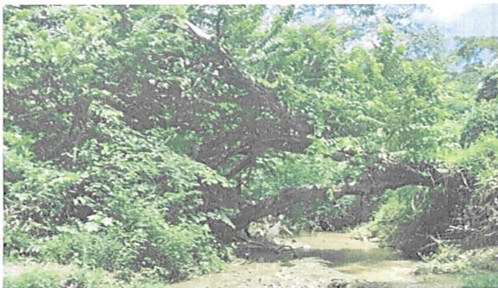
Figura 11. Zona de Conservación- Bosque de galería de la RNSC "EL DIAMANTE"