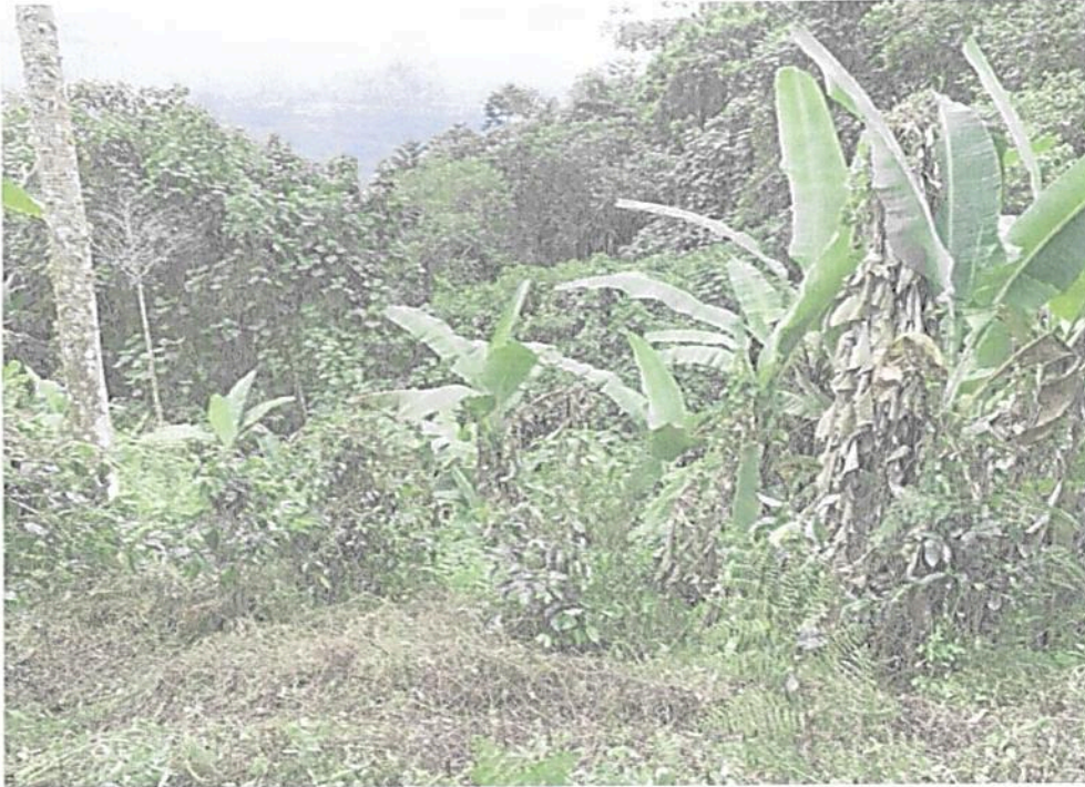
Figura 6. Vista de la Zona de Restauración de la RNSC "LOS LAURELES"

"POR MEDIO DE LA CUAL SE MODIFICA LA RESOLUCIÓN No.025 DEL 31 DE JULIO DE 2012 POR MEDIO DE LA CUAL SE REGISTRA LA RESERVA NATURAL DE LA SOCIEDAD CIVIL "LOS LAURELES" Y SE TOMAN OTRAS DISPOSICIONES