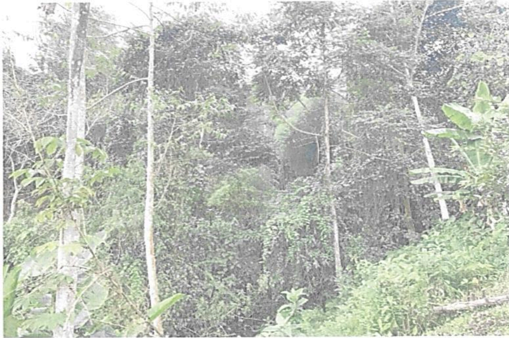
Figura 3. Vistas de la Zona de Conservación de la RNSC "LOS LAURELES".

La RNSC LOS LAURELES se encuentra conectada en su parte más alta con otros predios en mejor estado de conservación por lo que la muestra de bosque de la reserva favorece la oferta de bienes y servicios ecosistémicos importantes para la región como son: regulación de ciclos hidrológicos, regulación, protección de especies con algún grado de amenaza o endemismo, entre otros.