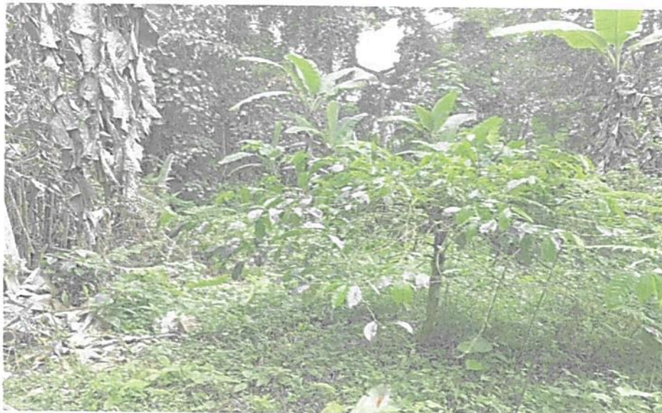
Figura 8. Zona de Agrosistemas de la RNSC "LOS LAURELES".

Esta zona corresponde a 1,7842 ha del área de actualización del registro, es decir, 51,2%. Ubicada entre los 1600 y los 1660 msnm está conformada principalmente por cultivos de plátano y de café orgánico, de este último se producen tres tipos diferentes (clásico, gourmet y premium) dentro de la marca El Tinamú. Se encuentra distribuida hacia la parte baja de la casa y arriba y al sur del invernadero.