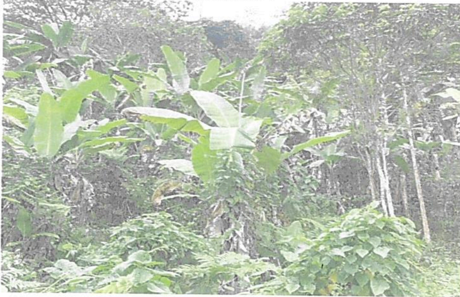
Figura 7. Zona de Amortiguación y Manejo Especial de la RNSC "LOS LAURELES".

"POR MEDIO DE LA CUAL SE MODIFICA LA RESOLUCIÓN No.025 DEL 31 DE JULIO DE 2012 POR MEDIO DE LA CUAL SE REGISTRA LA RESERVA NATURAL DE LA SOCIEDAD CIVIL "LOS LAURELES" Y SE TOMAN OTRAS DISPOSICIONES