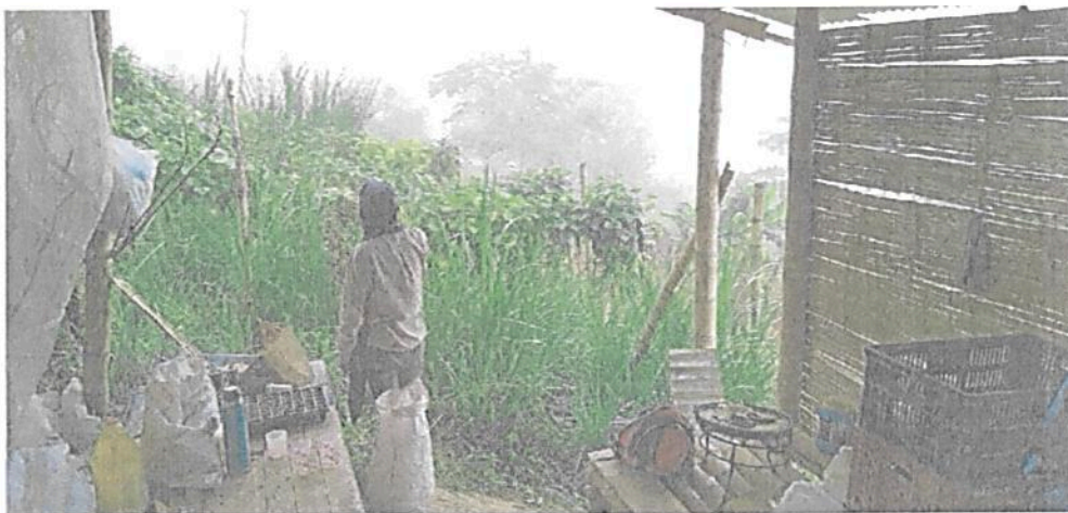
Figura 9. Zona de Uso Intensivo e Infraestructura de la RNSC "LOS LAURELES" (invernadero, casa y beneficiadero).

Esta zona corresponde a 0,0683 ha del área de actualización del registro, es decir, 2,0 %. Ubicada entre los 1616 y los 1627 msnm. Es la zona por la que se accede a la reserva y está conformada por la vivienda, el beneficiadero y el invernadero.