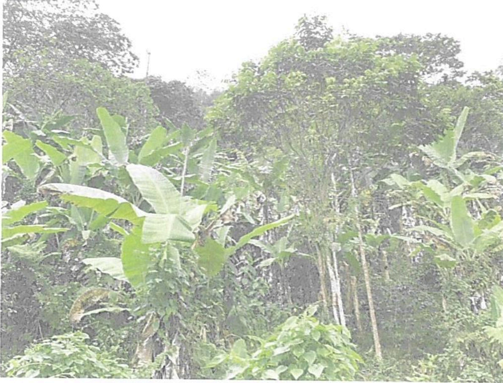
Figura 5. Vista hacia arriba de la Zona de Conservación de la RNSC "LOS LAURELES" con el yarumo del centro como límite oriental.