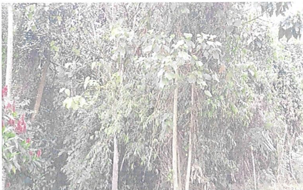
Figura 4. Visita de la Zona de Conservación de la RNSC "LOS LAURELES" en la parte baja sobre la vía de acceso