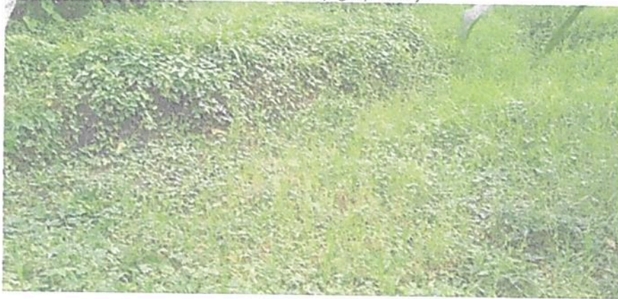
Figura 8. Zona de Uso Intensivo e Infraestructura en la RNSC "LA FLORESTA" (lago artificial, casa y galpones).

POR MEDIO DE LA CUAL SE MODIFICA LA RESOLUCIÓN NO. 110 DEL 03 DE OCTUBRE DE 2014 "POR MEDIO DE LA CUAL SE REGISTRA LA RESERVA NATURAL DE LA SOCIEDAD CIVIL "LA FLORESTA" RNSC 014-11