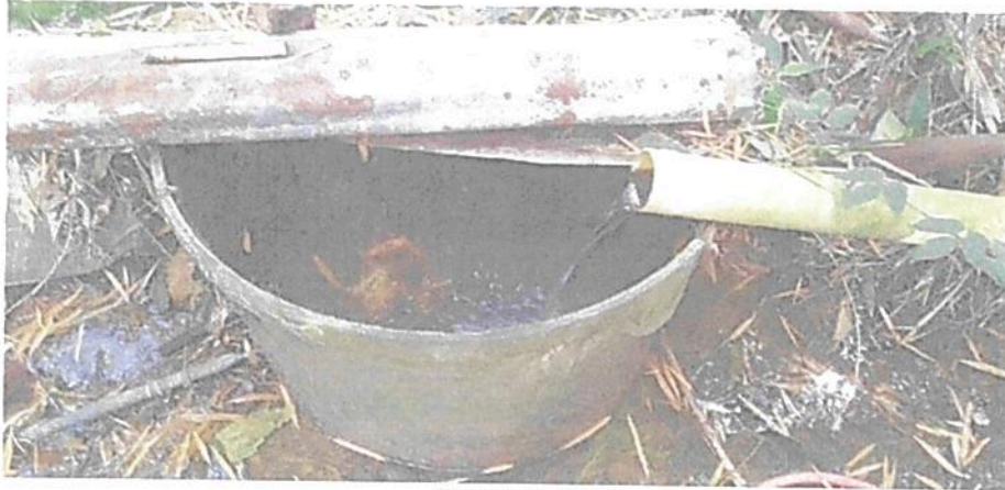
Figura 5. Toma de agua ubicada aguas abajo del nacedero en la RNSC "LA FLORESTA"