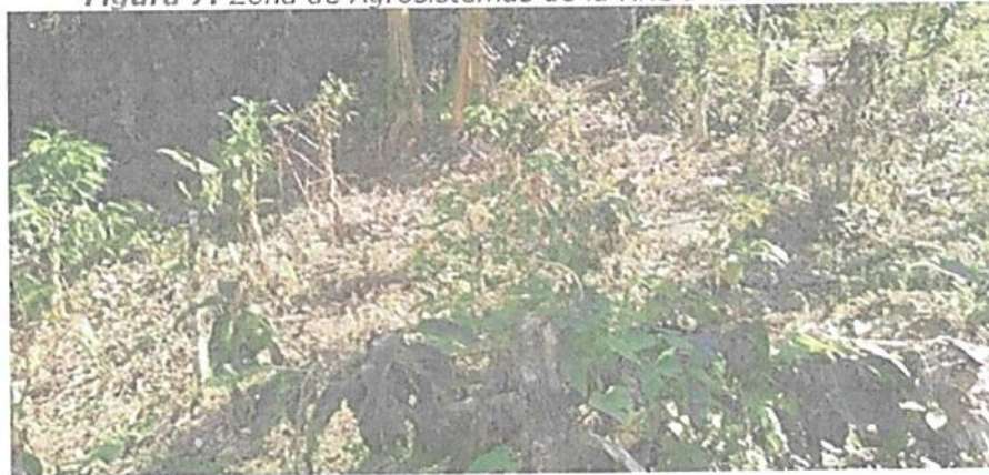
Figura 7. Zona de Agrosistemas de la RNSC "LA FLORESTA"

Esta zona corresponde a 1,4179 ha del área de actualización del registro, es decir, 44,37% y está conformada principalmente por cultivos de plátano y café.