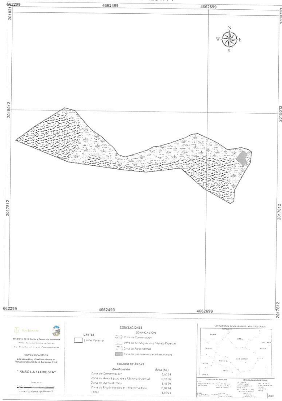
Figura 2. Nueva zonificación para el registro de la Reserva Natural de la Sociedad Civil "LA FLORESTA".