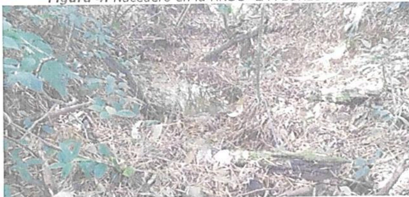
Figura 4. Nacedero en la RNSC "LA FLORESTA"