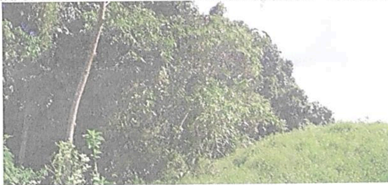
Figura 3. Vista de la Zona de Conservación de la RNSC "LA FLORESTA".

La RNSC posee buena conectividad con predios vecinos del municipio en mejor estado de conservación, por lo que favorece la oferta de bienes y servicios ecosistémicos importantes para la región como son: regulación de ciclos hidrológicos, regulación, protección de especies con algún grado de amenaza o endemismo, oferta de paisajes para la observación de estrellas y avistamiento de aves entre otros. "(...) el manejo [en esta área] está dirigido ante todo a evitar su alteración, degradación o transformación por la actividad humana" 9