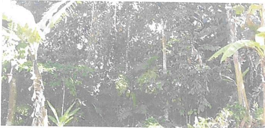
Figura 6. Zona de Amortiguación y Manejo Especial en la parte baja de la RNSC "LA FLORESTA"

Esta zona corresponde a 0,1186 ha del área de actualización del registro, es decir, 3,71% y está conformada por áreas más abiertas con presencia de árboles y otra vegetación arbustiva en estado de regeneración, bordea el bosque y los cultivos de plátano y café. Se observan especies pioneras de crecimiento relativamente rápido como el helecho marranero; también hay presencia de arbustos y árboles nativos de porte mediano. Vale la pena mencionar que se detectó la presencia de ganado vacuno y caballo en toda el área de la reserva, por lo que se recomienda evitar el ingreso de animales domésticos al interior de las zonas de conservación si se quiere dar continuidad a la restauración no asistida que ha venido ocurriendo dentro de la reserva. Sirve como "área de transición entre el paisaje antrópico y las zonas de conservación, o entre aquel y las áreas especiales para la protección como los nacimientos de agua, humedales y cauces. Esta zona puede contener rastrojos o vegetación secundaria y puede estar expuesta a actividades agropecuarias y extractivas sostenibles, de regular intensidad" 10