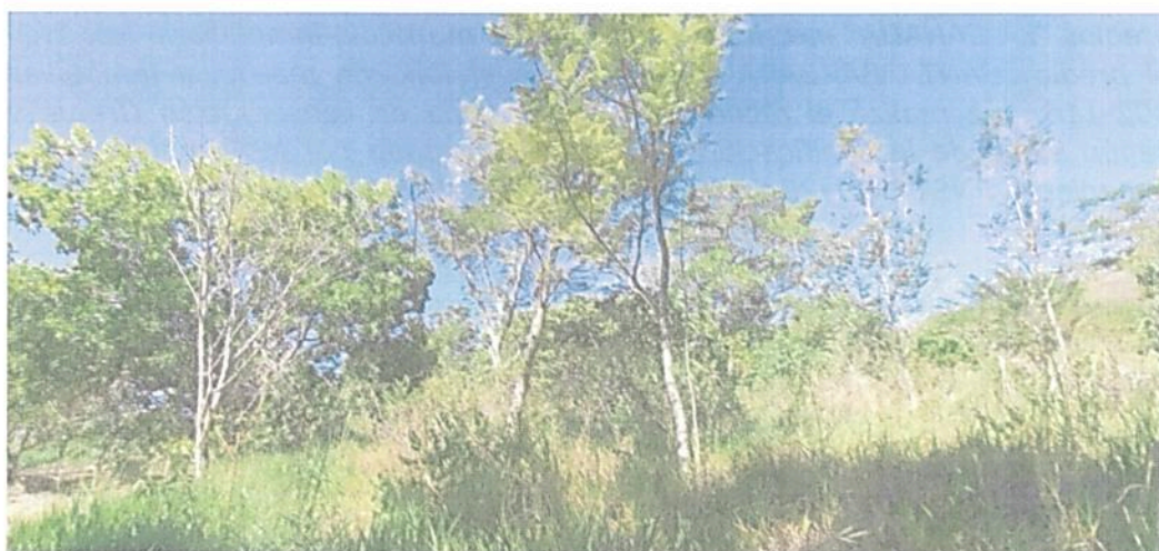
Figura 3. Predio "LA CAÑADA", identificado con FMI 302-766, en el cuales no se evidenció presencia de muestra de ecosistema natural de acuerdo con lo relacionado en el artículo 2.2.2.1.17.1 del Decreto 1076 de 2015.

De acuerdo con el recorrido realizado y lo observado durante la visita técnica, para el predio "LA CAÑADA" inscrito bajo el folio de matrícula inmobiliaria No. 302-766 el área objeto de verificación está conformada por un área con presencia de potrero enrastrado y pastizales en la mayor parte del predio, en la parte sur se logra evidenciar una cerca viva con árboles de especies nativas. Vale la pena mencionar que estas zonas se encuentran en un estado de restauración pasiva según lo mencionado por los encargados del predio, además de una zona donde adelantan procesos de agricultura Sintrópica.