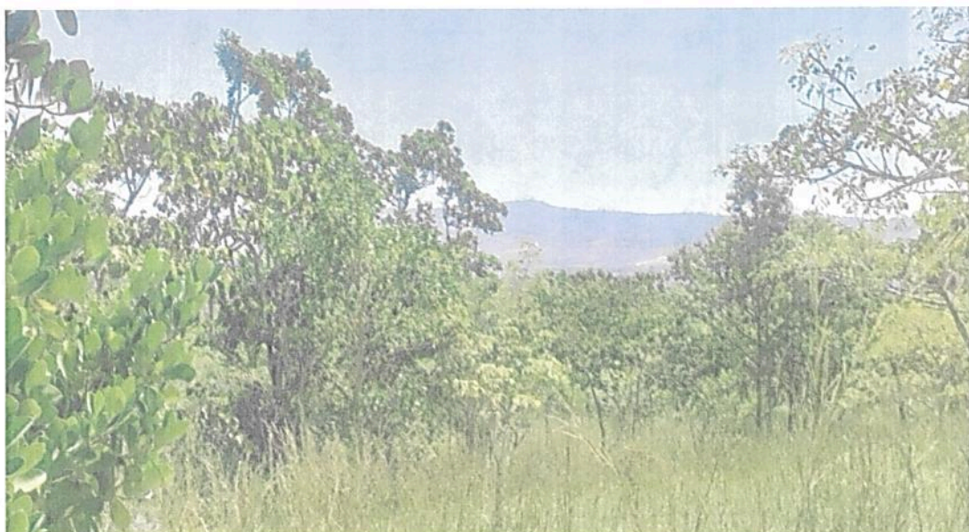
Figura 4. Predio "SANTA BARBARA", identificado con FMI 302-1165, en el cuales no se evidenció presencia de muestra de ecosistema natural de acuerdo con lo relacionado en el artículo 2.2.2.1.17.1 del Decreto 1076 de 2015.

Ahora bien, de acuerdo con el recorrido realizado y lo observado durante la visita técnica, para el predio "SANTA BARBARA" inscrito bajo el folio de matrícula inmobiliaria No. 302-1165 el área objeto de verificación está conformada por áreas con presencia de pastizales, pajonales, con árboles de especies nativas dispersas como Caracolí, Anaco, Guayacán, Nauno, Yarumo Cucharo, además de especies arbóreas dispersas. Vale la pena mencionar que en predio se viene llevando a cabo la siembra de especies nativas en cobertura dominada por pastos esta zona se encuentra en un estado de restauración activa dispersa adelantada por los propietarios, el predio cuenta con un buen avance en el proceso de restauración.