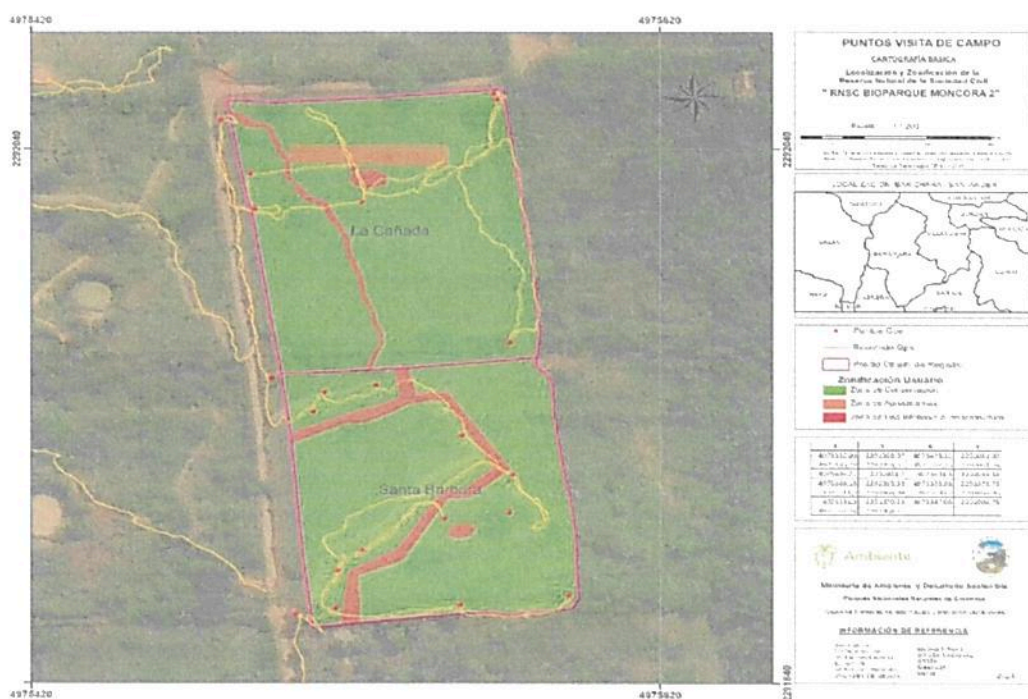
Figura 1. Área del polígono del predio predios "LA CAÑADA" inscrito bajo el folio de matrícula inmobiliaria No. 302-766 y el predio "SANTA BARBARA" inscrito bajo el folio de matrícula inmobiliaria No. 302-1165, según levantamiento topográfico, frente al recorrido realizado durante la visita técnica y puntos georreferenciados tomados en terreno.

De acuerdo con la verificación de la información cartográfica, realizada por el Grupo de Trámites y Evaluación Ambiental GTEA, se evidencio que la información es coincidente frente a los límites verificados en terreno. (Figura 1).