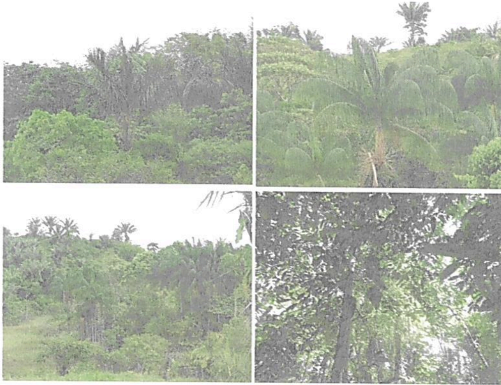
Figura 2. Flora presente en el predio "Sin dirección. EL SINÚ"

"POR MEDIO DE LA CUAL SE REGISTRA LA RESERVA NATURAL DE LA SOCIEDAD CIVIL "EL SINÚ" RNSC 096-23