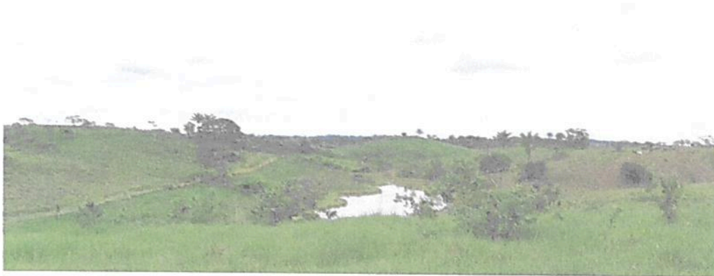
Figura 5. Zona de Amortiguación y Manejo Especial de la RNSC "EL SINÚ"

Así mismo, está conformado por humedales propios de piedemonte amazónico, con una extensión de 9,9205 ha que corresponden al 15,82 % del área total a registrar. Esta zona está destinada para su recuperación natural.