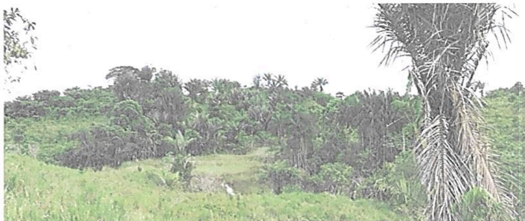
Figura 1. Muestra de ecosistema natural presente en el predio "Sin dirección. EL SINU"

El bosque presenta una vegetación espesa con algunas especies arbóreas que superan los 25 metros, su dosel es discontinuo, en algunas zonas un poco abierto. Sobre la parte media y baja es dominado por algunas especies arbustivas densas.