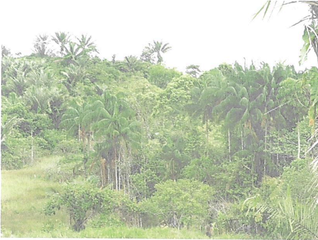
Figura 4. Zona de Conservación de la RNSC "EL SINÚ" Complejo humedal permanentemente inundado Fuente: Visita técnica realizada por PNNC

"POR MEDIO DE LA CUAL SE REGISTRA LA RESERVA NATURAL DE LA SOCIEDAD CIVIL "EL SINÚ" RNSC 096-23