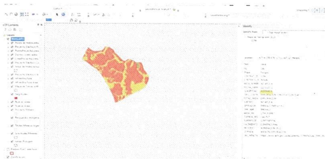
Figura 7. Traslape del predio "Sin dirección. El Sinú" inscrito bajo FMI 420-52702 con área de exploración y producción contrato 0296 a cargo de EMERALD ENERGY PLC

De acuerdo con la verificación cartográfica realizada por el Grupo de Trámites y Evaluación Ambiental GTEA, el predio "Sin dirección. El Sinú" inscrito bajo el folio de matrícula inmobiliaria No. 420-52702 presenta traslape con área de exploración y producción contrato 0296 a cargo de EMERALD ENERGY PLC, el cual se encuentra en estado de exploración de acuerdo con lo consultado en la capa de la Agencia Nacional de hidrocarburos (ANH) Figura 7