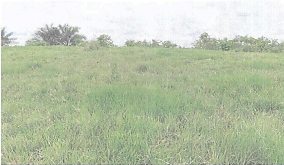
Figura 6. Zona de Agrosistemas de la RNSC "EL SINU"

La zona de Agrosistemas para el predio "Sin Dirección. El Sinu" cuenta con 48,6714 ha, que corresponden al 77,64 % del área total a registrar. Está conformada por coberturas de pastos africanos tipo Brachiaria , adaptados a las condiciones edafoclimáticas de la zona. Esta cobertura es densa y homogénea en todo el paisaje, en ella encontramos las especies Brachiaria decumbens , Brachiaria humidicola , Brachiaria brizantha Error! Marcador no definido. Esta zona se encuentran destinada para producción ganadera bajo un modelo sostenible.