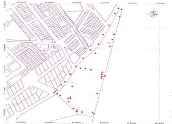
Figura 1. Puntos georreferenciados (en color rojo) y track realizado (en línea punteada) durante la visita técnica efectuada por el GTEA al predio "Urbano LT"