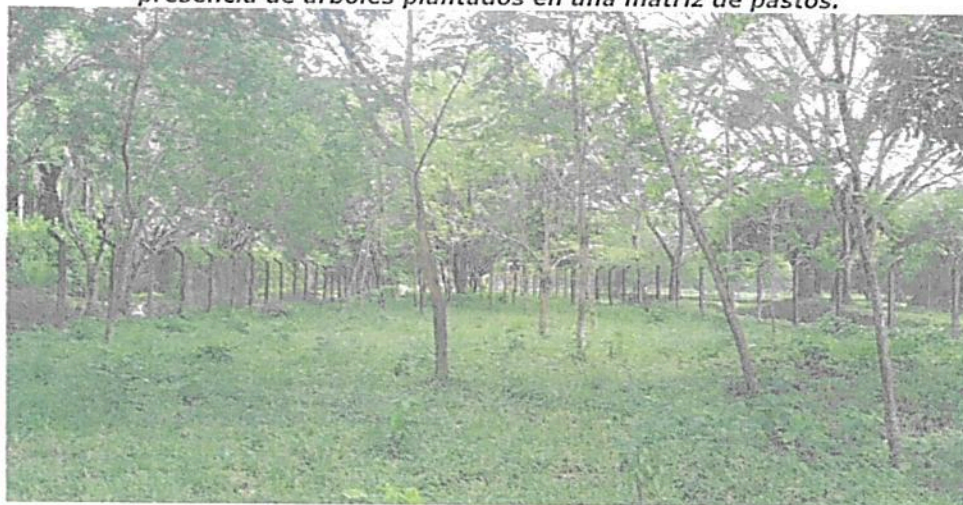
Figura 3. Vistas de la zona de conservación propuesta por el usuario con presencia de árboles plantados en una matriz de pastos.