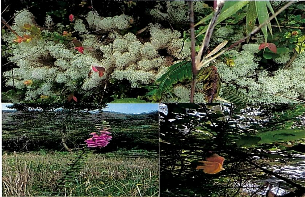
Figura 2. Composición de la flora en los predios denominados "FINCA LA FRONTERA", inscrito bajo el folio de matrícula inmobiliaria No. 152-20652 y "SIN DIRECCION. EL MANANTIAL", inscrito bajo el folio de matrícula inmobiliaria No. 152-52453, que conforma la RNSC "TEJANU".