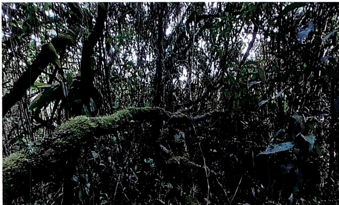
Figura 1. Muestra de ecosistema natural presente en los predios denominados "FINCA LA FRONTERA", inscrito bajo el folio de matrícula inmobiliaria No. 152-20652 y "SIN DIRECCION. EL MANANTIAL", inscrito bajo el folio de matrícula inmobiliaria No. 152-52453, que conforma la RNSC "TEJANU".

La Reserva Natural de la Sociedad Civil "TEJANU" que será registrada a favor de los predios denominados "FINCA LA FRONTERA", inscrito bajo el folio de matrícula inmobiliaria No. 152-20652 y "SIN DIRECCION. EL MANANTIAL", corresponde a Bosque Húmedo Montano (bh-M) en buen estado de conservación. Con topografía montañosa y escarpada en regeneración natural acompañado por un sotobosque denso, manteniendo diferentes estratos. Albergando mucha humedad y bajas temperaturas.