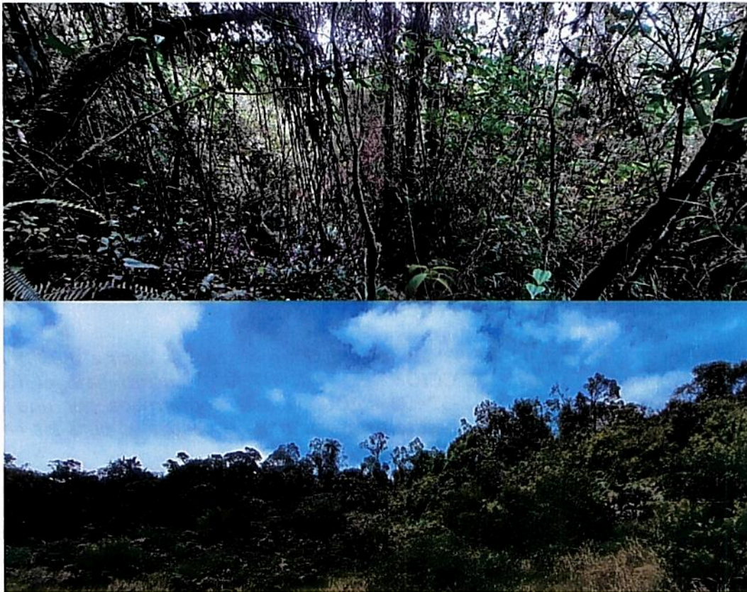
Figura 4. Zona de conservación en los predios denominados "FINCA LA FRONTERA", inscrito bajo el folio de matrícula inmobiliaria No. 152-20652 y "SIN DIRECCION. EL MANANTIAL", inscrito bajo el folio de matrícula inmobiliaria No. 152-52453, que conforma la RNSC "TEJANU".

Esta zona corresponde al 81,93 % del área total a registrar, es decir a 14,9406 ha de los predios denominados "FINCA LA FRONTERA", inscrito bajo el folio de matrícula inmobiliaria No. 152-20652 con un área de 3,3597 ha y "SIN DIRECCION. EL MANANTIAL", inscrito bajo el folio de matrícula inmobiliaria No. 152-52453 con un área de 11,5809 ha y está conformada por Bosque Húmedo Montano (bh-M) en buen estado de conservación, con presencia de algunas especies nativas y procesos de regeneración natural.