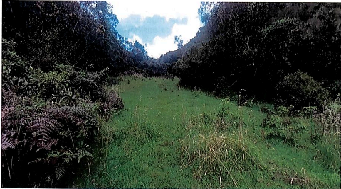
Figura 5. Zona de Amortiguación y Manejo Especial en los predios denominados "FINCA LA FRONTERA", inscrito bajo el folio de matrícula inmobiliaria No. 152-20652 y "SIN DIRECCION. EL MANANTIAL", inscrito bajo el folio de matrícula inmobiliaria No. 152-52453, que conforma la RNSC "TEJANU".