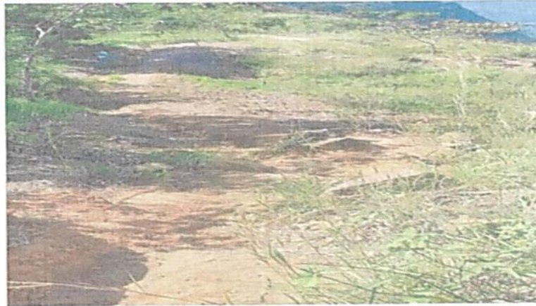
Figura 8. Zona de Uso Intensivo e Infraestructura senderos del predio denominado "SIN INFORMACIÓN" identificado con FMI No. 302-616 que conforman la RNSC "BIOPARQUE MONCORA 3".