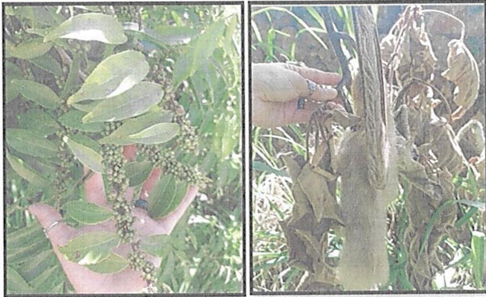
Figura 2. Composición de la flora en el predio "SIN INFORMACIÓN" que conforma la RNSC "BIOPARQUE MONCORA 3".