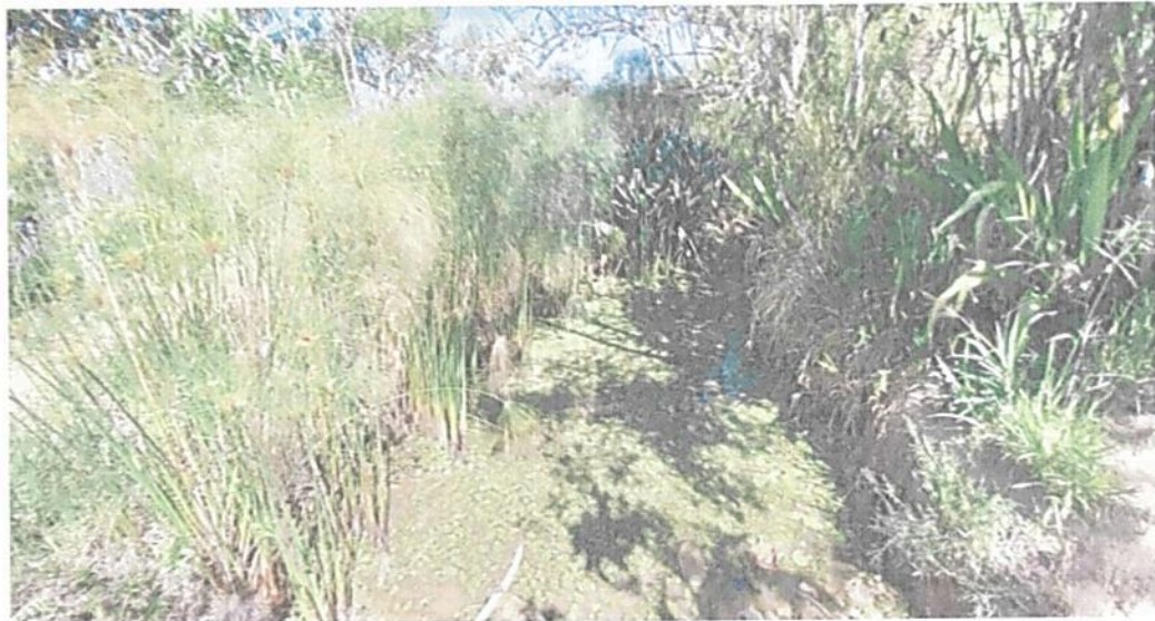
Figura 6. Zona de Amortiguación y Manejo Especial Cuerpo de Agua del predio denominado "SIN INFORMACIÓN" identificado con FMI No. 302-616, que conforman la RNSC "BIOPARQUE MONCORA 3".