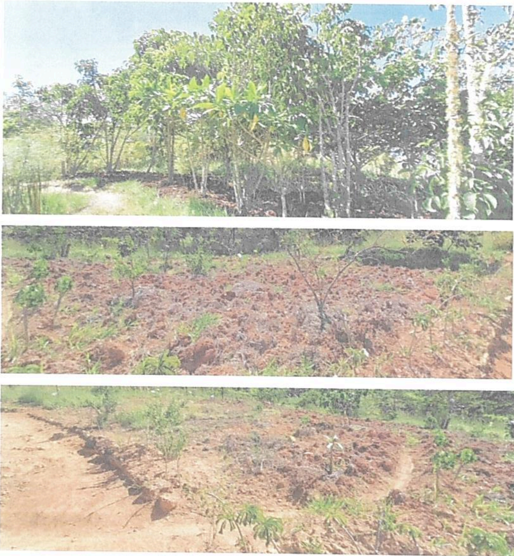
Figura 7. Zona de Agrosistemas del predio denominado "SIN INFORMACIÓN" identificado con FMI No. 302-616, que conforman la RNSC "BIOPARQUE MONCORA 3".