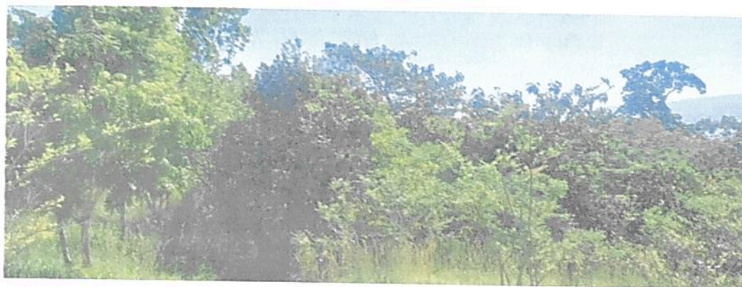
Figura 1. Muestra de ecosistema natural presente en el predio "SIN INFORMACIÓN" que conforma la RNSC "BIOPARQUE MONCORA 3".

La Reserva Natural de la Sociedad Civil "BIOPARQUE MONCORA 3" que será registrada a favor del predio "SIN INFORMACIÓN" corresponde a Bosque Seco Tropical (Bs-T) en proceso de restauración que se encuentra conformado por vegetación secundaria, pastos enmalezados y suelo desnudo o con escasa vegetación rasante y bosque ripario.