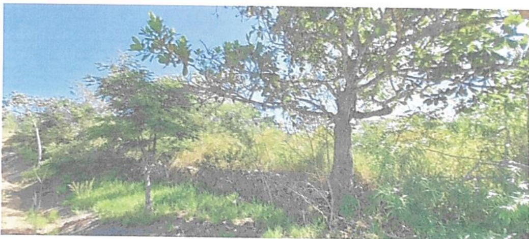
Figura 5. Zona de Amortiguación y Manejo Especial del predio denominado "SIN INFORMACIÓN" identificado con FMI No. 302-616, que conforman la RNSC "BIOPARQUE MONCORA 3".

Cuenta con 0,0066 ha, que corresponden al 1,0 % del área total a registrar. Está conformada por el área de transición entre el paisaje antrópico y la zona de conservación. La cual se encuentra destinada para su recuperación natural, además de la transición entre la zona de uso intensivo e infraestructura y la zona de restauración teniendo en cuenta, que el paso de las personas es frecuente. Adicionalmente, se incluyó un área que se localiza en la parte sur del predio, este lugar contiene un humedal y alrededor presenta cobertura vegetal secundaria y restauración activa.