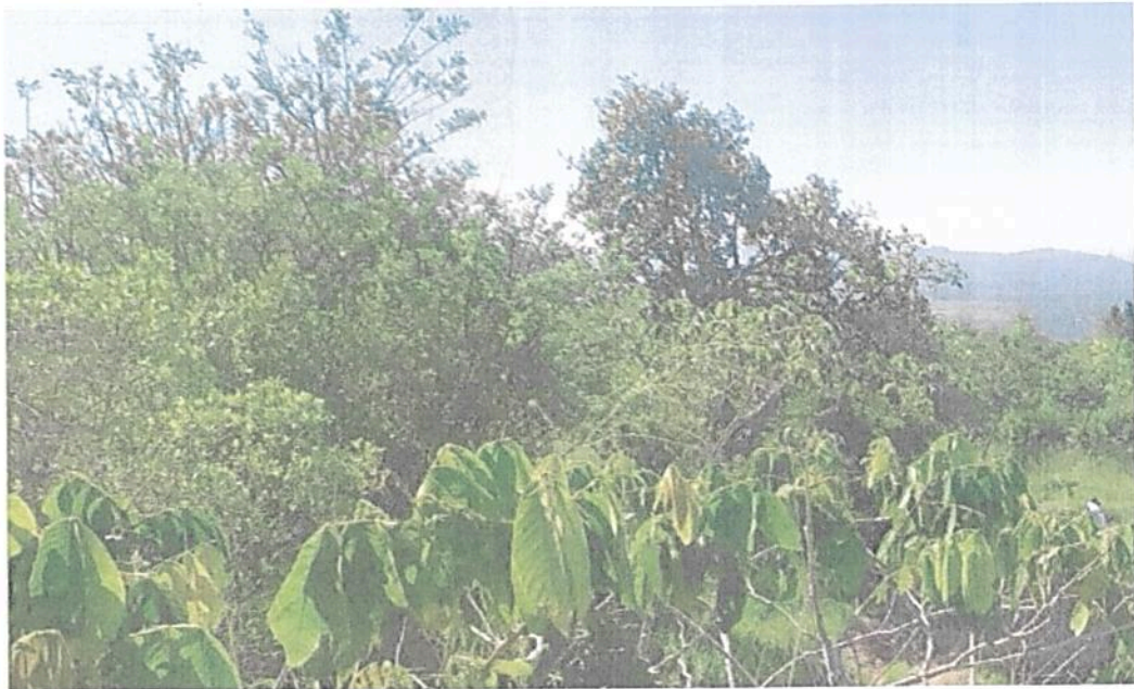
Figura 4. Zona de conservación del predio denominado "SIN INFORMACIÓN" identificado con FMI No. 302-616, que conforman la RNSC "BIOPARQUE MONCORA 3".

Esta zona corresponde al 9,0 % del área total a registrar, es decir a 0,0621 ha del predio denominado "SIN INFORMACIÓN" identificado con FMI No. 302-616 y está conformada por la muestra de ecosistema natural de Bosque Seco tropical (Bs-T), representado por una cobertura de vegetación secundaria pastos enmalezados y suelo desnudo o con escasa vegetación rasante y bosque ripario.