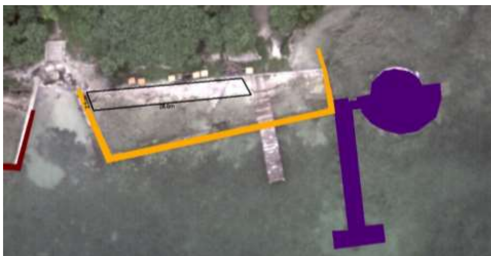
Figura N° 2