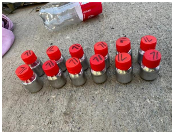
Foto 1: Procedimiento de Control a la Minería Ilegal en lugar denominado “El Chalet”: Dos personas con víveres y elementos químicos utilizados para minería.